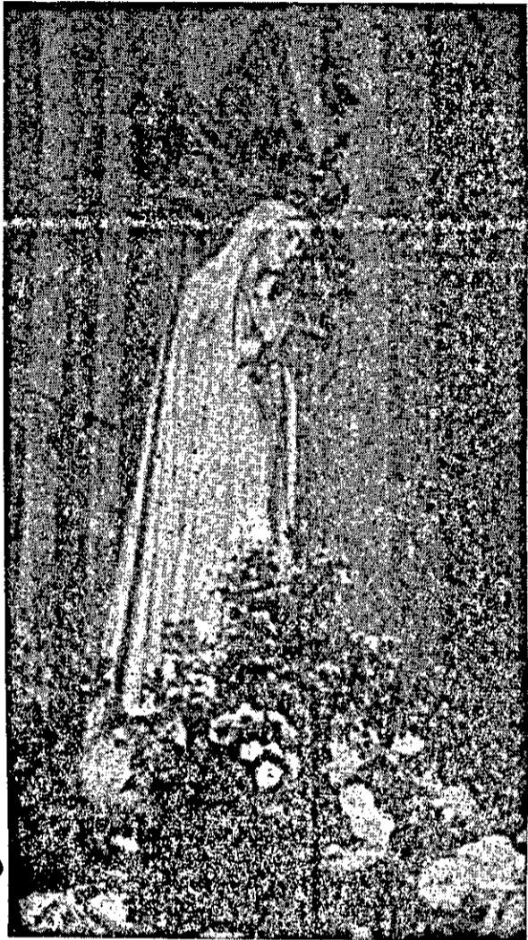
A imagem de Nossa Senhora do Rosário de Fátima é mostrada ao povo, após a festa do Bom Jesus dos Navegantes. Aclamada pela grande multidão que se comprimia na praça, a imagem se destacava branca e meiga em seu andor florido. Através dela, o povo prestava homenagem à sua Padroeira, Nossa Senhora do Rosário de Fátima. Foi uma verdadeira consagração popular. De pé, ao lado do andor, o Bispo Diocesano leu para os fiéis o documento da Santa Sé. Guardem os leitores essas duas datas: Outorga do Breve Apostólico, a 12 de janeiro de 1962. Leitura do Breve aos diocesanos, a 27 de janeiro de 1963.

João XXIII, no Breve Apostólico "Quae Bellum"