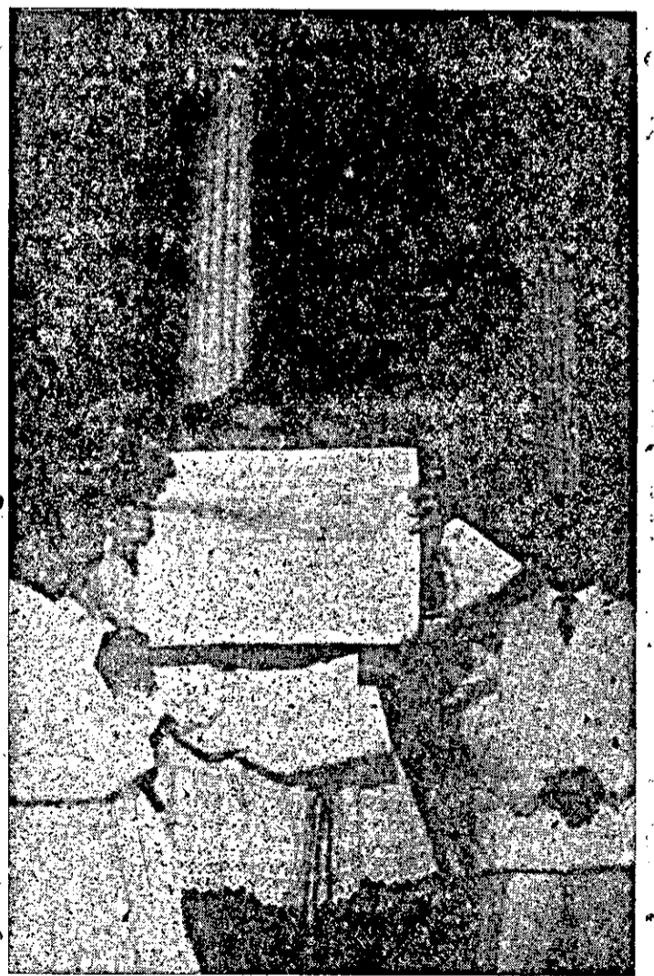
27 de janeiro de 1963. Perante os milhares de fiéis que se aglomeravam na Praça da Catedral, Dom Jesus Brandão de Castro leu o Breve Apostólico, pelo qual Nossa Senhora do Rosário de Fátima foi declarada Padroeira da Diocese. O flash fixou o momento, em que o Bispo Diocesano mostrava aos fiéis o pergaminho do Breve. Uma explosão de entusiasmo saudou o gesto de S. Excia.

"Entrai pela porta estreita, porque larga é a porta e espaçoso o caminho, que conduz à perdição, e muitos são os que entram por ela" (Mat. 7, 13).