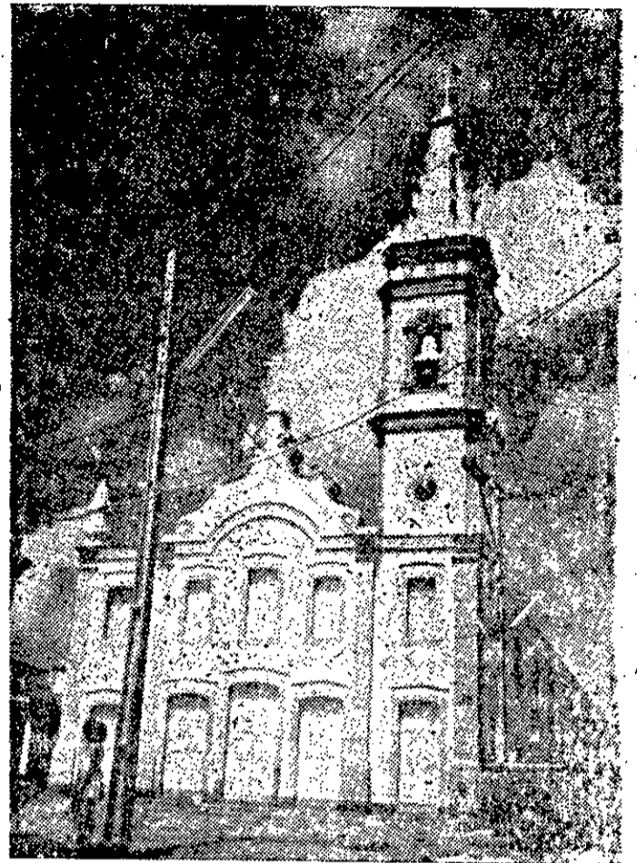
Santuário da Padroeira Principal da Diocese de Propriá - Nossa Senhora do Rosário de Fátima.