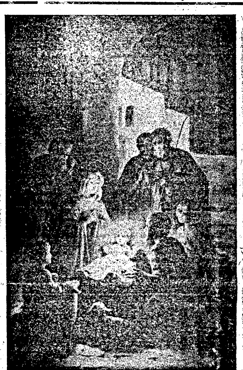
RESIDÊNCIA AGRÍCOLA DA CVSF EM PROPRIÁ NA VANGUARDA DO DESENVOLVIMENTO