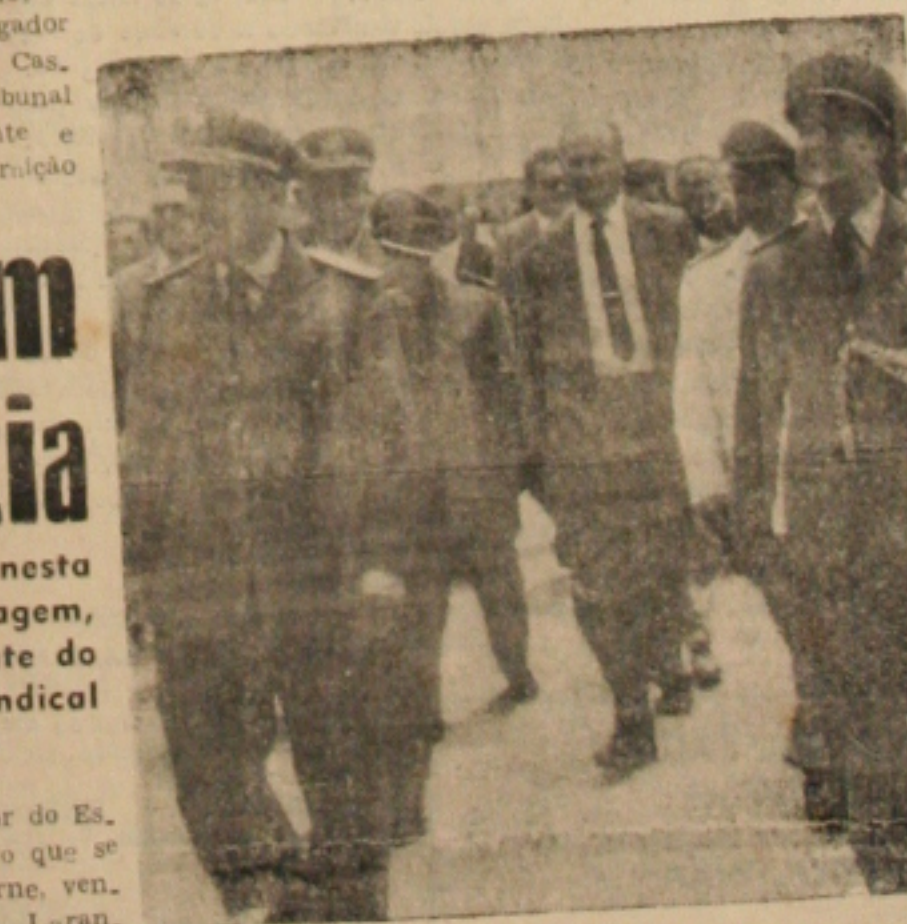
Ministro da Marinha ao desembarcar em Aracaju

da Marinha seguiu de auto- movel para o centro da ci- dade, tendo deixado o auto, nas imediações do Iate Clu- b. Continua na 6a. página