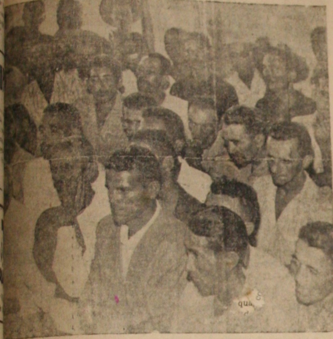
Esse pescadores pediram justiça ao Ministro Angelo Nolasco

DE CEM PESCADORES REPRESENTA- DOIS MIL COMPANHEIROS QUE AM FOME