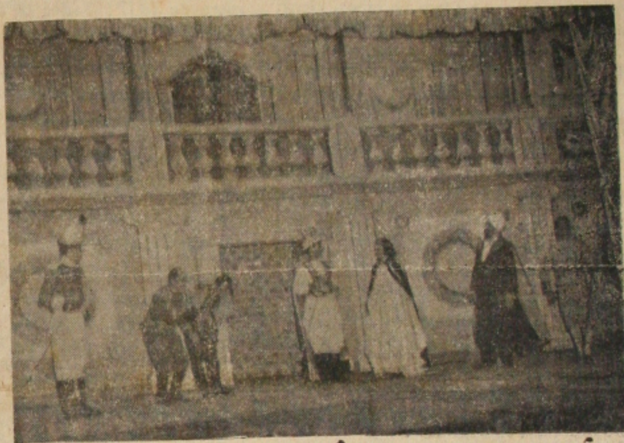
Flagrante da peça de Lúcio Flauz, «O Soldadinho de Rei»

Já se encontra nesta Capital o harmonioso conjunto Teatral «Os Dionysos» que, aqui, sob os auspícios da Sociedade de Cultura Artística de Sergipe, apresentará a fantasia infantil de Lúcio Flauz «O Soldadinho de Rei», hoje às 20,30 horas, no Auditorium do Colégio Estadual.