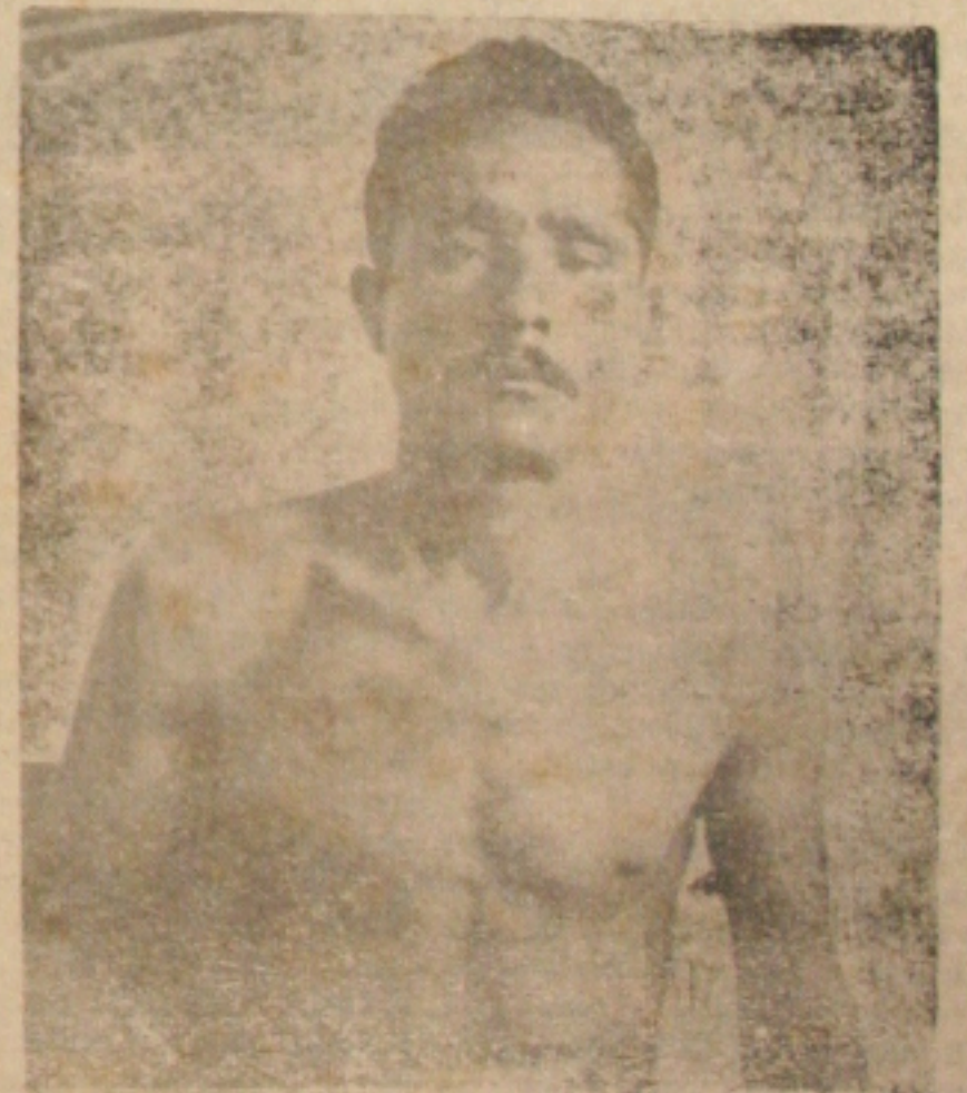
O «Poeta do Arrojado» mostrou à reportagem as marcas da grande surra que tomou