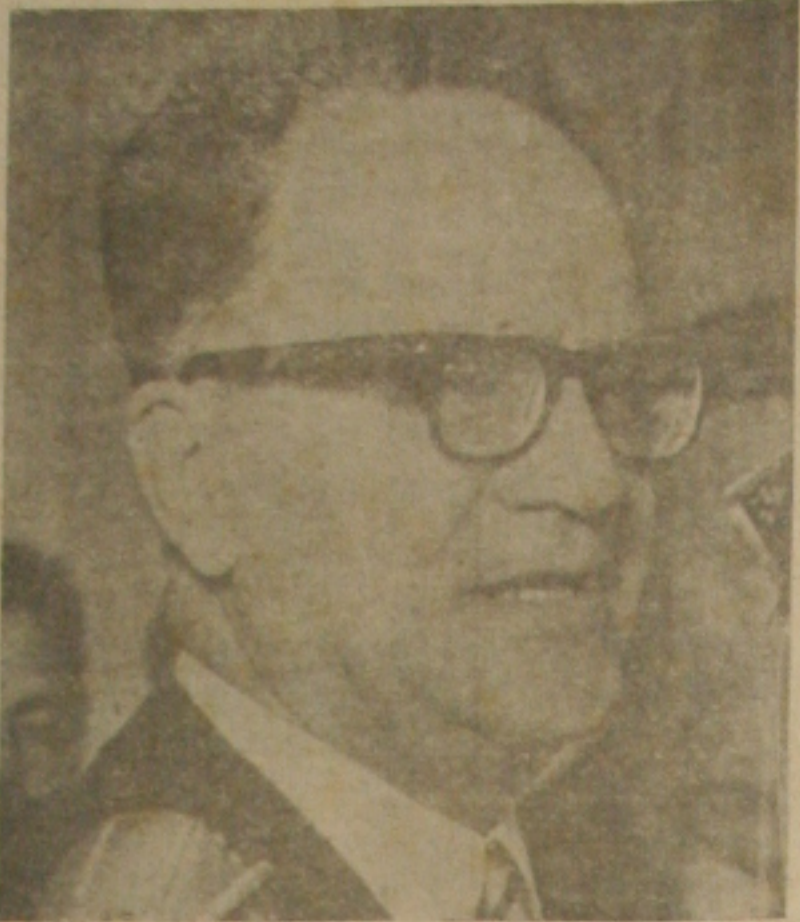
Ministro Hermes Lima