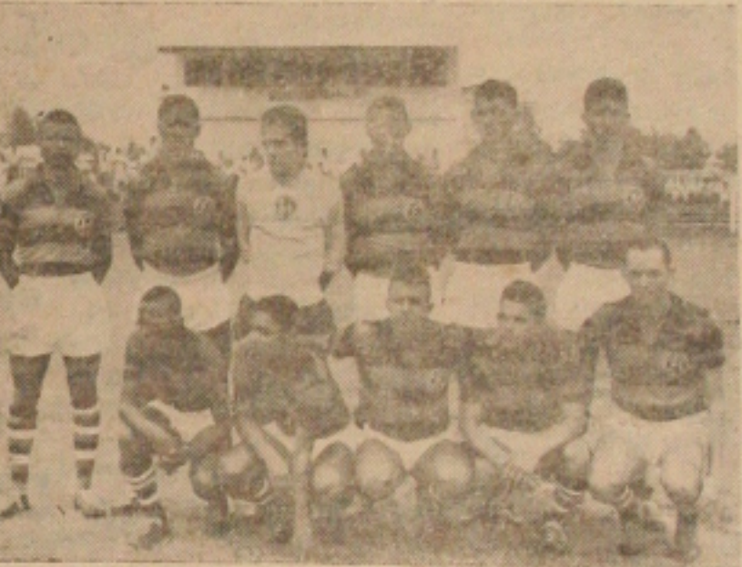
FLA FLU À VISTA — O quadro do Olímpico que domingo jogará contra o Passagem Pelos seus uniformes, reeditarão o Fla-Flu carioca.

Local de Negócio, com Residência de primeira, anexada ao ponto, por motivo de mudança VENDE-SE. A Tratar Rua Itabaiana 778. Nesta