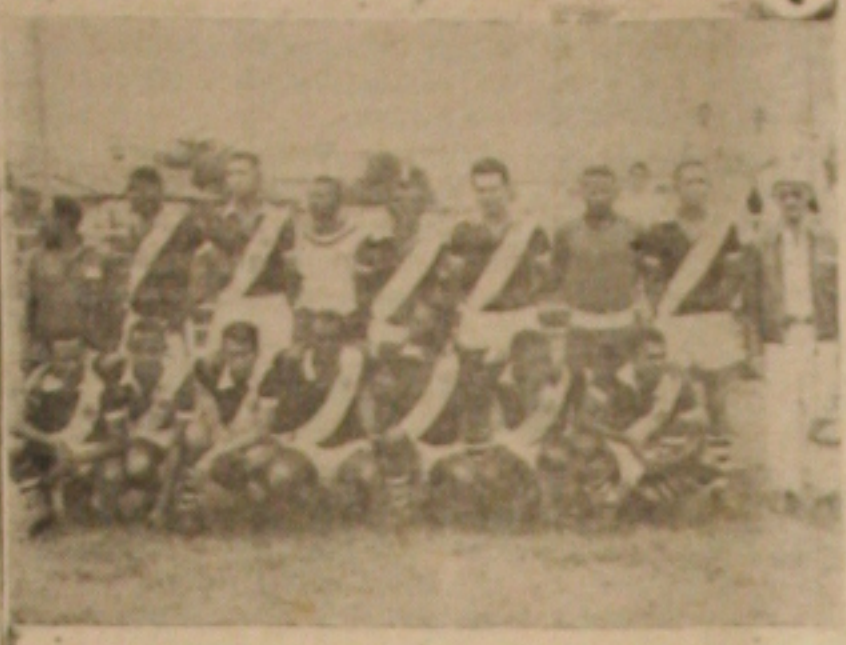
VASCO EM PROPRIA — O quadro do Vasco, que depois de amanhã enfrentará a Propriá em seu campo, em pe- leja noturna.

Em prélio amistoso que já está sendo aguardado debaixo de viva expectativa pelo público esportivo propriense, atuarão de pais de amanhã à noite em Propriá, as equipes do Vasco desta Capital e do clube local do mesmo nome.