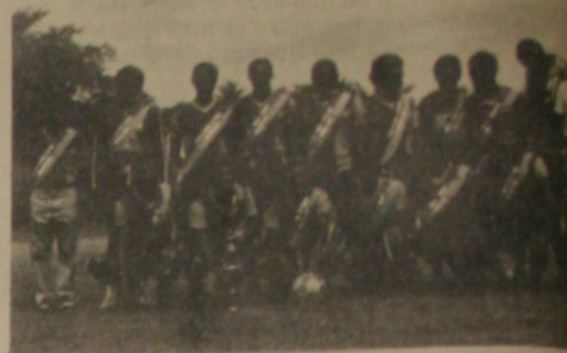
O time da Fábrica Riachuelo, brilha no certame da F

O certame de futebol patrocinado pela Fundação de Atletas de Sergipe, prosseguiu no último domingo pela realização de dois jogos. No encontro preliminar, a Diferentes aplicou 6 a 1 na formação do Amazonense fundo, o time da Fábrica Riachuelo venceu por 1 a 0 Colinense.