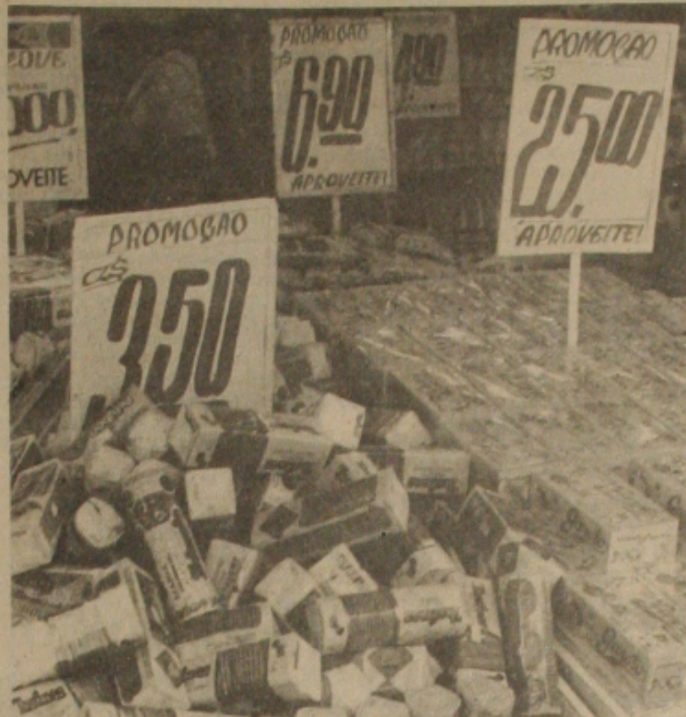
Comércio reabre com ofertas e cruzados.

Mais de trezentas denúncias foram feitas ontem à SUNAB em Sergipe, pela população da capital e do interior. As denúncias mais comuns foram de alterações de preço de carnes e refrigerantes, material de limpeza, açúcar, ovos, carne e farinha.