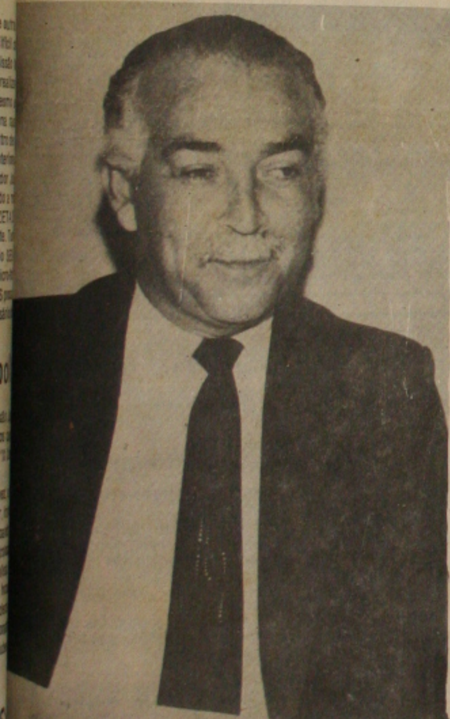
Paixão: é necessário assistir aos mais humildes.