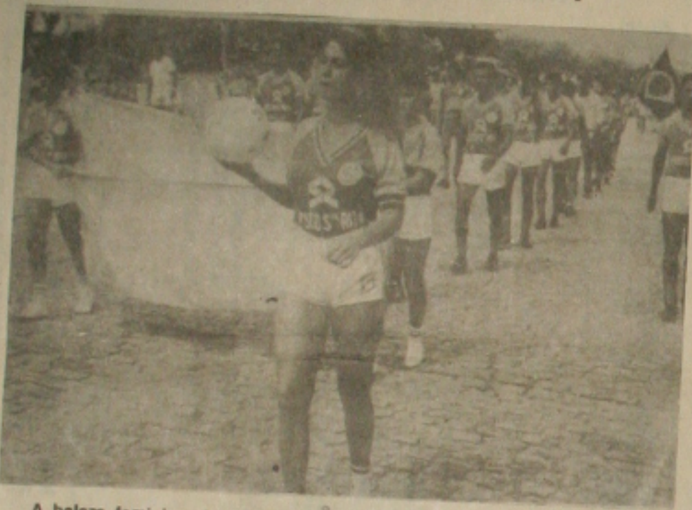
A beleza feminina, também participará do "II Torneio Intermunicipal do Sesi".