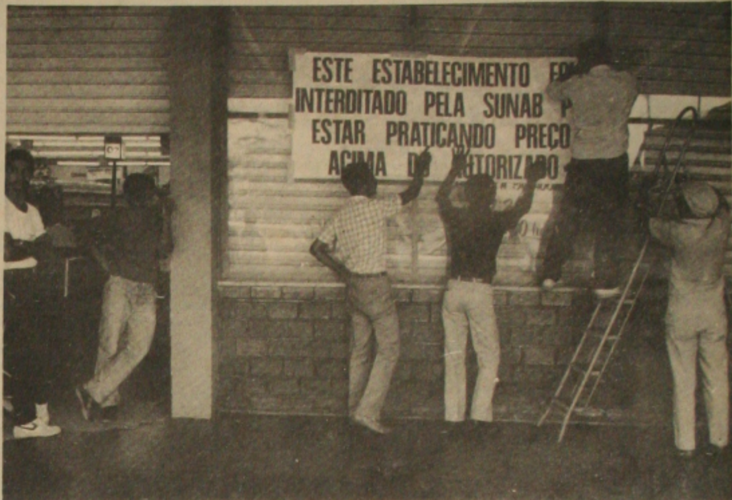
Fiscais da SUNAB colam o aviso público.