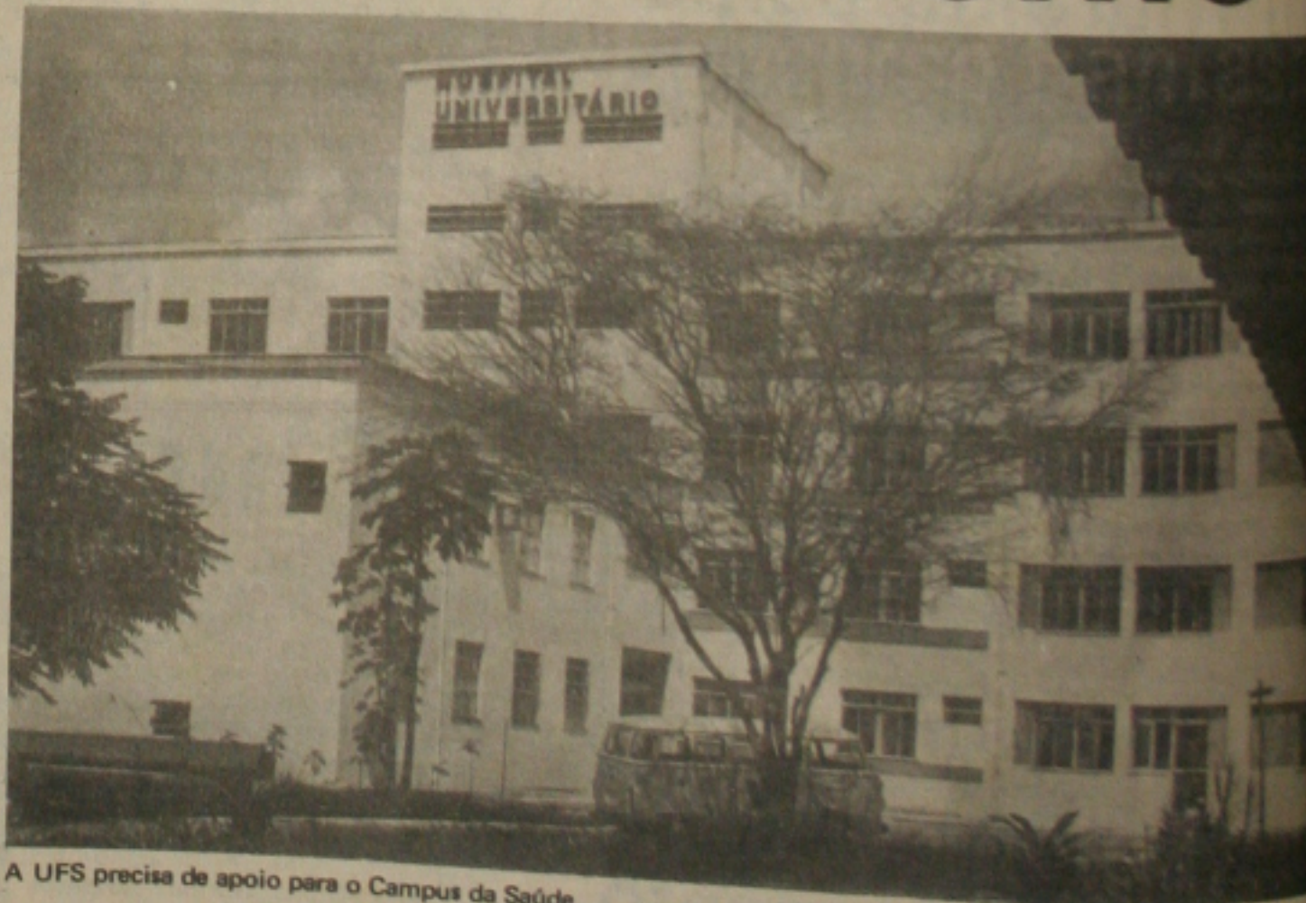
A UFS precisa de apoio para o Campus da Saúde.

A estrutura física recentemente construída conta ainda com os prédios de anatomia patológica, 330m 2 ; estação de tratamento de esgotos em torno de 500m 2 , serviços gerais, 150m 2 ; vestiários e início da construção de um pavilhão com 900m 2 destinado à Administração Departamental e salas de aula, obra que viabiliza a transferência, ainda este ano, dos cursos de Medicina e Enfermagem para o Campus da Saúde, caso seja possível a contratação do pessoal ne-