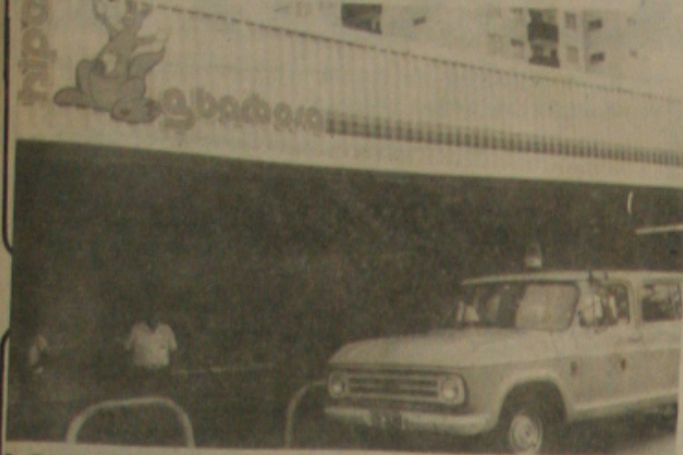
3. Barbosa fecha as portas após desobedecer congelamento.

IAPAS e SENAC... Face a grande procura pelas empresas para inscreverem seus funcionários no curso de Legislação do Custeio da Previdência Social e o número de inscrição ser limitado, o IAPAS está anunciando novo curso, também em convênio com o SENAC a ser iniciado no dia 07/04/86 com 30 horas/aulas. Esse curso será ministrado por Fiscais Internos Regionais de Trabalho no (NRTE) do IAPAS, introduzindo as novas modalidades econômicas, nova sistemática de cobrança do IAPAS, as novas contrapartidas no SENAC e o turno.