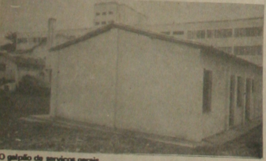
O galpão de serviços gerais.