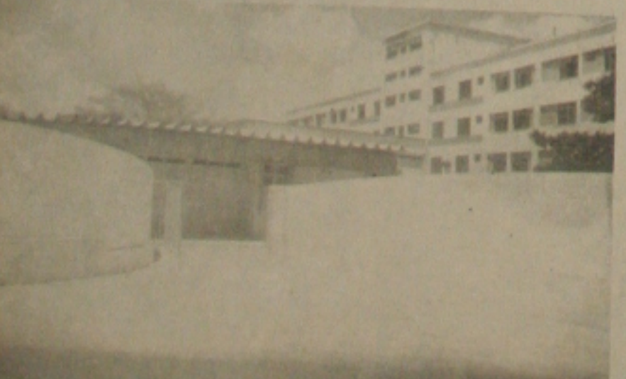
O prédio de anatomia patológica.