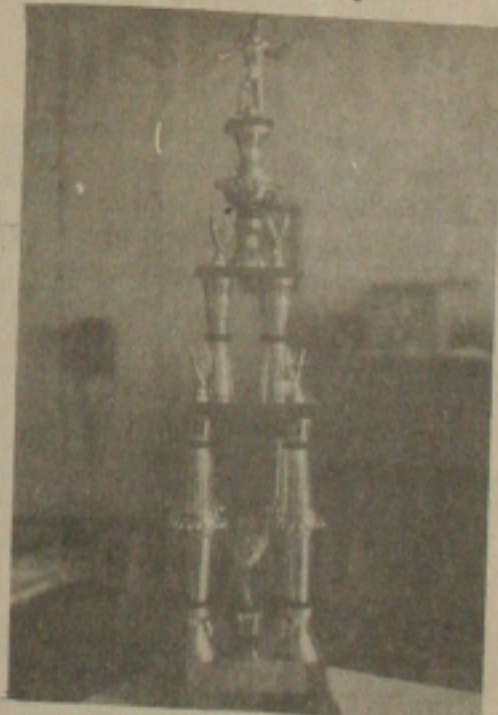
Este o troféu conquistado pela GS em Rosário do Catete.

Em Rosário do Catete, a exibição da GS deixou os moradores entusiasmados principalmente por causa do excelente futebol apresentado pelo extrema-di-