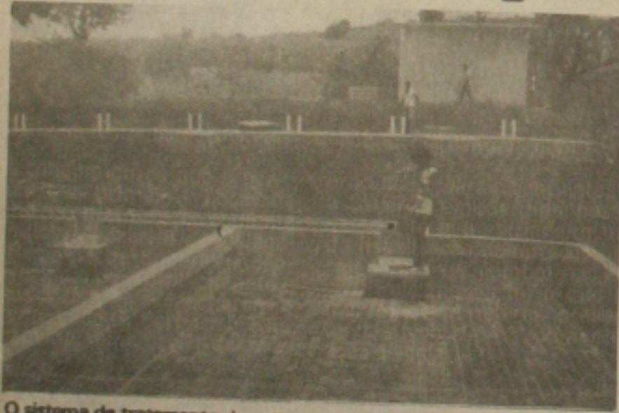
O sistema de tratamento de esgotos.