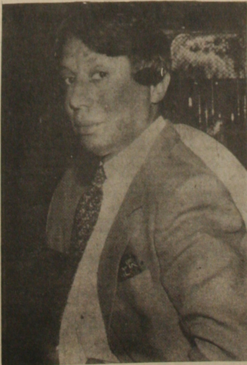
Clodovil ameaçado pela Censura.

A atenção da Censura não se concentra atualmente apenas para a novela Selva de Pedra que vem sofrendo pressão de mais de 20 mil pessoas que, em abaixo-assinado, solicitou a Polícia Federal, providências, contra o que consideram abuso e imoralidade nas cenas de amor. Clodovil também está na lista dos indecentes e a Manchete já foi chamada às falas. A Veja que está circulando velucamente esta notícia, informando ainda que contra o famoso estilista pesa a ira de milhares de telespectadores, de diversas partes do Brasil e o próprio chefe da Censura, Coriolando Fagundes está de olho no programa dele, Clô para os Íntimos advertindo a Rede Manchete para, ou orienta Clodovil a não exagerar nos trejeitos ou coloca o programa em outro horário, ou, se, uma coisa nem outra, tira o programa do ar.