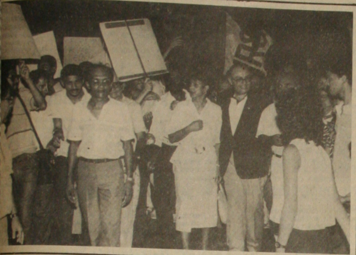
Teixeira já está em campanha