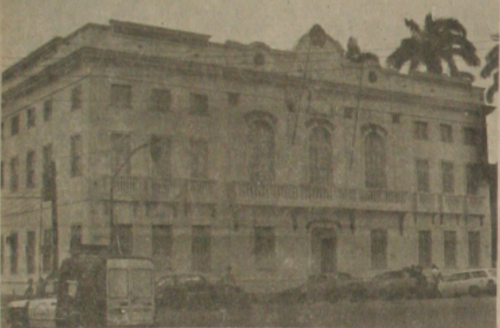
Dentro em breve este velho prédio ficará ocioso, com os seus ocupantes se transferindo para