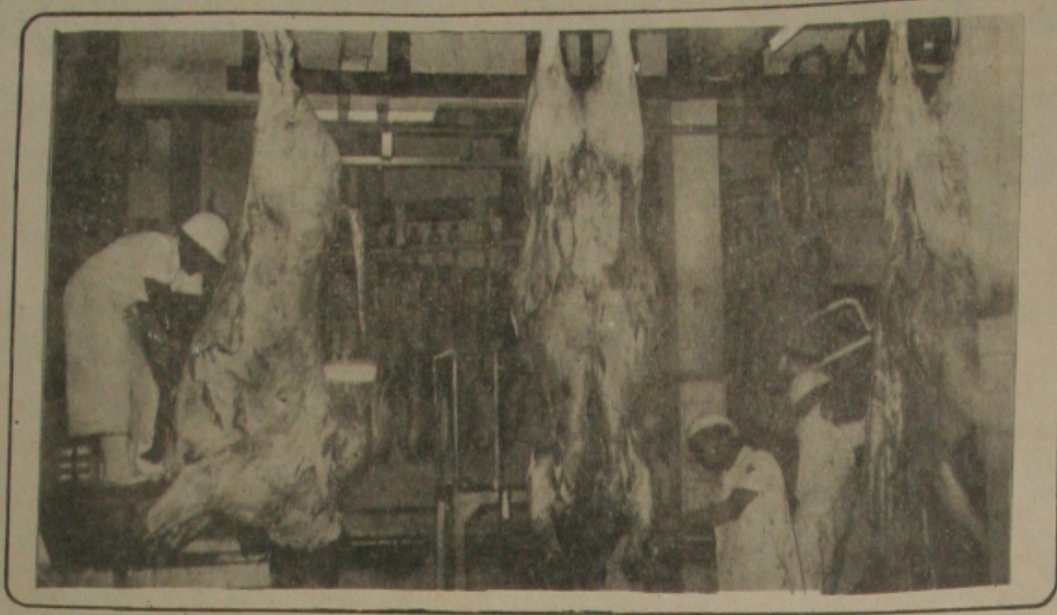
O Frigorífico de Sergipe, começa normalizar o seu funcionamento.