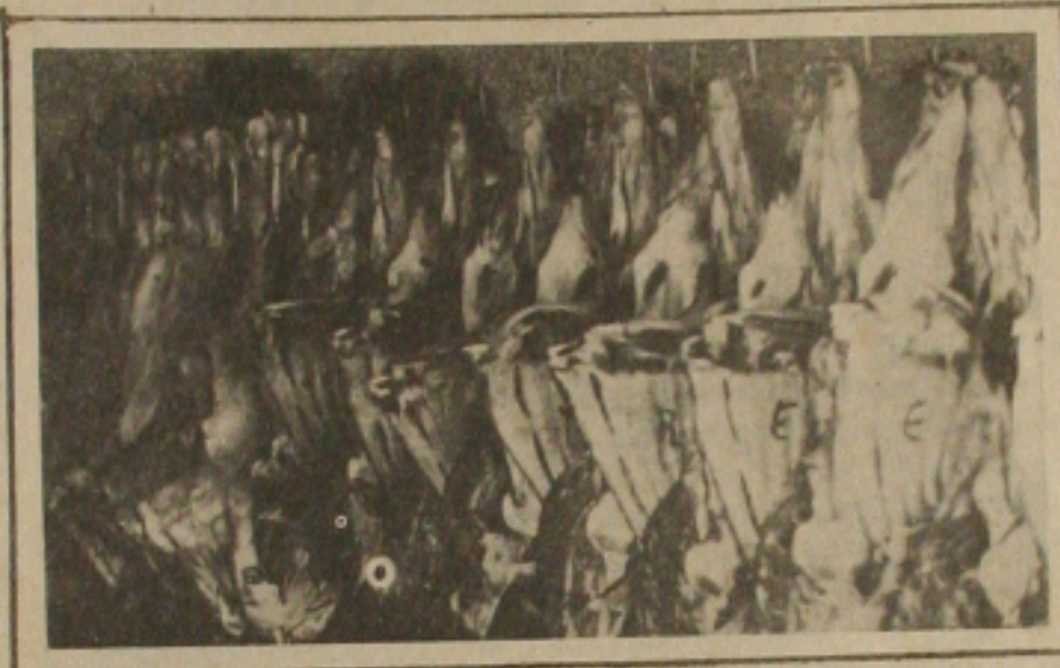
O Frigorífico Aracaju começa a normalizar fornecimento.