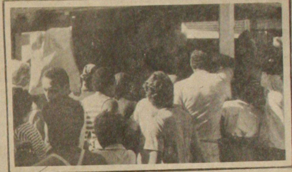
No último fim de semana os consumidores disputaram o quilo de carne bovina.

até o final desta semana o aracajuano já estará consumindo carne congelada do estoque regulador do Governo Federal. No último final de semana mais uma vez o consumidor aracajuano viu-se obrigado a fazer outras opções por falta da carne bovina. Os órgãos responsáveis pela fiscalização não demons-