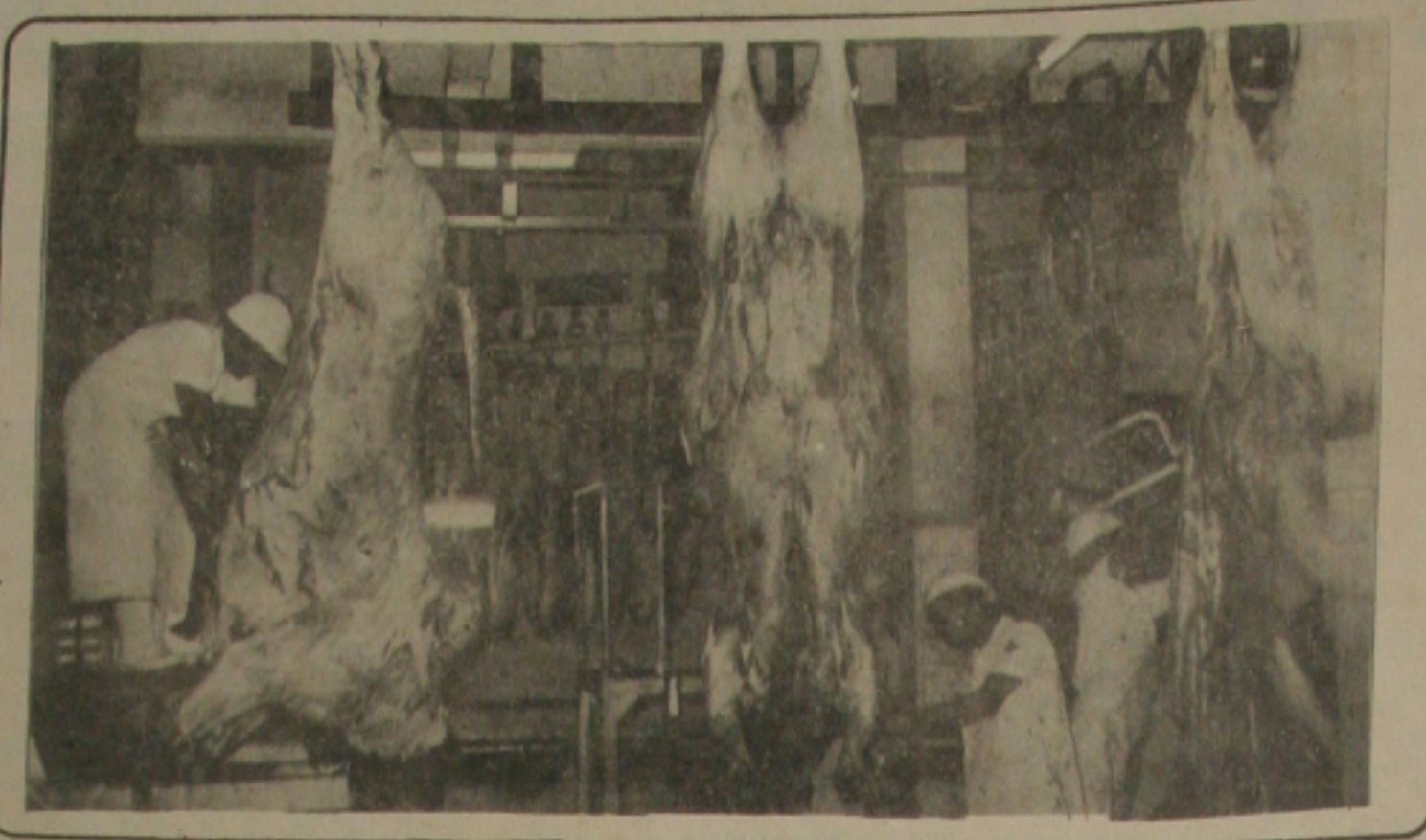
O Frigorífico de Sergipe, começa normalizar o seu funcionamento.