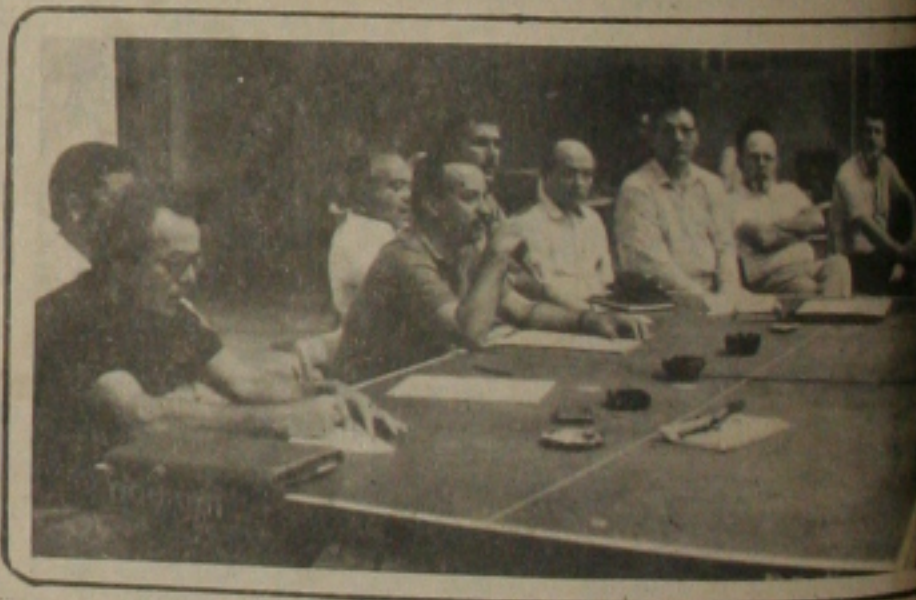
Valadares reúne-se com cooperativados de Sergipe.

O compromisso de realizar uma administração voltada para o fortalecimento do cooperativismo, como forma de incentivo ao pequeno produtor, foi assumido pelo candidato do PFL ao Governo do Estado, Antônio Carlos Valadares, ao participar de uma reunião com produtores da Cooperativa Agrícola de Estância, organizada pelas lideranças rurais locais.