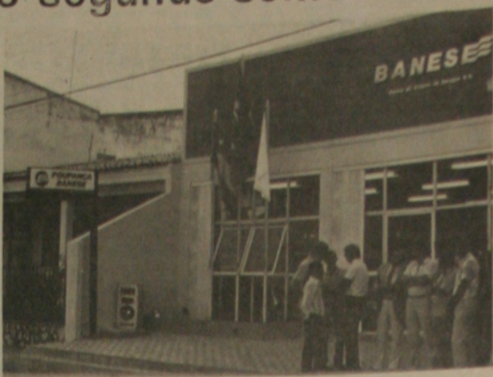
O BANESE - Banco do Estado de Sergipe, com recursos do Banco Central vai investir firme na agricultura sergipana.

Ainda na área da indústria, o Banease já está solicitando às BNDS novas dotações para aplicações no segundo semestre, diante da grande clientela que surge no estado a cada dia.