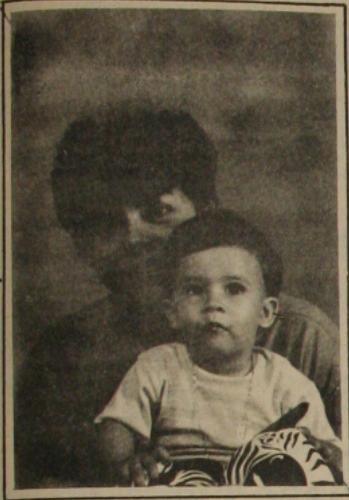
ELEGIA DO FRUTO NASCIDO