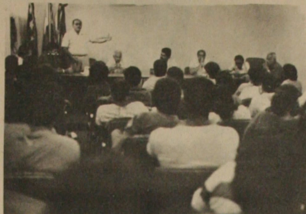
Candidatos peemedebistas discutem com funcionários públicos.