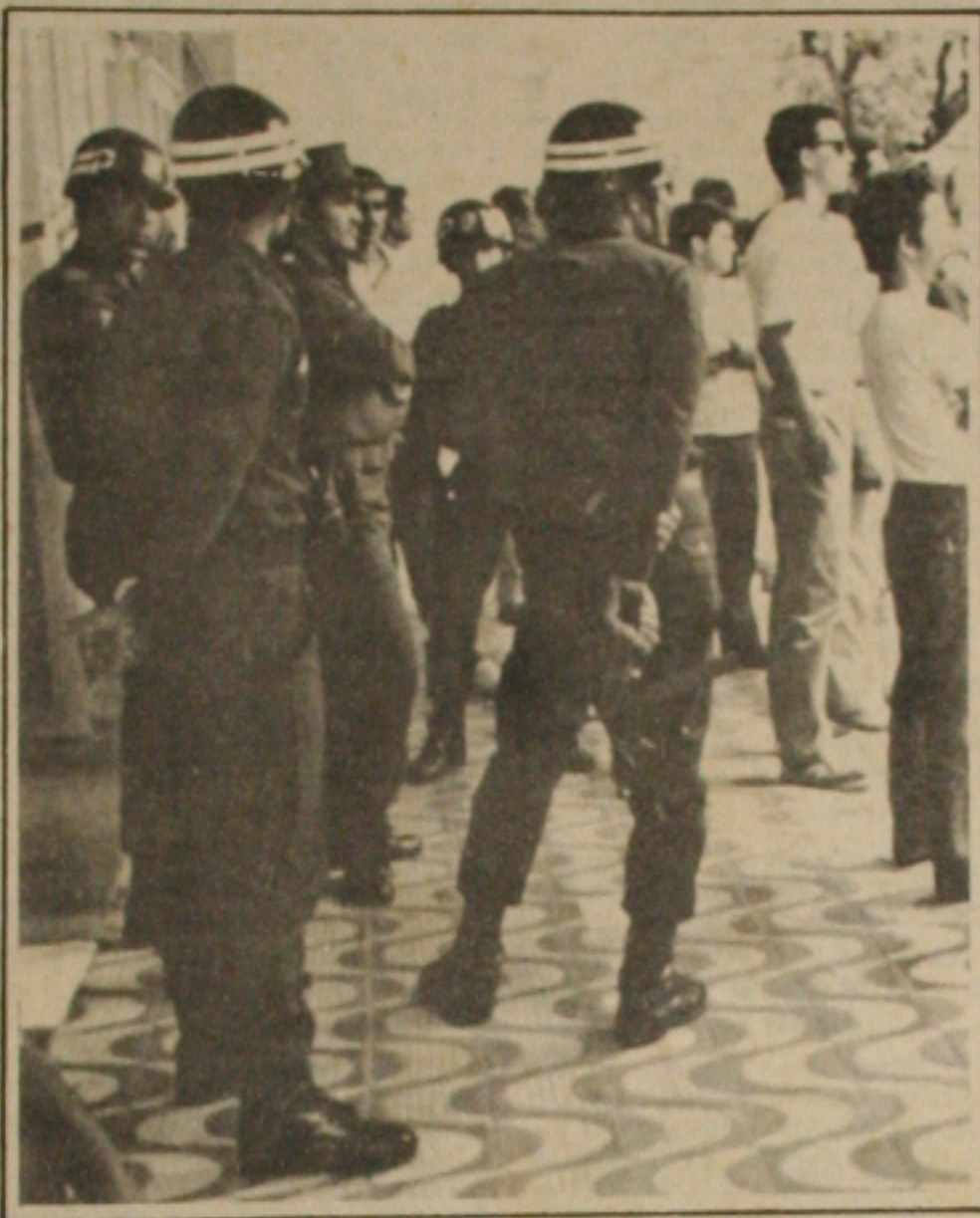
A Polícia agiu ostensivamente em frente as Agências Bancárias.

O Sindicato dos Bancários conseguiu ontem em Aracaju, sustentar a greve, com a adesão de 70 por cento da categoria, embora o Banco do Brasil funcionasse com todas as suas agências em Sergipe, o Bradesco e o Itaú também abriram algumas agências, mas com um expediente bastante precário. A presença de soldados da PM portando metralhadoras, não intimidou os bancários que decidiram manter a greve numa assembléia realizada às 4 horas da madrugada. A unidade da categoria foi quebrada às 9 horas, quando funcionários do Banco do Brasil retornaram ao trabalho. (Cobertura completa pág. 02).