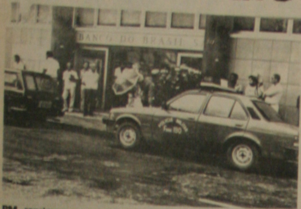
PM reprimem a manifestação em frente ao Banco do Brasil.