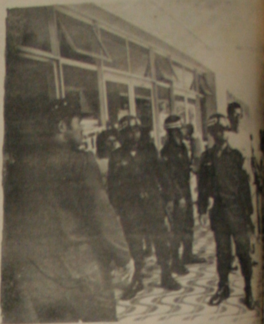
Lembrando o Chile de Pinochet, a PM salu às suas armadilhas amedrontar a população.