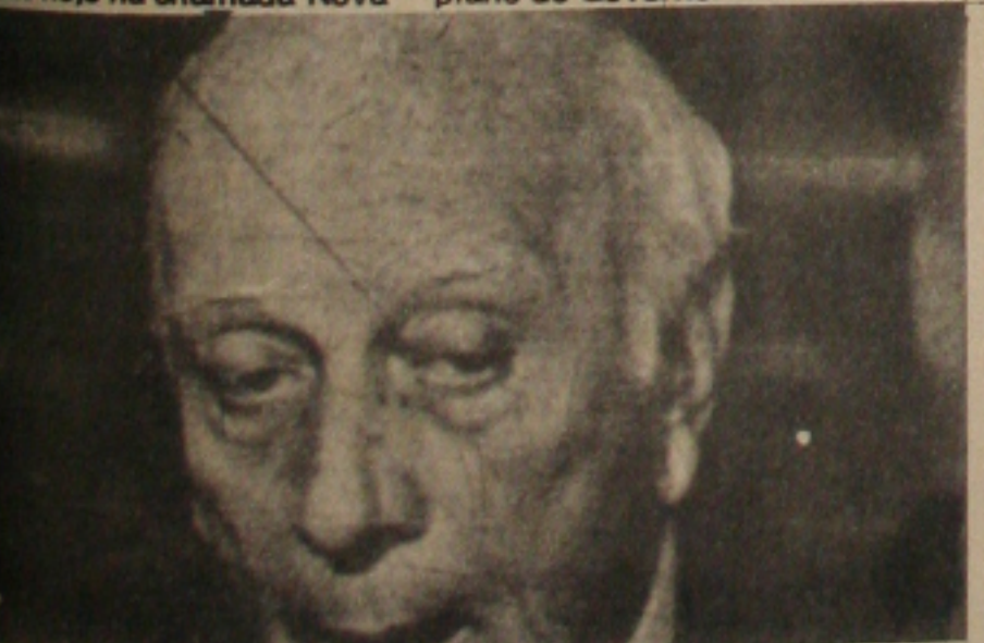
Ulysses: Governo vai agir para garantir abastecimento.

ta noite, antes marcada para o Maracana, mas transferida a pedido do Flamengo, para o Caio Martins em Niterói. Se no Sergipe o ambiente é de intranquilidade, no Confiança ontem à tarde o zagueiro Luis Carlos abandonou o treino, pois não aceitou a escalção do treinador, no time reserva. Duque exige uma punição para o zagueiro proletário. Hoje o Confiança faz coletivo definindo a equipe que amanhã enfrentará o Fluminense em Feira de Santana. (Esportes pág. 08)