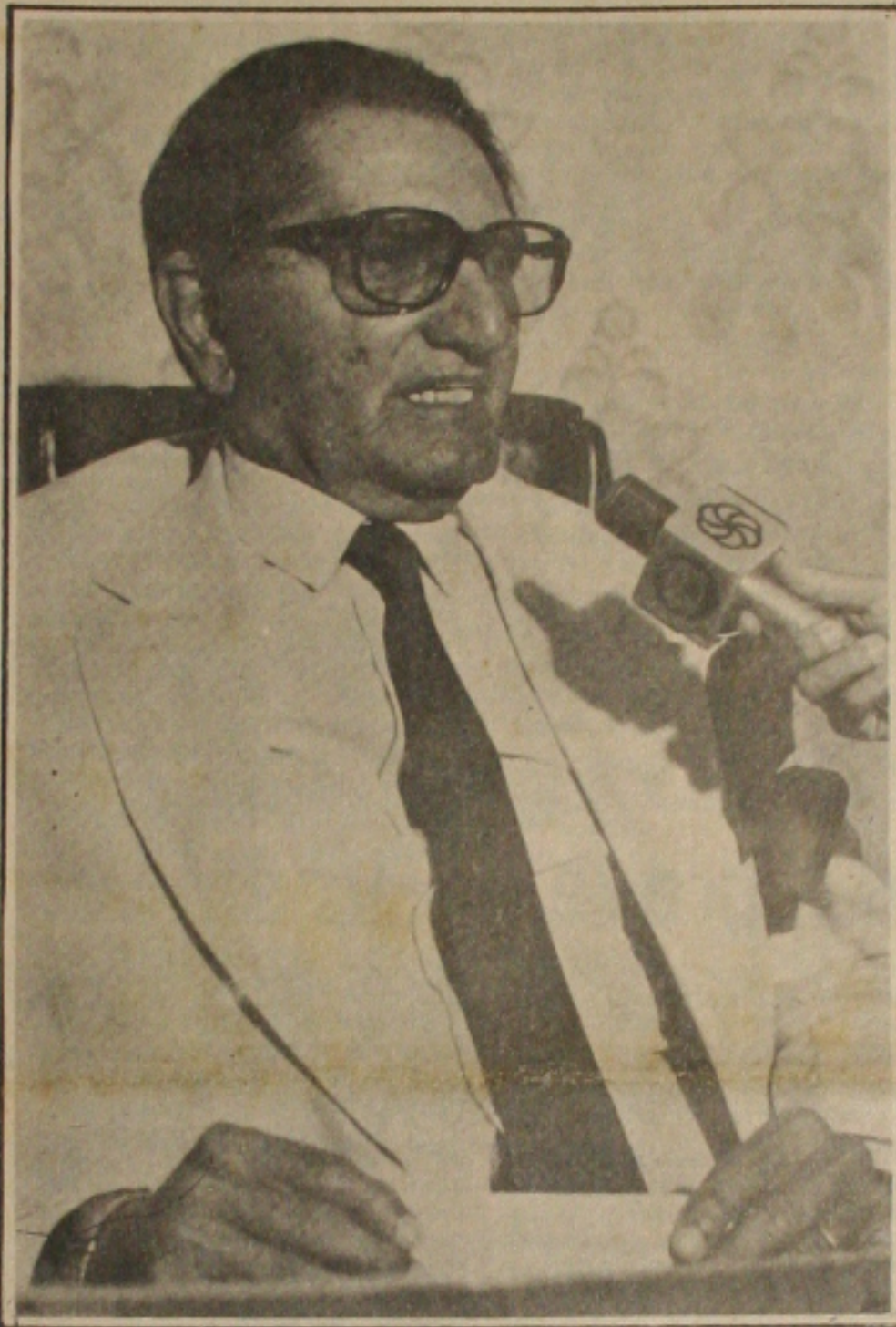
Presidente do TRE anuncia a proibição aos bonecos do PT.