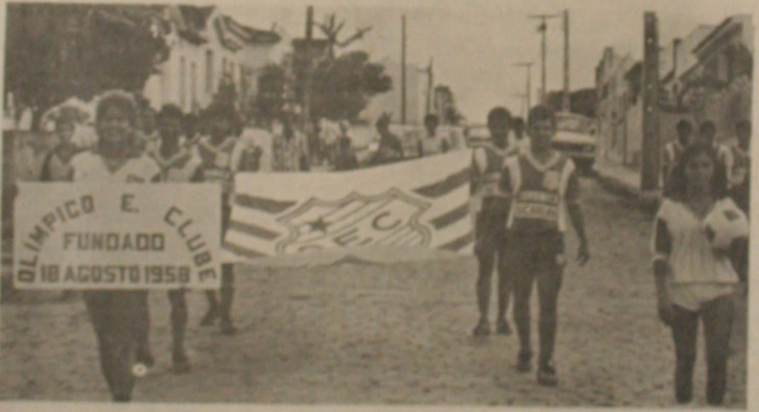
Desfile em Sabará.

Entre outros as equipes campeãs das equipes e das partidas iniciais realizadas no interior Sergipe no último domingo: ESTÂNCIA - campeão do dialeto. Ponta Preta campeão do dialeto de Oliveira; São Paulo campeão do dialeto de Estância; Fátima campeão do dialeto de Uniãoviçosa; Tomar de Góes campeão do dialeto de Sabará; Raposo L'Ágida campeão do dialeto de Tullius Barreto.