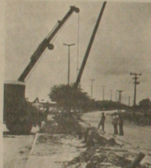
Os altos postes já estão sendo colocados ao longo da Avenida Tancredo Neves.

Os serviços de implantação da iluminação da avenida Tancredo Neves (antiga avenida 31 de Março ou Contorno), já foram iniciadas e devem ser concluídas antes do prazo previsto pela Prefeitura de Aracaju, determinado para um total de 120 dias. Os postes já estão sendo colocados ao longo da avenida, iniciando-se desde o Viaduto da entrada da cidade em direção a avenida Beira Mar, na Atalaia onde a avenida Tancredo Neves faz confluência.