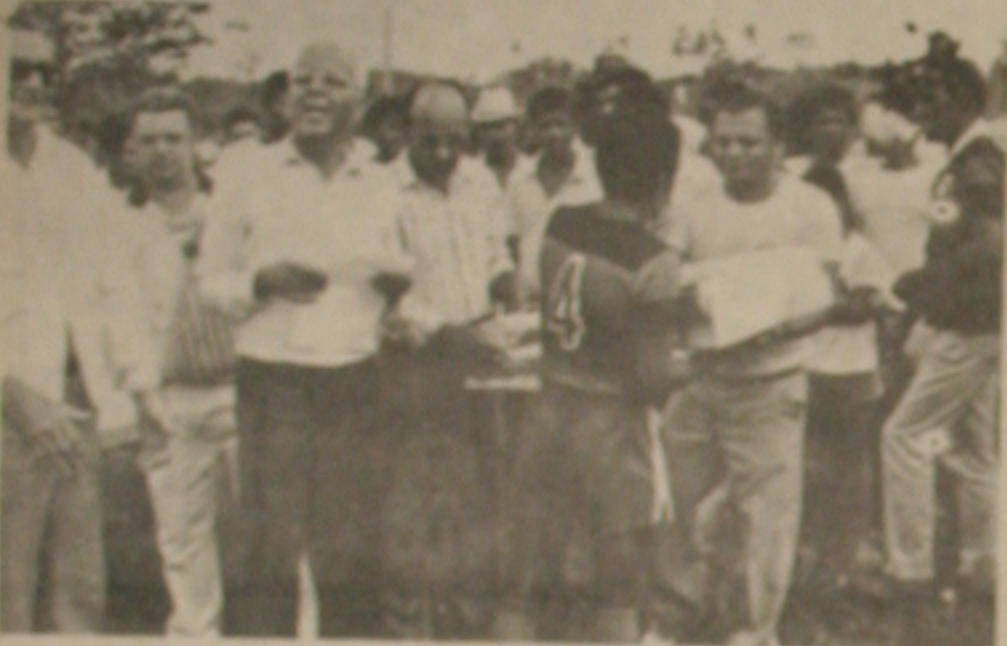
O Diretor Regional do Sesi, Estância, em Estância.