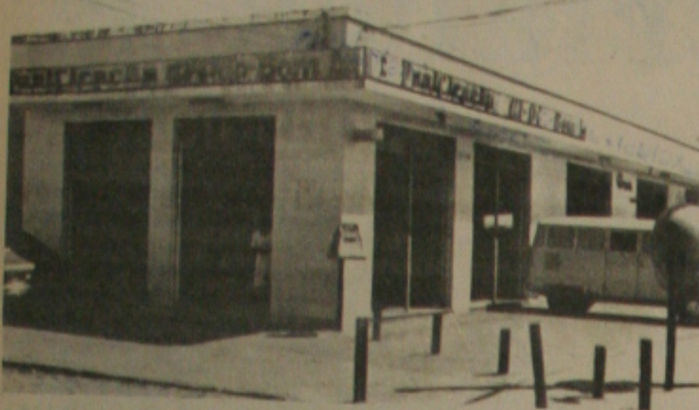
A Panificação só troca o leite se comprar outra mercadoria.