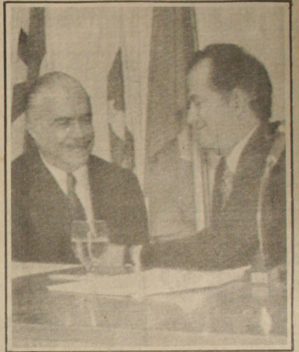
O Presidente José Sarney cumprimenta o senador Albano Franco reconduzido à presidência da Confederação Nacional da Indústria (CNI).

Logo após, todos os convidados participaram de um coquetel oferecido pela CNI, oportunidade em que o Presidente Sarney, acompanhado do senador Albano Franco, foi apresentado a várias autoridades e empresários da indústria brasileira.