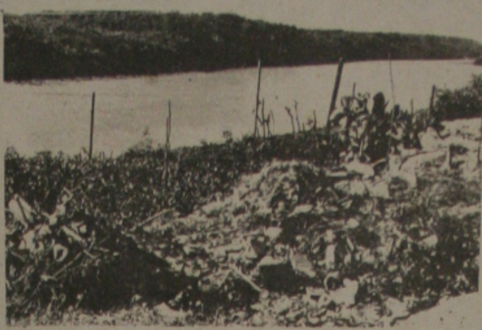
Rio Poxim já poluído pelo lixo.