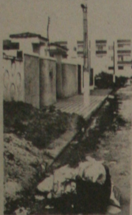
Lixo do Parque dos Coqueiros apodrecendo nas calçadas.

quela localidade está preocupada com os invasores que já cercaram uma média de 12 a 15 lotes nas margens do rio Poxim, e quando indagados sobre quem os autorizou a procederem delimitando terrenos, respondem que, foram autorizados por fiscais da Prefeitura.