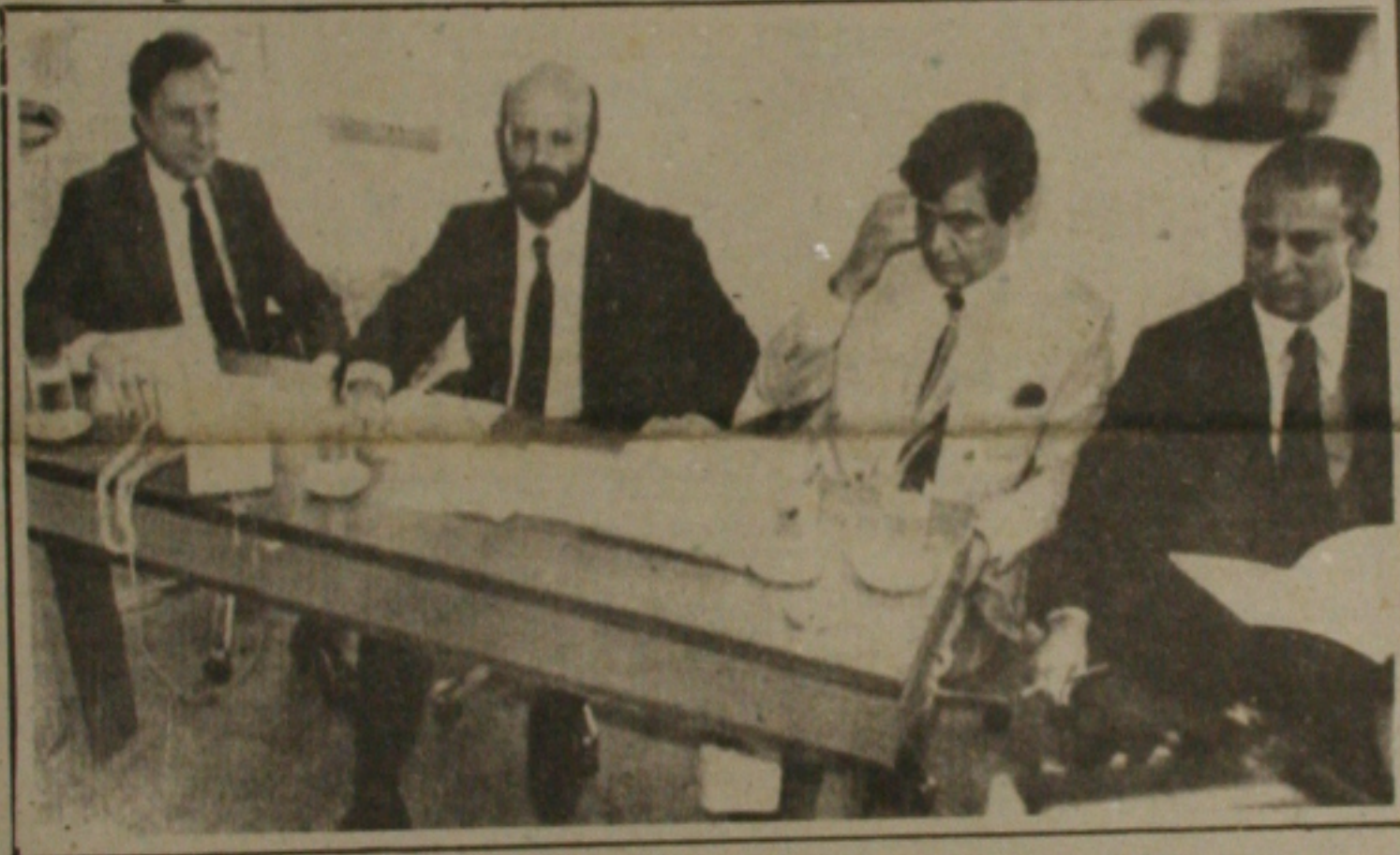
Os ministros Dilson Funaro, João Sayad, Almir Pazzianotto e José Hugo Castelo Branco em reunião com os Governadores

Funaro disse que o ganho dos trabalhadores pode ser mantido através de outros mecanismos que não o gatilho, não adiantou quais. Isso que, segundo Calabi, foi intenção do ministro não trazer "um prato feito para a solução", mas suscitar o debate para que as medidas sejam tomadas através de um consenso, e só assim terão o necessário respaldo político. Calabi, admitiu, entretanto, que o abono das medidas em estudo pelo governo para substituir o gatilho.