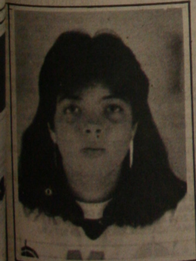
1º lugar em Pedagogia, aluna do 1º ano do 2º grau