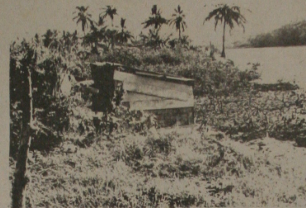
Em meio ao lixo e matagal vão surgindo os barracos.

LEIA A GAZETINHA AOS DOMINGOS EM "PRETO NO BRANCO"