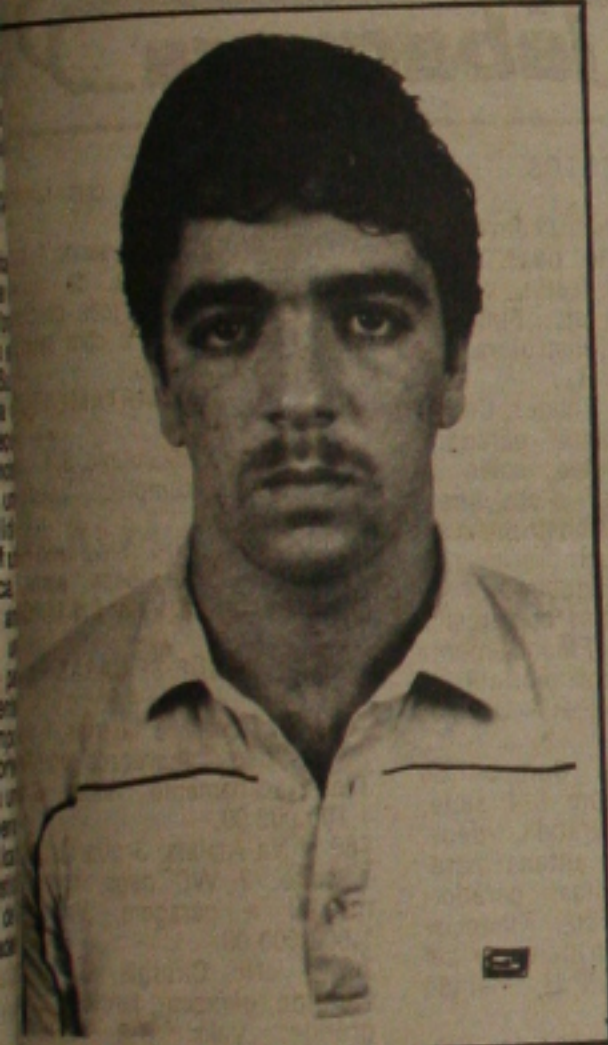
1º lugar em Medicina

Apartamentos com três quartos e suite. Edifício C.A.L. - esquina da Praça da Bandeira com Rua Perimino de Souza, 260. Tratar à noite pelo Telefone: 223-1068 ou na Rua Antônio Alves, 130 - Atalaia. Preço do aluguel C2$ 10.000,00 mensais.