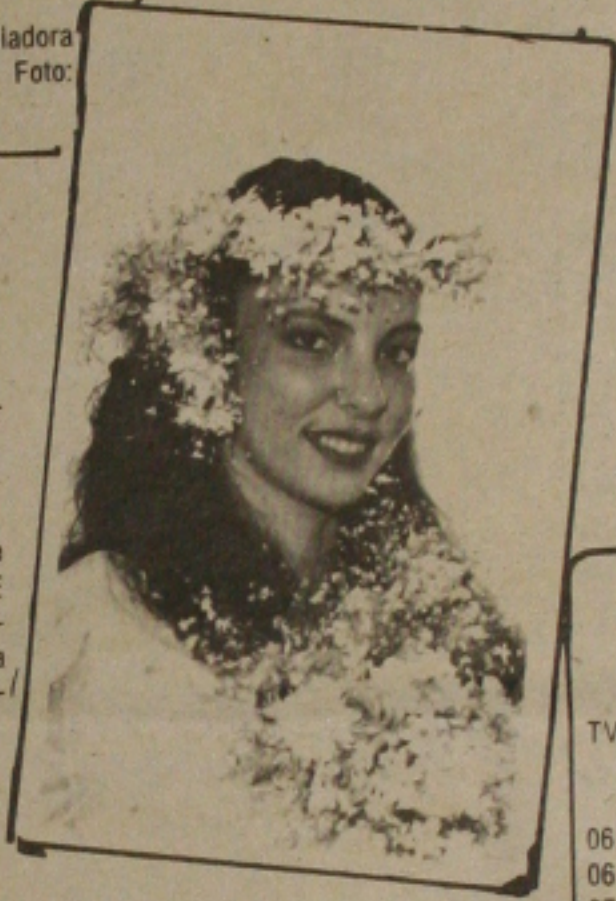
NIVER DE JÃO DE BARROS

GERALDO AZEVEDO Está previsto para o próximo dia 25 deste mês, o primeiro show do ano de 1987. O cantor e compositor Geraldo Azevedo estará na bonita Aracaju, cantando a partir das 21h30min., no Circo Amores e Amores, em única apresentação. Geraldo Azevedo na oportunidade vai lançar seu mais novo disco "DE OUTRA MENTIRA". O show promete arrebentar a boca do balão. A vinda do excelente profissional tem a responsabilidade da M & S Produções.