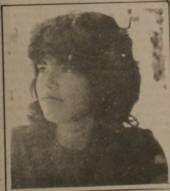
1º lugar em Odontologia, 40 pontos na prova de Português