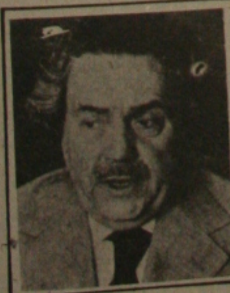
O Ministro Paulo Brossard encerrará o encontro