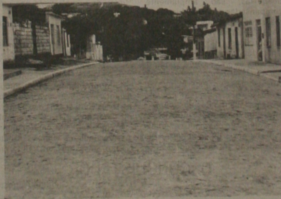
Esta rua no bairro 18 do Forte foi pavimentada a paralelepípedos.

A Prefeitura Municipal de Aracaju confirmou ontem a execução de obras anunciadas recentemente num documento que discrimina todas as realizações da Administração Jackson Barreto, numa média de uma obra por dia. O prefeito da Capital, que se encontra em viagem a Brasília, disse ontem que lamenta as suspeitas levantadas em um jornal local, duvidando da realização das obras constantes na relação. "As obras estão em toda a cidade e a população é a própria testemunha de nosso trabalho", afirma Jackson, acrescentando que seu Governo tem sido marcado pelo cumprimento das promessas feitas nos palanques.