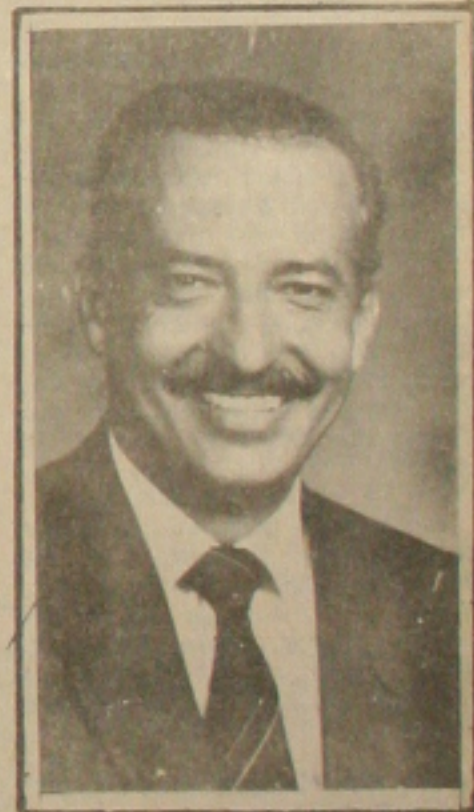
Valadares quer entendimento com o PMDB.

Entendimento PFL / PMDB é possível, diz Valadares