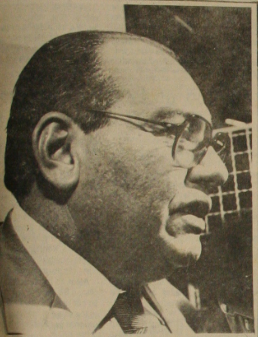
Carlos Teixeira chegou falando de política.

Ele descartou o argumento dos donos de escolas de que o recurso junto ao conselho estadual seja muito demorado. "Não há demora, o processo todo não ultrapassa 60 dias, portanto isso não é desculpa", disse ele. O ministro não comentou as consequências que a paralisação acarretaria, pois acha que nenhum pai vai pagar caso as aulas não se iniciem, e com isso as escolas fechariam. "Não vejo razão para um locaute", finalizou. (Pág. 4)