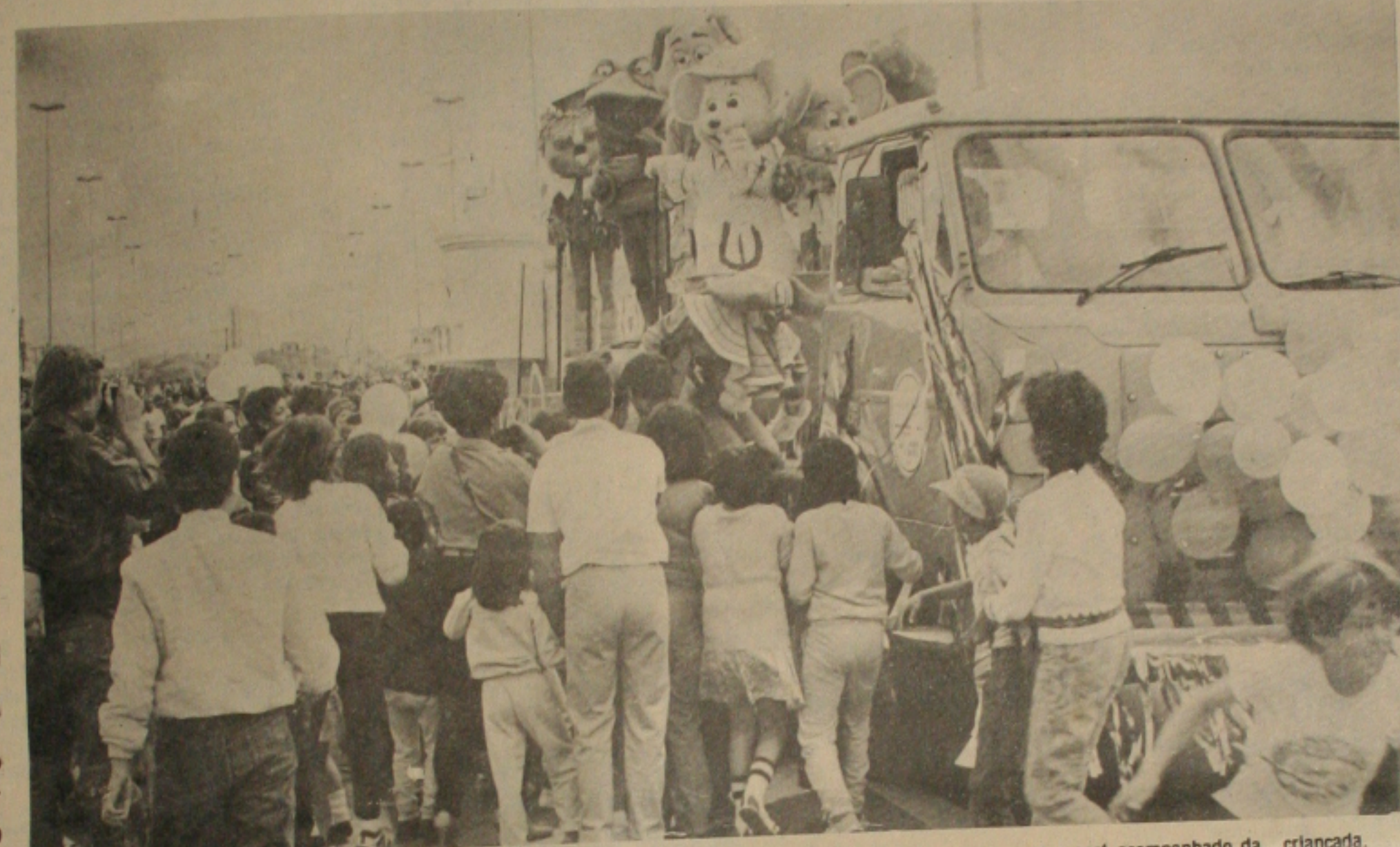
... que será acompanhado da criança.