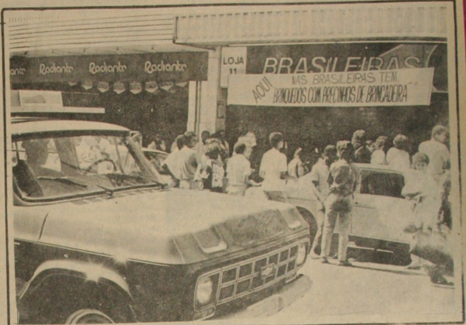
A presença da polícia e as ameaças não foram de "brincadeira", na Brasileira.