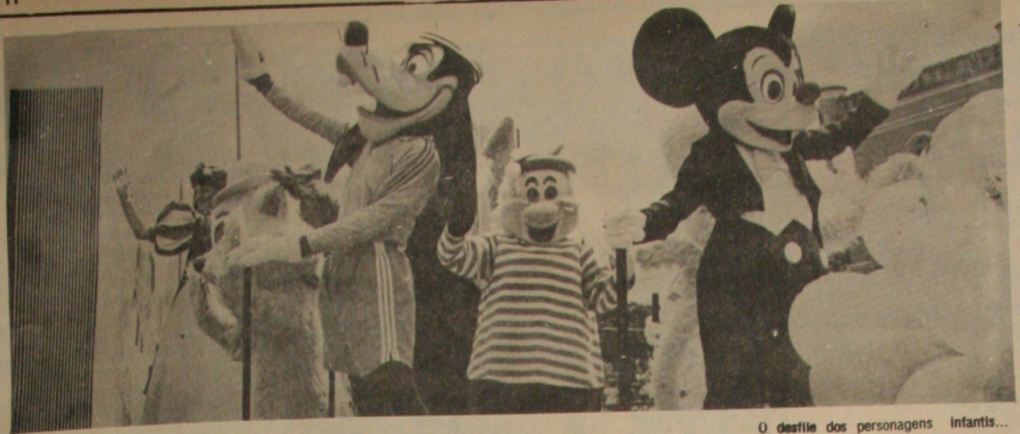
O desfile dos personagens infantis...