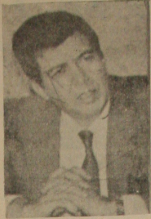
Ministro do Trabalho, Almir Pazzianotto.

Programa de graticos de crescimento que o Governo está implantando, disse que é difícil traçar algum paralelo entre Brasil e Cuba, em razão da diferença geográfica entre os dois países. Além disso, a população cubana é de 10 milhões de habitantes, enquanto a brasileira chega a 140 milhões. "Acredito, entretanto, que deve se iniciar por uma campanha nacional de alfabetização, médicos nas comunidades rurais e alimentação para a população", finalizou o professor Jordan.