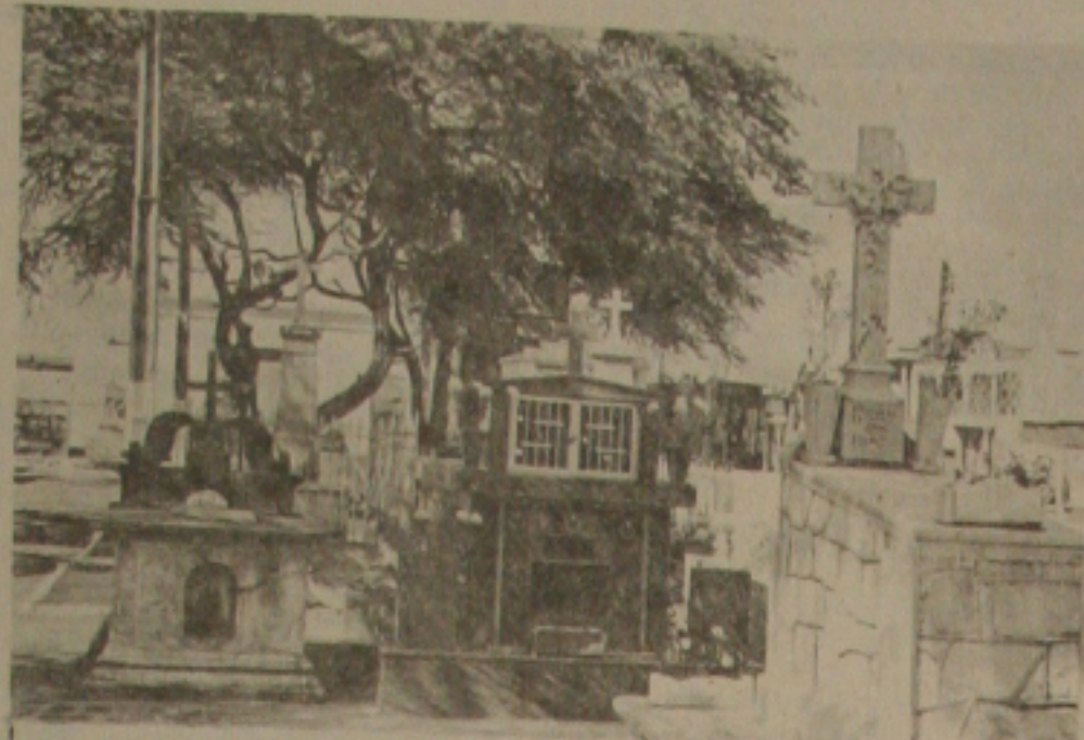
Os bandidos estão violando túmulos no Cemitério São Benedito

Apesar do cemitério está localizado na jurisdição da Terceira Delegacia de Polícia, o Delegado-Adjunto do Terminal Rodoviário disse que a partir de hoje colocará policiais de plantão para investi-