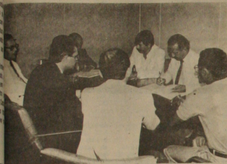
Assinatura de convênios com a CEF

O Governador Antonio Carlos Valadares assinou convênio com a Caixa Econômica Federal no valor de mil OTN's (cerca de Cz$ 9 milhões) para a pavimentação e drenagem do Conjunto Irmã Dulce, em São Barreto, e um outro convênio no valor de 20 mil OTN's (Cz$ 9.600 milhões) para a construção em Crisópolis de 50 unidades habitacionais que serão entregues em 120