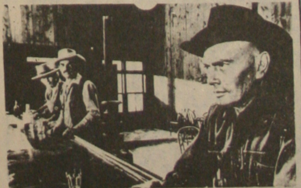
Yul Brynner está em Westworld.

Ficção científica. Dois amigos, Peter Martin (Richard Benjamin) e John Blane (James Brolin), resolvem passar as férias em Delos — o maior centro de entretenimento do mundo. Ali utilizando a técnica da era espacial, cientistas conseguiram recriar a vida de três eras antigas, povoando-as de robôs. Na Europa medieval, os hóspedes são tratados como reis e rainhas, cujos desejos os robôs satisfazem; na Roma Imperial, os robôs re-