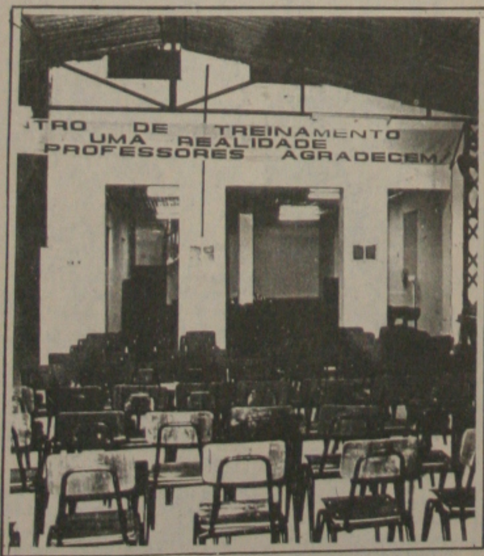
O Centro de Treinamento de Professores da Secretaria de Educação e Cultura, funcionando normalmente com curso de reciclagem. O Centro foi inaugurado recentemente pelo atual Governo do Estado.