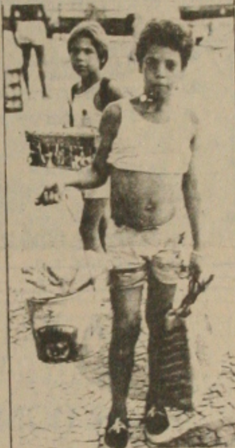
... o futuro a Deus pertence.

Paralelamente, o trabalho familiar aumentou consideravelmente durante o período 1970/80: mais membros das famílias — mulheres adultas e menores — passaram a trabalhar, e os que já trabalhavam passaram a fazê-lo mais intensamente — essa estratégia utilizada pelas famílias brasileiras, em geral, tinha significados distintos, conforme a localização na pirâmide social. Aquelas situadas nos patamares de