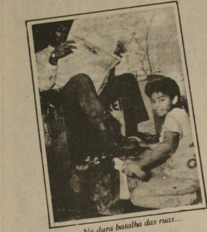
Na dura batalha das ruas...

Ao mesmo tempo, manifesta-se uma significativa concentração de menores empregados nas faixas salariais mais baixas: na região metropolitana de São Paulo, por exemplo, cerca de 88,6% deles receberam, em média, durante o período 1980/85, o correspondente a 0,51 a 2,00 salários-mínimos mensais, e 96,8% do total situavam-se no intervalo de 0,51 e 3,00 salários-mínimos. Por outro lado, o contingente de menores trabalhadores — no qual um pouco mais de 60% são do sexo masculino — apresentavam, de modo