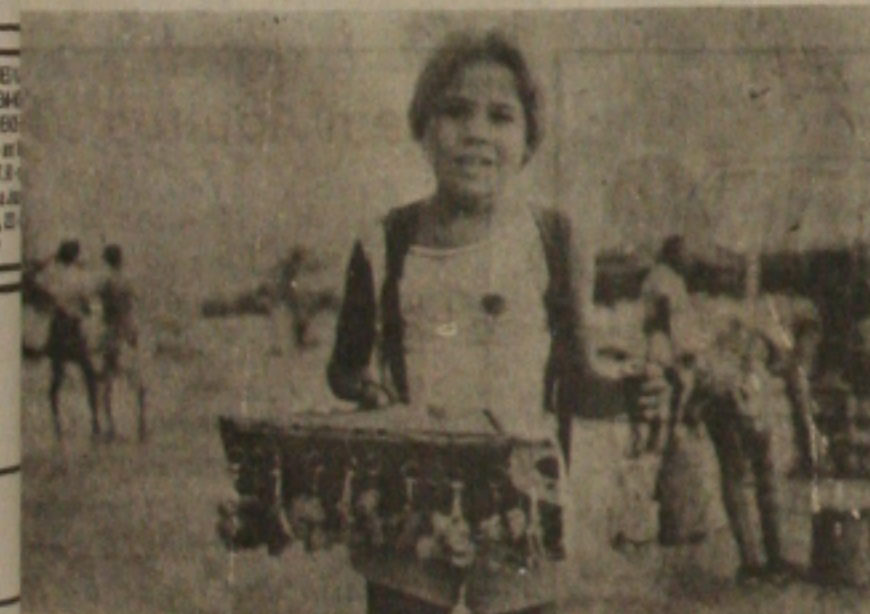
Vale qualquer coisa pela sobrevivência.