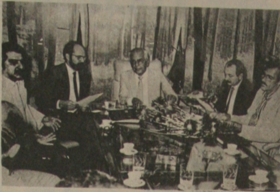
Fragrante da reunião