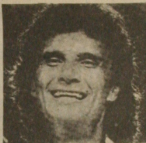
para lançamento ainda em novembro.

Já está programada a nova excursão de Roberto Carlos ao exterior, que percorrerá diversas capitais latinoamericanas e os Estados Unidos. Entre 12 de janeiro e 19 de março, Roberto Carlos fará espetáculos em Lima, Caracas, Guaiquil, Quito, Bogotá, Cali, Medellín, Panamá, San Juan da Costa Rica, México, Los Angeles, San Francisco, Nova Iorque, Chicago, San Juan de Porto Rico e Miami. As gravações do novo Lp de Roberto Carlos devem ficar prontas nos próximos dias