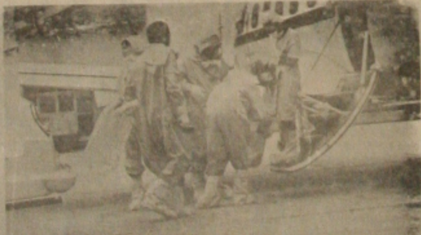
O acidente nuclear de Goiânia, a cada mais triste.

O país sofreu uma de suas maiores perdas: morreu Carlos Drummond de Andrade, nosso maior poeta, após dois dias de morte de sua filha. Outras mortes