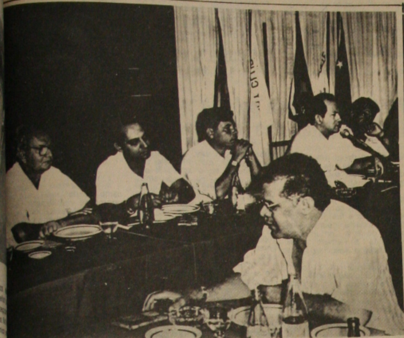
Senador Albano Franco, no almoço com a imprensa, ontem no Hotel Pálace.