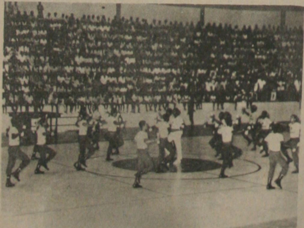
Este é um dos momentos mais bonitos da apresentação do Grupo de Ginástica do 28º BC. Na foto, mostra o Ginásio Au-

gusto Franco completamente lotado aplaudindo de pé o espetáculo, quando da realização do FUTSAL SHOW.