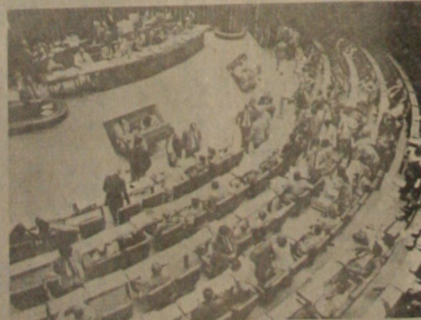
Os constituintes prosseguem em seu trabalho.

marcaram o ano de 87. As de Golbery do Couto e Silva e Marcos Freire estão entre elas. Duas figuras importantes da política nacional, que deixaram registros grandes momentos: Golbery legou surpreendentes revelações e Freire desappareceu em plena carreira política.