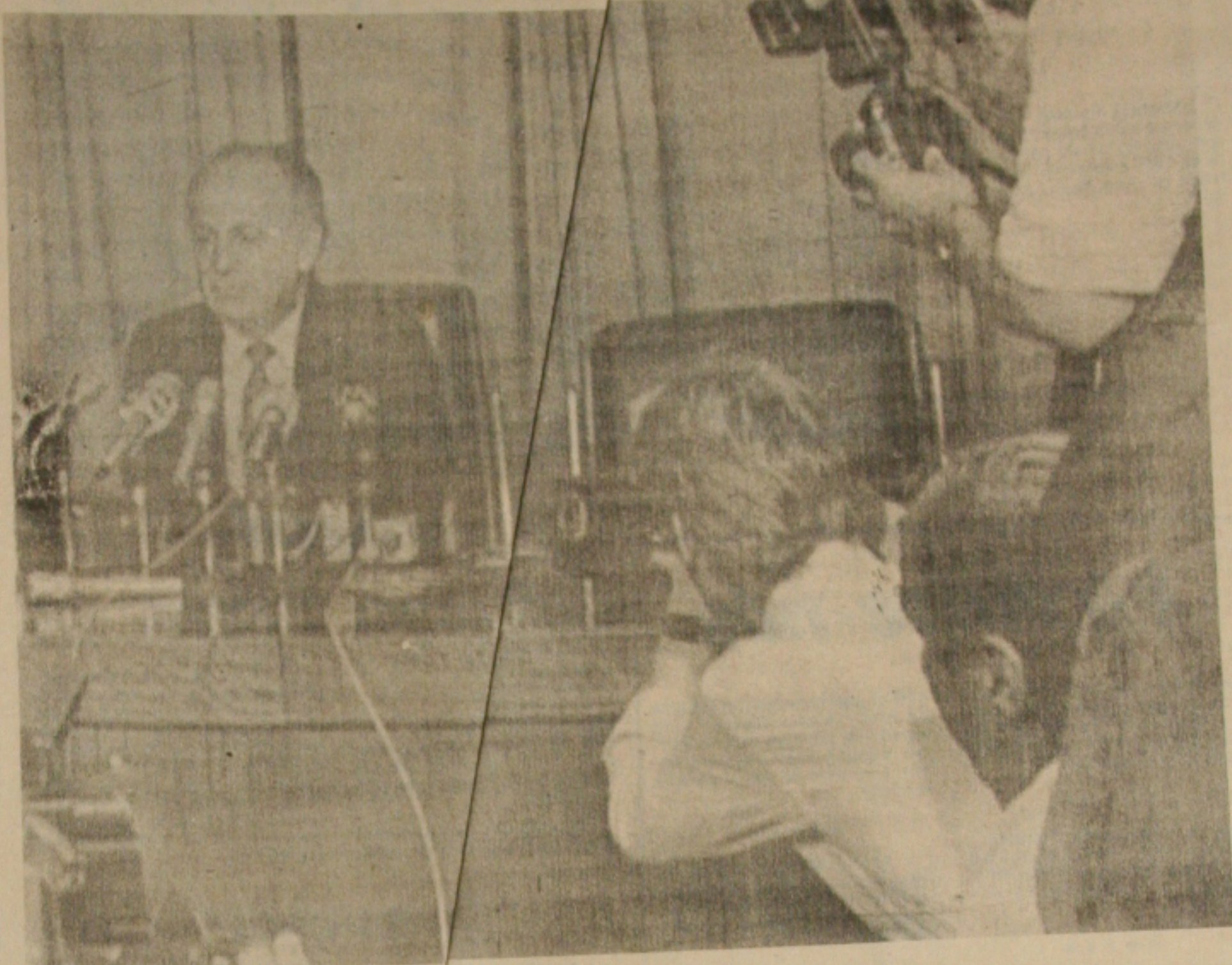
Dia 18 o ex-ministro Bresser Pereira foi demitido.

O resto do mês foi gasto, na área política, em especulações sobre nomes, extinção de Ministérios, criação de outros, informações e desmentidos, boatos e "ministeriáveis" que se sub-