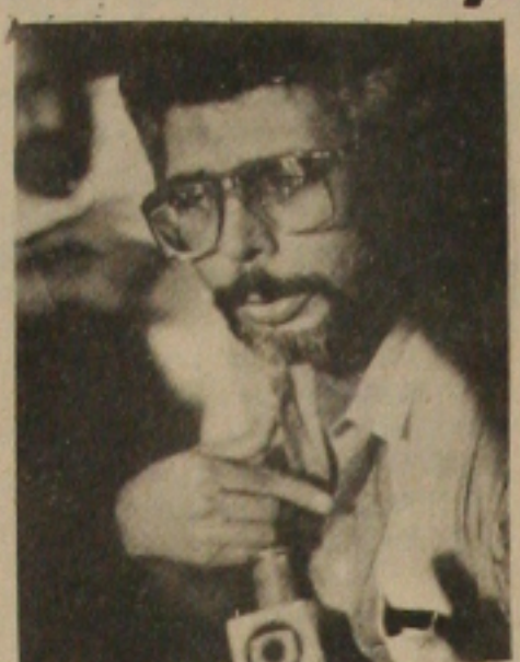
Marcelo Déda disse que Valadares enganou os servidores e vai promover um novo trem da alegria.