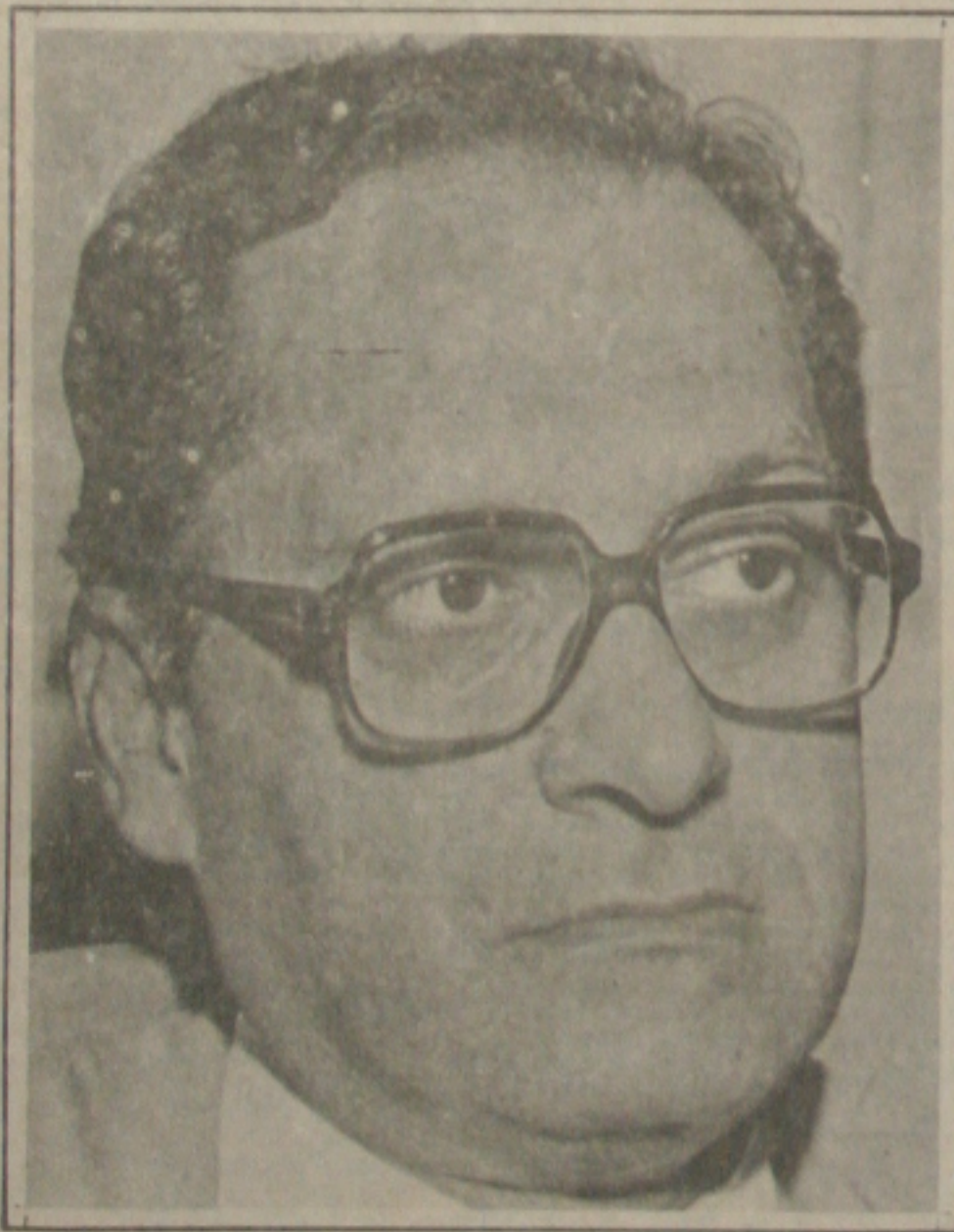
Roberto Magalhães apolara Brizola

RECIFE, (AG) - O ex-governador Roberto Magalhães previu ontem que o presidente do PMDB e da Constituinte, Ulysses Guimarães, será fragorosamente derrotado se disputar a Presidência da República e anunciou que se seu "candidato preferencial", Antonio Ermirio de Moraes, não se dispuser a se candidatar "eu apoiarei o ex-governador Leonel Brizola".