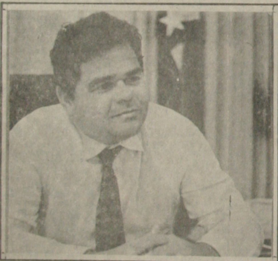
Presidente em exercício do Tribunal de Contas do Estado de Sergipe