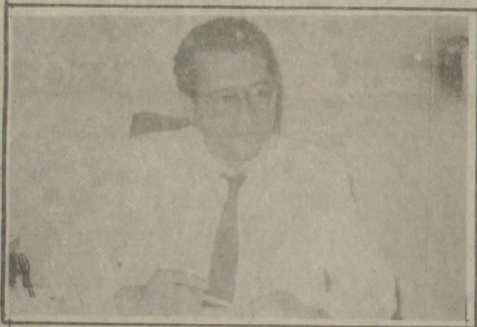
Secretário da Saúde, Edney Freire.

O Secretário da Saúde Edney Freire Caetano assinou ontem em Brasília, o termo aditivo do SUDS — Sistema Único e Descentralizado de Saúde, garantindo o andamento da Reforma Sanitária. Ainda em Brasília o Secretário da Saúde foi recebido em audiência pelos Ministros da Saúde e da Previdência Social, reivindicando a liberação de recursos para o Estado de Sergipe, tanto para a construção de Postos de Saúde, como para assegurar todo o processo de implantação do Novo Modelo Assistencial de Saúde.