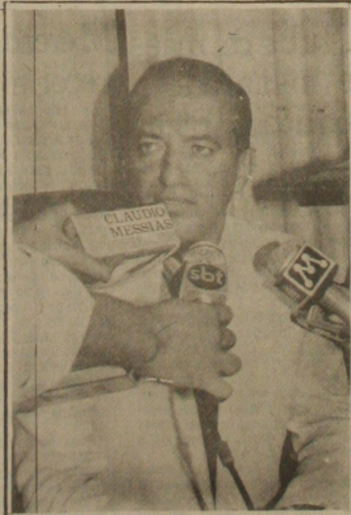
Valadares anuncia aumento para os servidores.

O aumento da pauta do boi em pé, que é o valor básico para tributação do boi destinado ao abate, foi feita pela Secretaria da Fazenda, o que provocou reajuste no preço da carne para o consumidor. (Pág. 3).