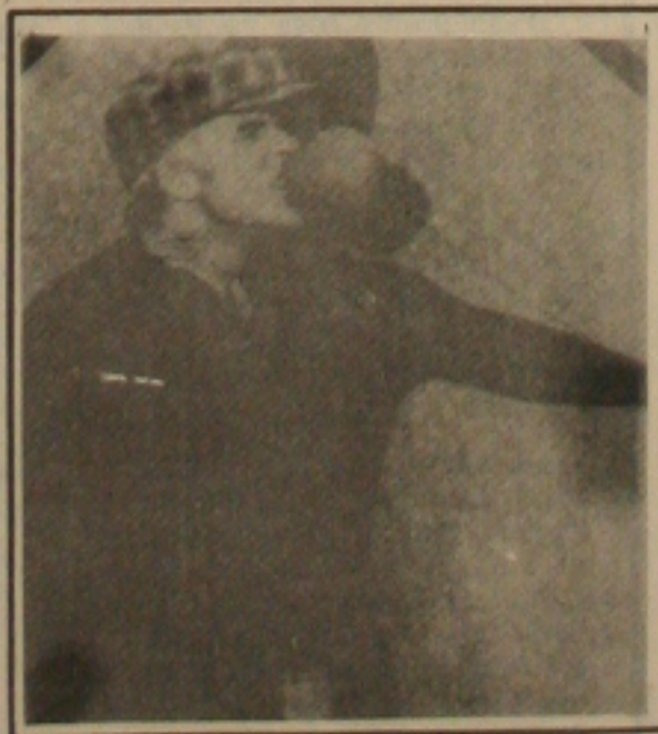
Steve Martin em "O Panaca", de Carl Reiner

Steve Martin não poderia ter tido pior estréia no cinema. Ele é o idiota rural que só aos 35 anos descobre ter sido adotado pelo casal de negros que o criou, apesar de ele ser branco.