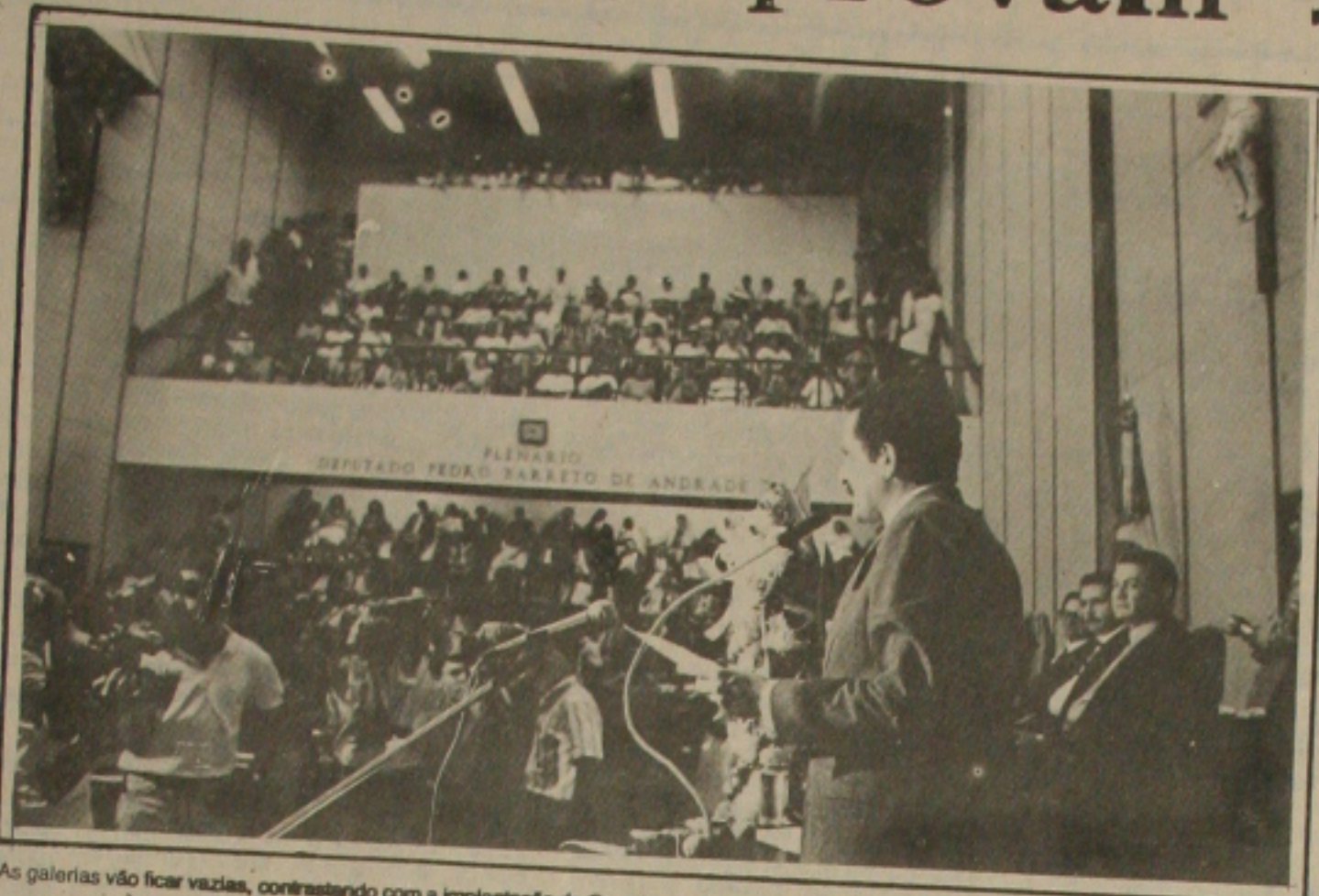
As galerias vão ficar vazias, contrastando com a implantação da Constituinte, que seria do povo...