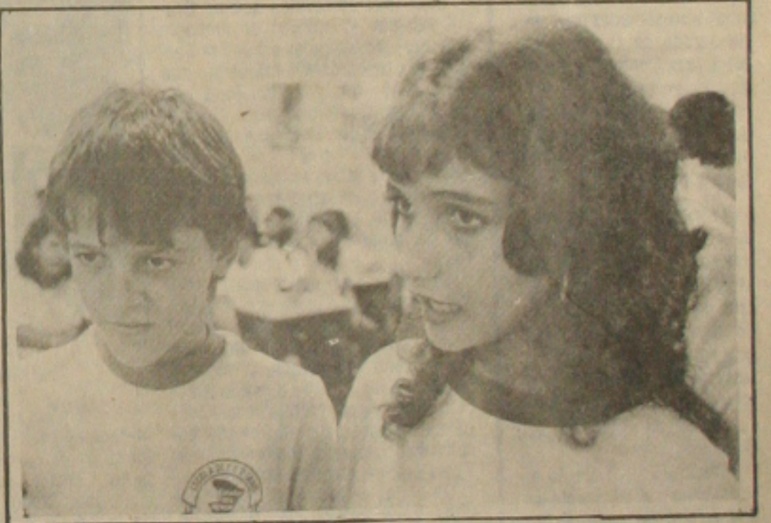
Estudantes do Tobias Barreto ganharam medalha de prata em Prêmio Internacional.