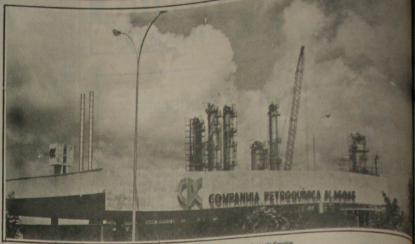
Fábrica da CPC começa a funcionar e Alagoas e se prepara para se instalar também no Pólo Cloroquímico de Sergipe.

"O programa de estabilização da economia deve ser a prioridade política da esquerda brasileira. Se é que ela deseja preservar o processo democrático e conquistar a presidência em 1989".