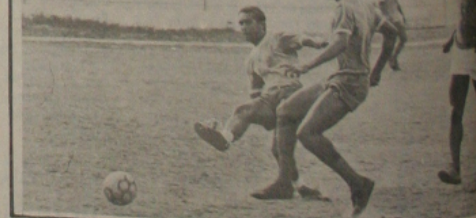
Jogadores do Sergipe elogiaram cancelamento do jogo com o Atlético. Mesmo assim treinaram.

Mesmo na decisão que resolveu tudo o dia de ontem, Rubens não permitiu que os treinos no Sergipe. Os atletas começaram se movimentando nos dois expedientes. Pela manhã um treino físico no João Silva e Oliveira e à tarde, um treino com bola. Entretanto o treino os atletas ficaram na expectativa do cancelamento da partida, que se não for confirmado a noite pela FSF, a reunião no Sergipe todos os jogadores estão satisfeitos de bola e torcem que as férias sejam o mais rápido possível.