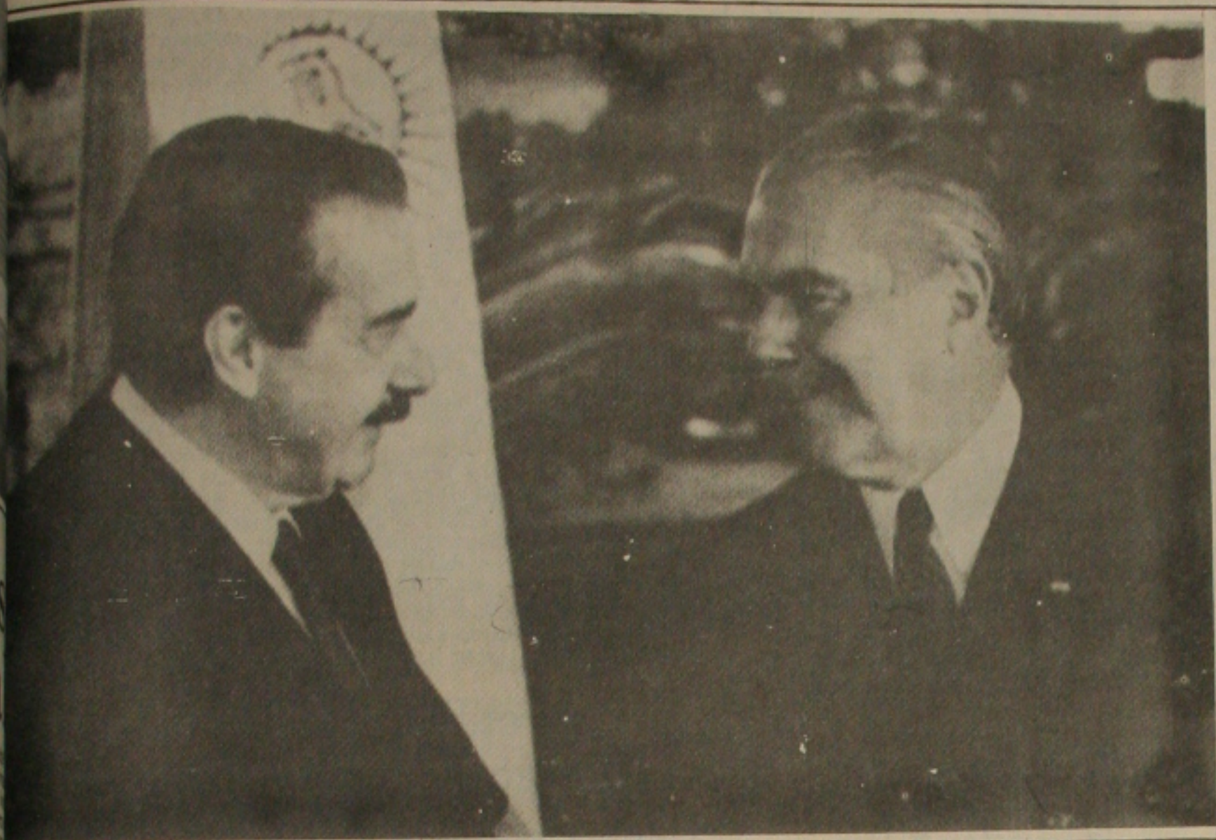
Em Buenos Aires - Casa Rosada: os presidentes Raul Alfonsín e José Sarney, se mostram confiantes quanto a efetivação do mercado comum latino-americano.