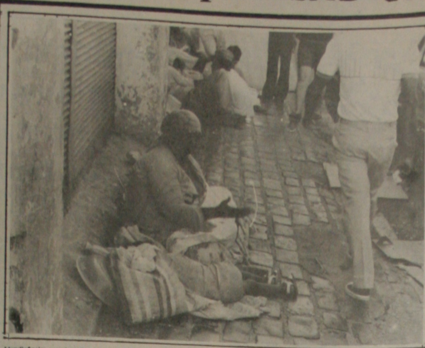
Mendicância: crescimento no período do Natal.

A outra exposição "O Nagô de Billina", é resultado de uma pesquisa feita em Laranjeiras entre os anos de 1970-1980. Aborda uma forma de religião trazida por escravos africanos, em sua atual vivência numa pequena cidade da zona açucareira de Sergipe.