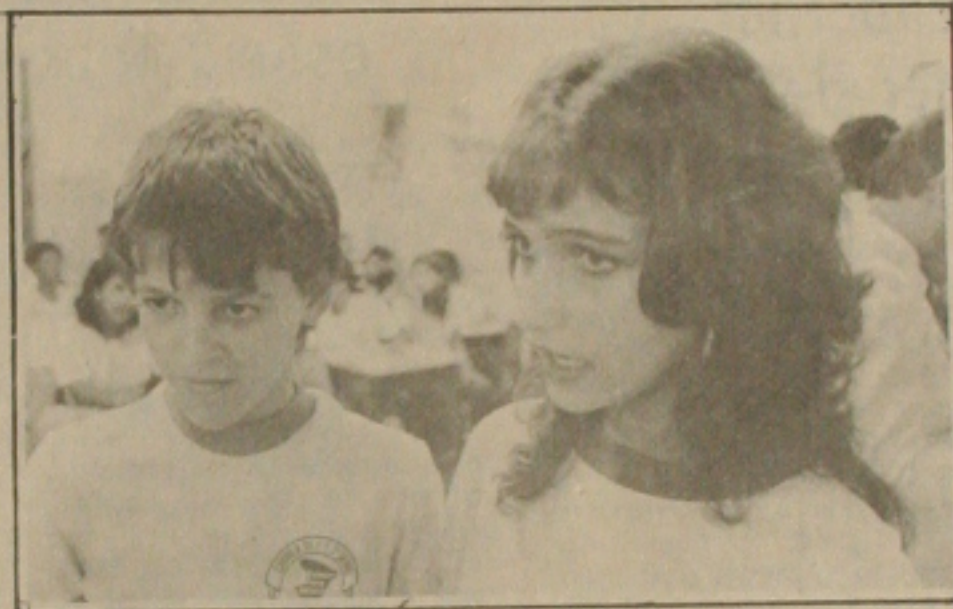
Estudantes do Tobias Barreto ganharam medalha de prata em Prêmio Internacional.