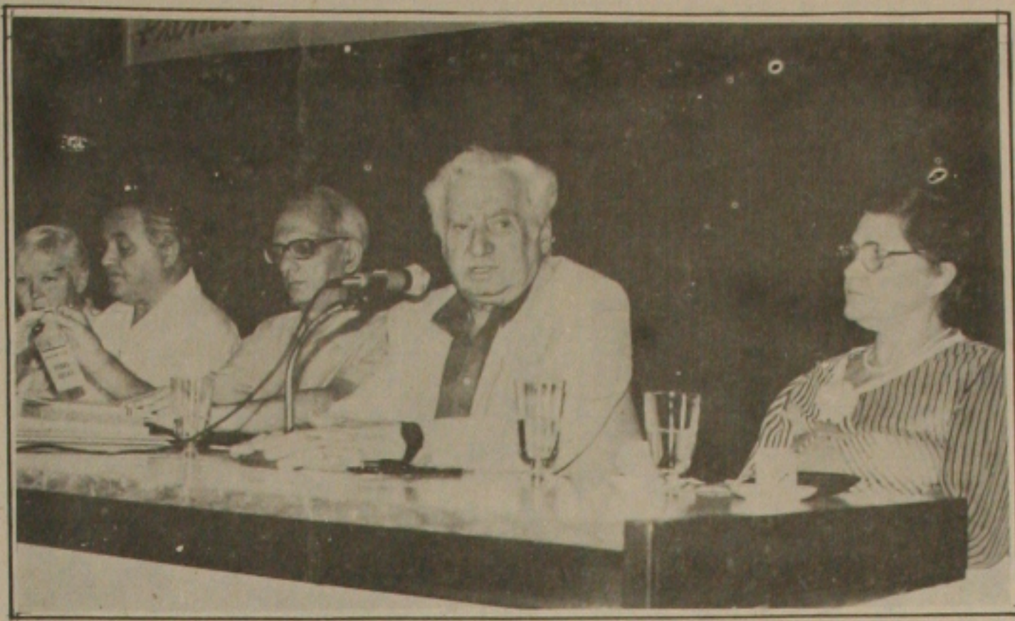
Aberto seminário sobre Vidas Secas