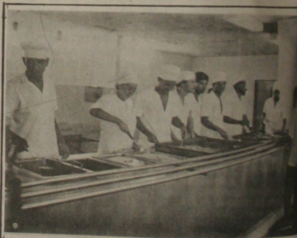
Estudantes trabalham no restaurante da UFS