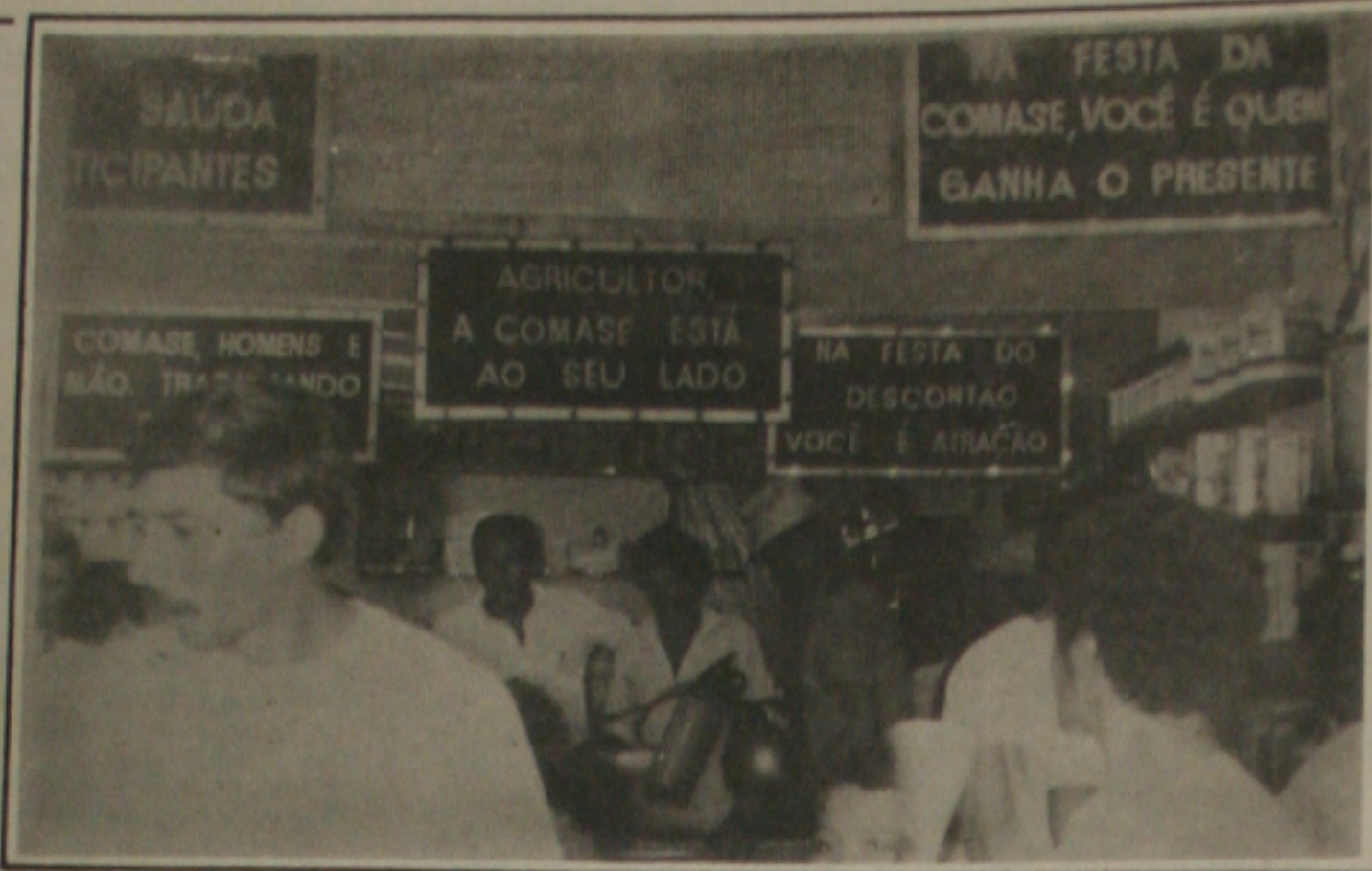
Comase suspende feiras volantes