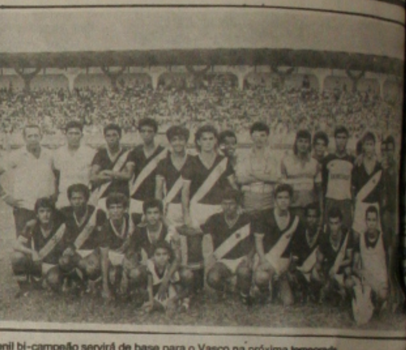
Juvenil bi-campeão servirá de base para o Vasco na próxima temporada.