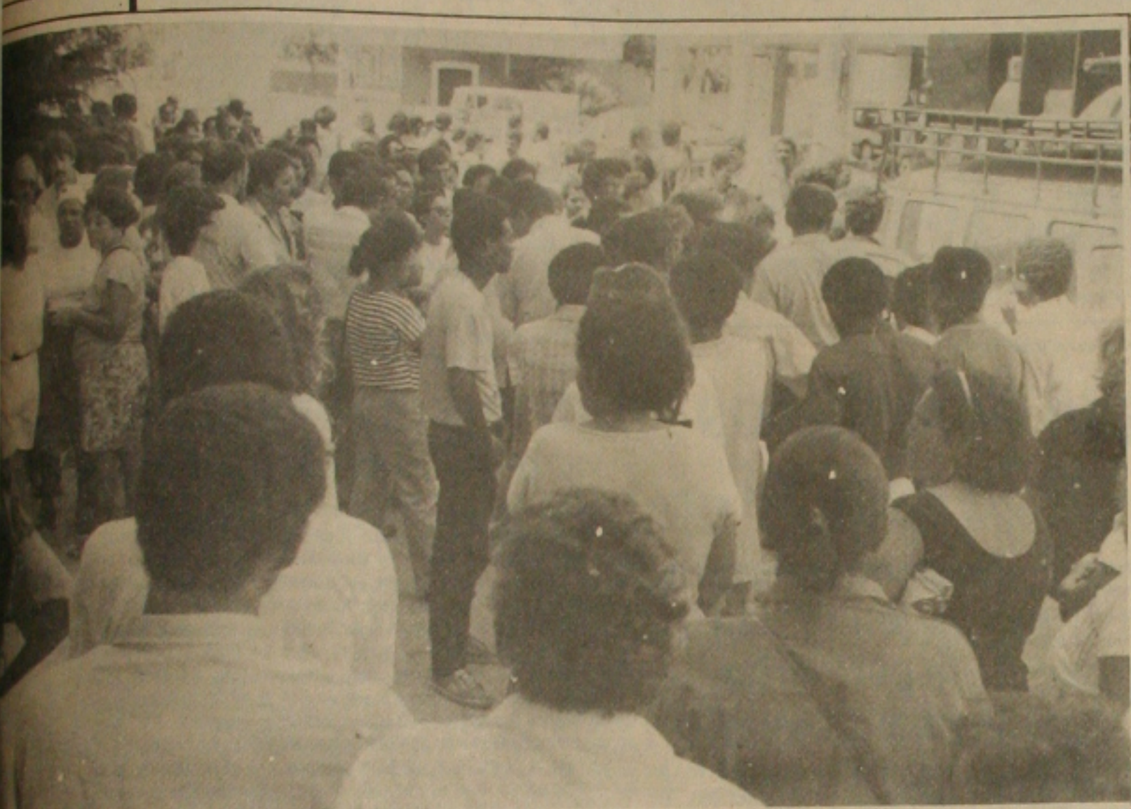
Concentrados em frente ao prédio da Secretaria da Administração, os servidores públicos aguardaram o final das negociações.

Na primeira entrevista concedida à imprensa, após a votação do primeiro turno da eleição presidencial, o candidato Fernando Collor de Mello, anunciou ontem em Brasília que pretende participar de todos os debates que for marcado com o segundo colocado na fase passada da eleição. Ele justificou que não participou dos debates anteriores porque tinha certeza que seriam todos os candidatos contra ele. "Agora, vou debater apenas com um concorrente e dessa forma aceito, pois foi a que cheguei a propor que se realizasse no primeiro turno", lembrou.