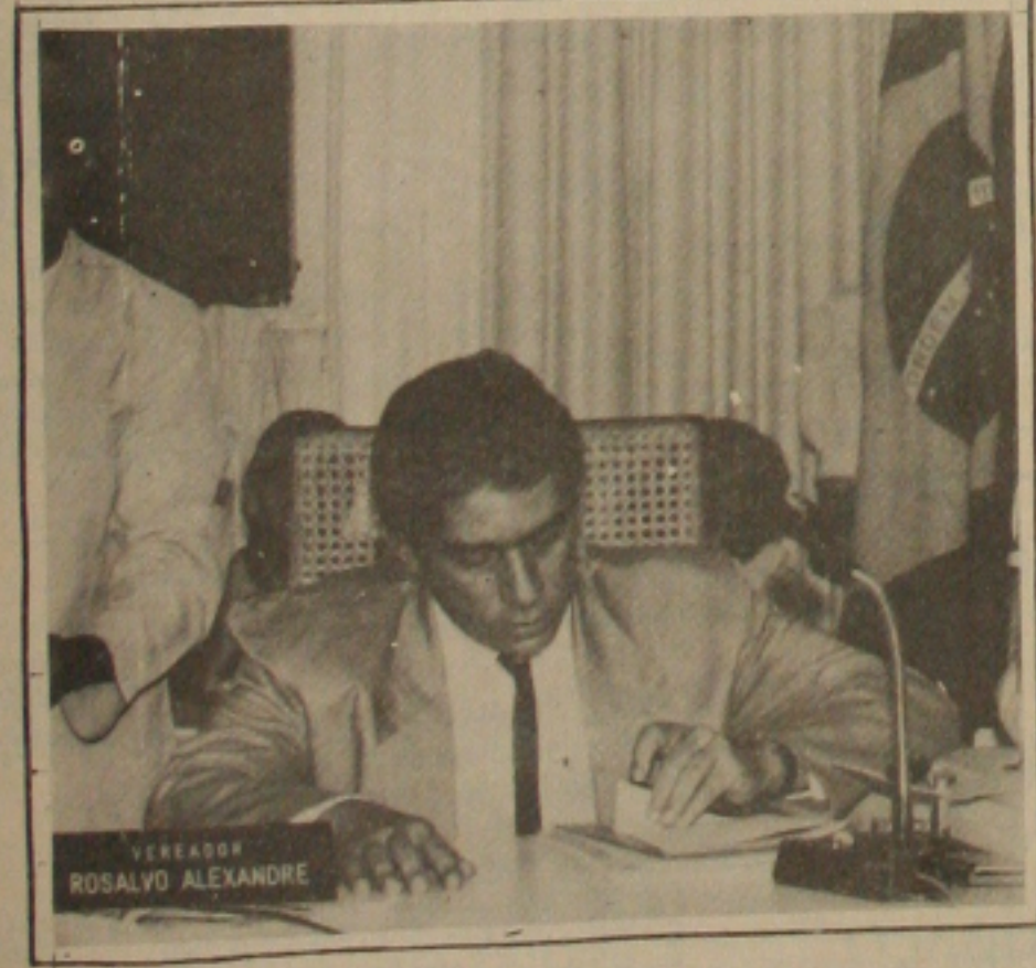
Rosalvo disse que peemedebistas ficarão com Brizola ou Lula.

—é até uma questão de segurança nacional. O político não terá respaldo popular, se não apoiar o socialismo. O resultado das urnas, se analisado friamente, está demonstrando que temos que ficar com o socialismo - acrescentou Carlos Santana.