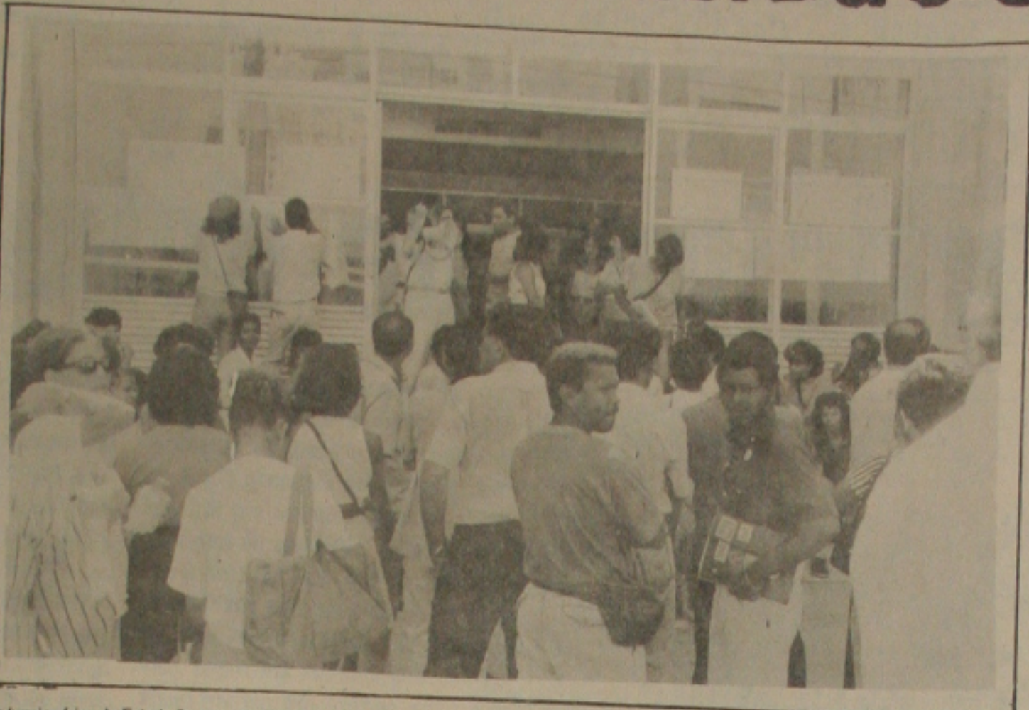
Os funcionários do Estado fizeram manifestação em frente a Secretaria de Estado da Administração

O resultado do concurso será conhecido no dia quatro de dezembro, quando se fará abertura da exposição dos trabalhos concorrentes e a entrega dos prêmios na Galeria de Artes Alvaro Santos.