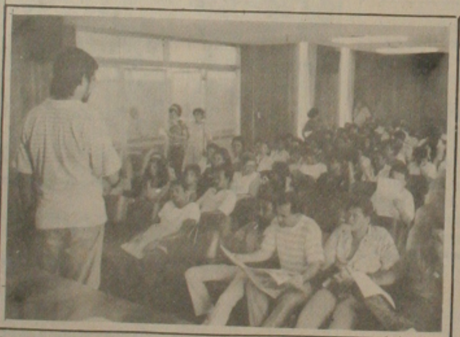
Os previdenciários realizaram ontem, uma assembleia para avaliação do movimento paralisado em Sergipe