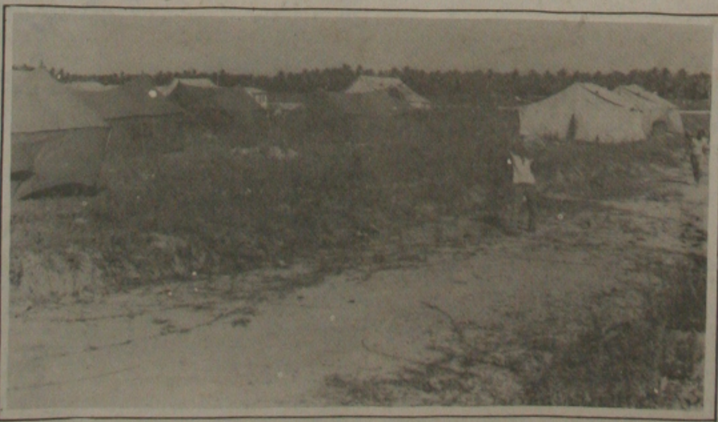
Abandonadas, famílias denunciam a triste situação que estão vivendo na Terra Dura.

Os sem-tetos estão ameaçando acampar em frente ao Palácio Olímpio Campos se não conseguirem as casas prometidas. Eles admitem que somente deixarão à praça Fausto Cardoso no dia em que obtiverem as chaves das casas prometidas pelas autoridades competentes, por ser essa a única forma de pressionar o governador do Estado a concedê-las.