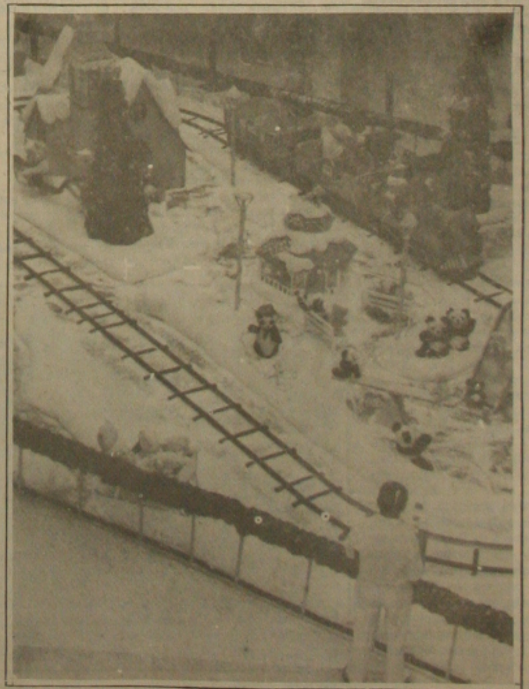
A decoração do Natal no Shopping tem atraído muita gente e aumentado as vendas nas lojas.