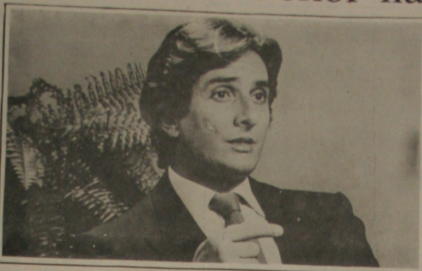
Fernando Collor de Mello mantém a dianteira nas pesquisas de opinião pública...