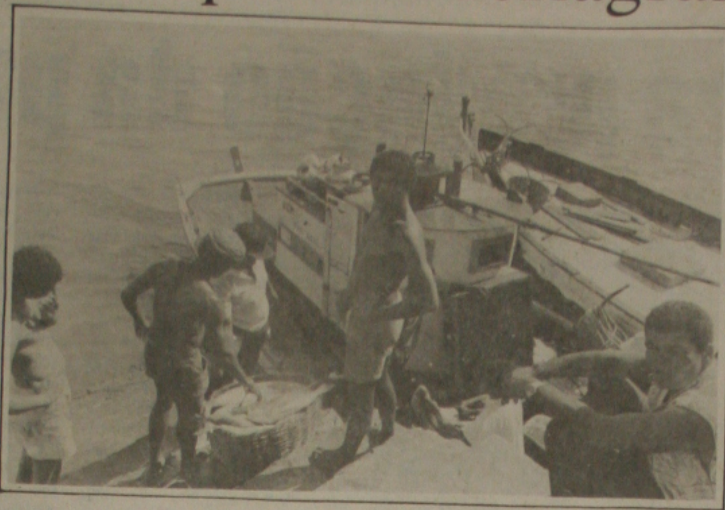
Insatisfeitos com os armadores, os pescadores podem decidir pela greve no próximo dia 18, durante reunião na sede da entidade.