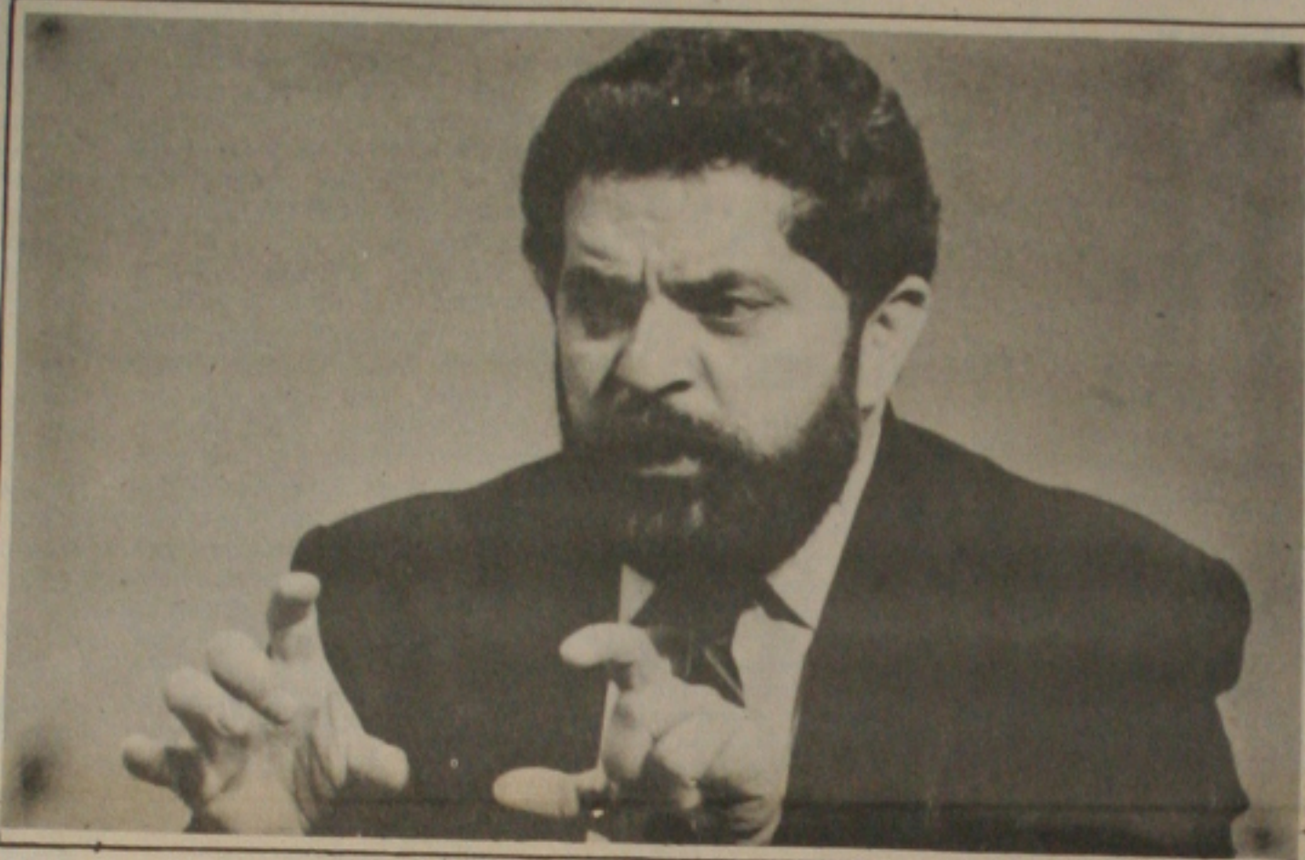
Mas Luís Inácio Lula da Silva permanece com os dez pontos de diferença em todos os itens.