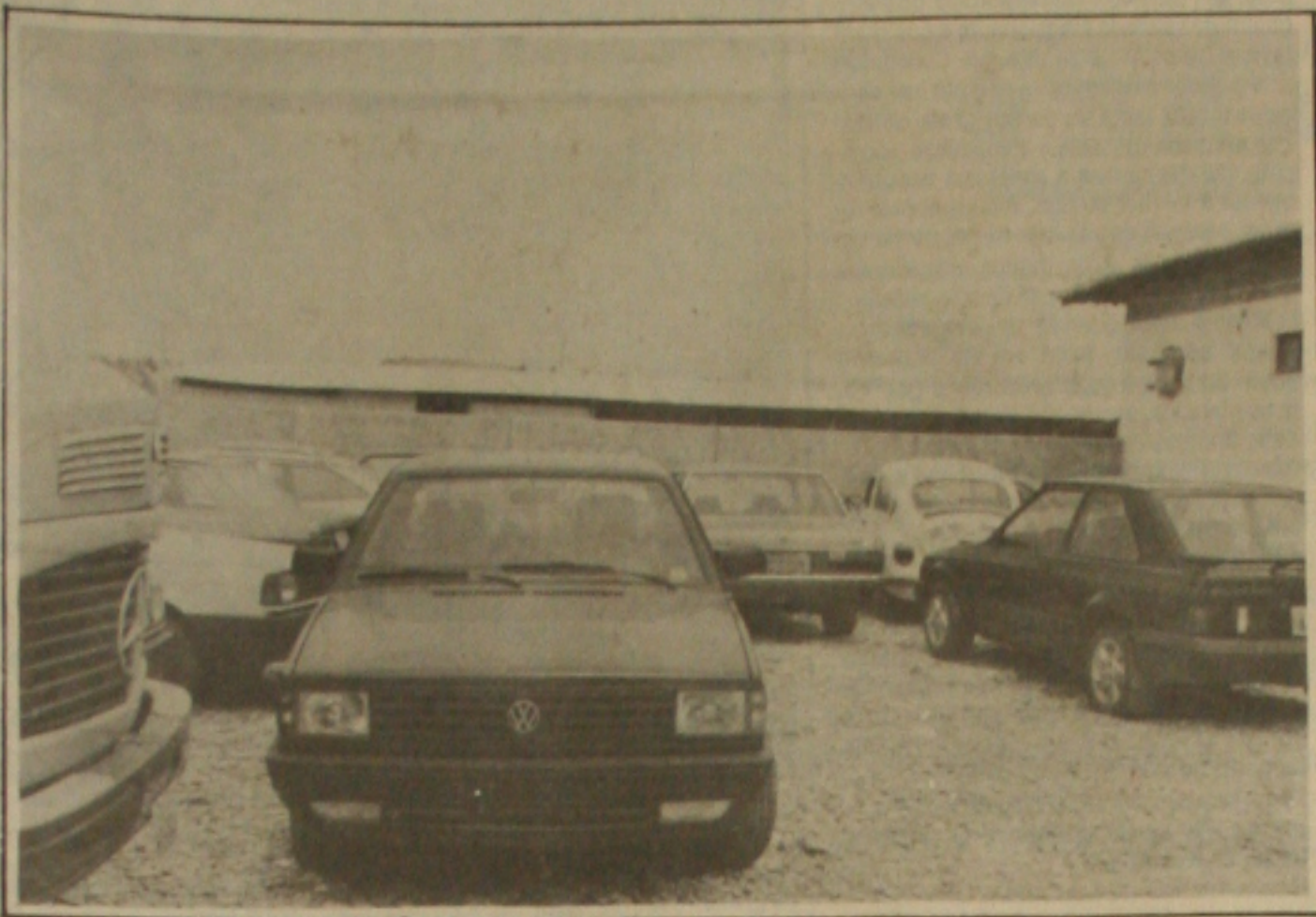
Veículos de várias marcas estão apreendidos no pátio da Delegacia de Polícia Interestadual de Sergipe.