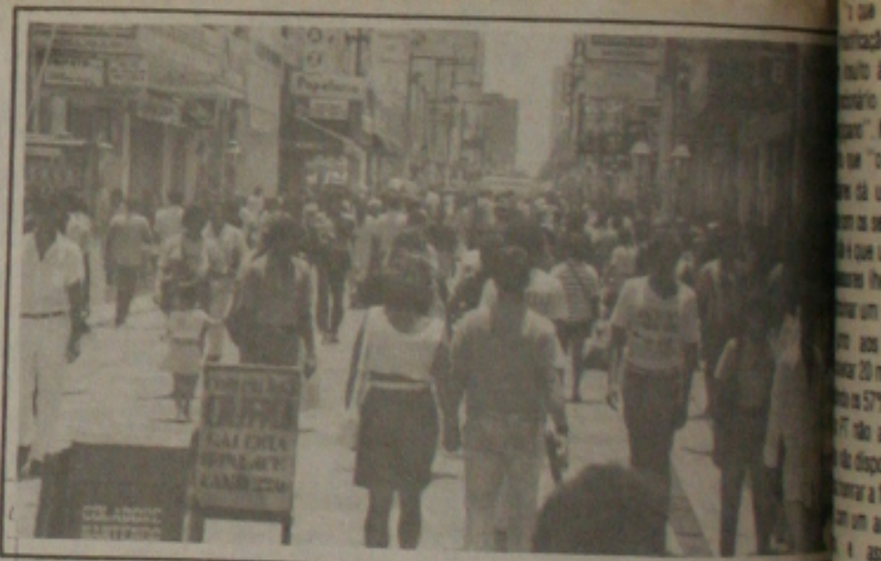
O movimento no centro comercial já demonstra o sucesso das vendas neste final de ano.

Quem estiver interessado em participar do I Encontro Sergipano de Advogados Trabalhistas deve comparecer a sede da Associação Sergipana de Advogados Trabalhistas, na Rua da Rio Branco, 186 - 8º andar - 814, no Edifício da Prefeitura de Teixeira. O encontro será realizado das 8h às 18h, com uma sessão solene e, logo após, haverá um coquetel.