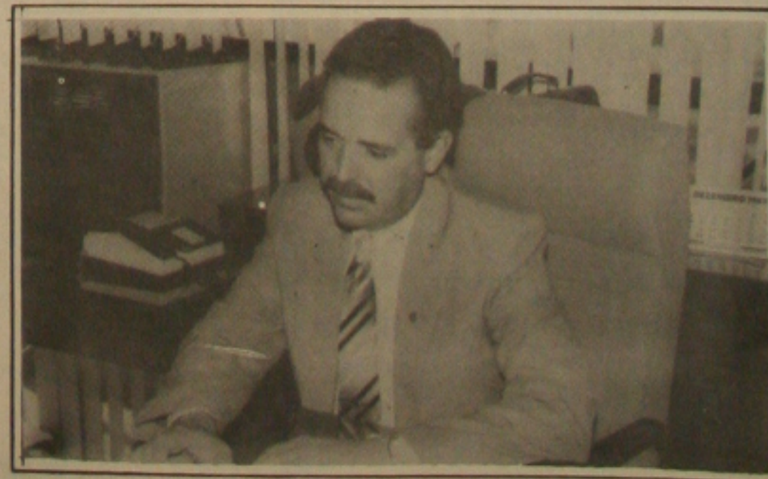
Superintendente da Caixa Econômica Federal explica as normas estabelecidas pelo Governo Sarney.

Finalizando, o superintendente disse que o PIS pode ser retirado obedecendo o calendário que já foi divulgado pela CEF e que as contribuições deixarão de ser recolhidas ao fundo do Programa de Integração Social para serem recolhidas ao Tesouro Nacional sobre a forma de tributo federal.