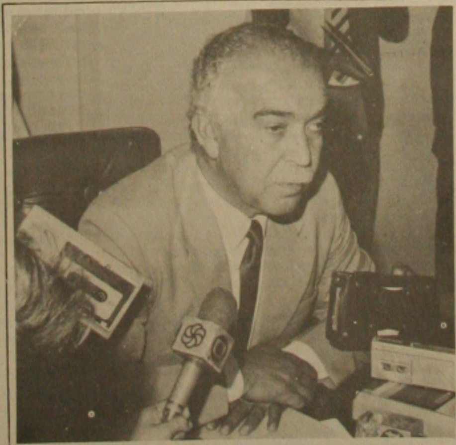
Paixão convocou reunião do secretariado para a segunda-feira.

Em cada fração do bilhete foram acrescentadas três dezenas, no canto direito. Com elas, o apostador concorre a uma premiação extra: NCZ$ 300 mil quando essas três dezenas corresponderem aos finais dos três primeiros prêmios da Loteria Federal.