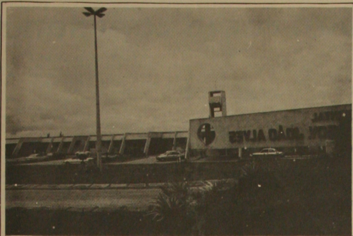
O Hospital João Alves Filho, agora, apenas oficializou a sua incapacidade de atender o público.

Abertura do congresso às 9:00 horas do dia 25 em um Centro de Interesse Comunitário Ministro Hugo Branco, localizado no Distrito Industrial. Estarão presentes 2 mil delegados de todo o País, já inscritos no encontro, autoridades sergipanas, sindicalistas dos Países da América Latina que são convidados especiais e o secretário geral da Confederação Nacional dos Profissionais de Educação com sede em Zurique.