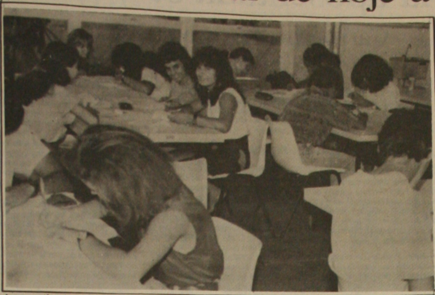
A procura está sendo grande pelo vestibular da Universidade Federal de Sergipe.

De acordo com o juiz José Rivaldo Santos, o programa oferece assistência médica, odontológica, educacional e psicológica, além de oferecer cursos de alfabetização para o futuro quem sabe trabalhar em alguma atividade de cunho profissional. Além disso, o programa oferece assistência médica, odontológica, educacional e psicológica, além de oferecer cursos de alfabetização para o futuro quem sabe trabalhar em alguma atividade de cunho profissional.