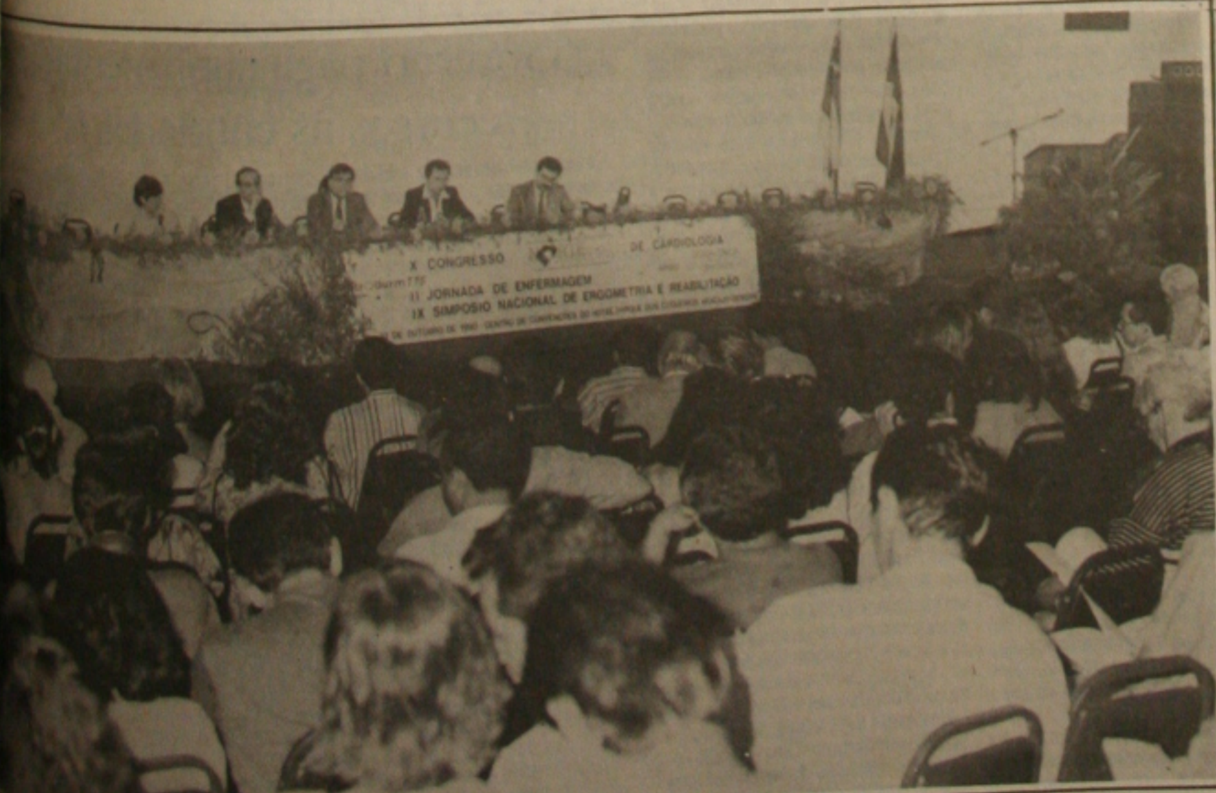
Congresso reúne profissionais de vários Estados.