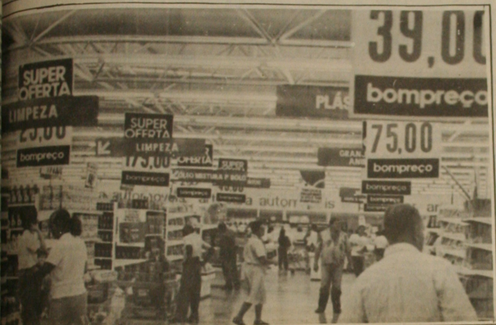
Feira nos supermercados atinge consumidores.

Está cada vez mais difícil fazer compras nos supermercados. A população reclama dos elevados preços e da diferença de preços entre um estabelecimento e outro que geralmente variam entre 1 e 5 por cento. De acordo com os consumidores nos últimos tempos os preços de produtos alimentícios que antes eram controlados pela Sunab estão sendo majorados indiscriminadamente em função da liberação feita pelo Governo Federal e isto tem contribuído sensivelmente para reduzir o poder de compra dos assalariados.