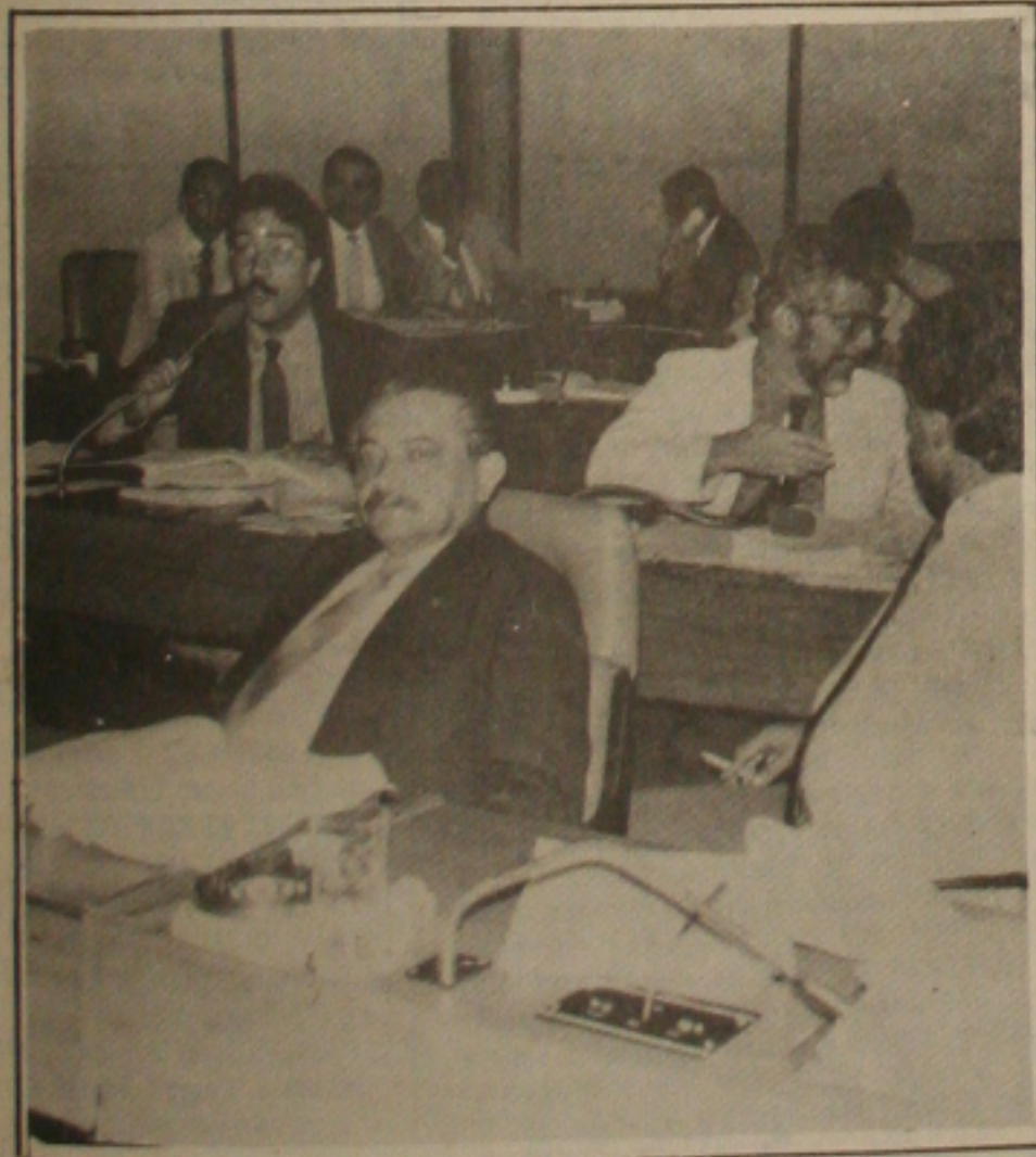
Aumento para servidor, serviu a sero polémica nessa legislatura.

Machado disse que o Projeto tramita em regime de urgência e, por isso, irá demorar menos. O aumento será aprovado mesmo que surjam algumas pequenas alterações e, com isso, o servidor pode ficar tranquilo, porque está com o reajuste garantido. Disse ainda que o Projeto irá passar pelas Comissões de Economia e Finanças e de Serviço Civil.