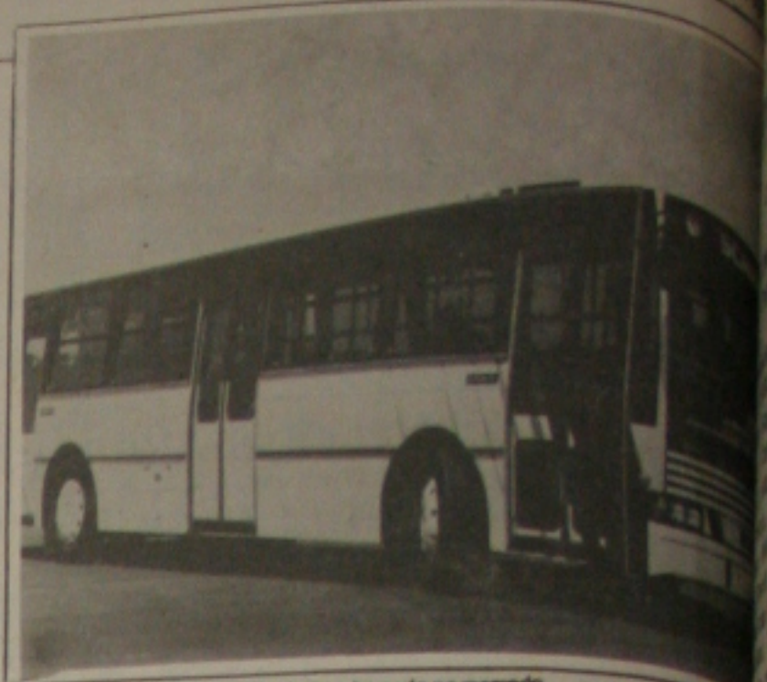
Este é o mais novo modelo de ônibus lançado no mercado.