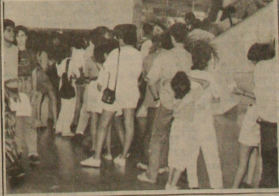
A procura pelas inscrições ao concurso vestibular da UFS tem superado as expectativas.