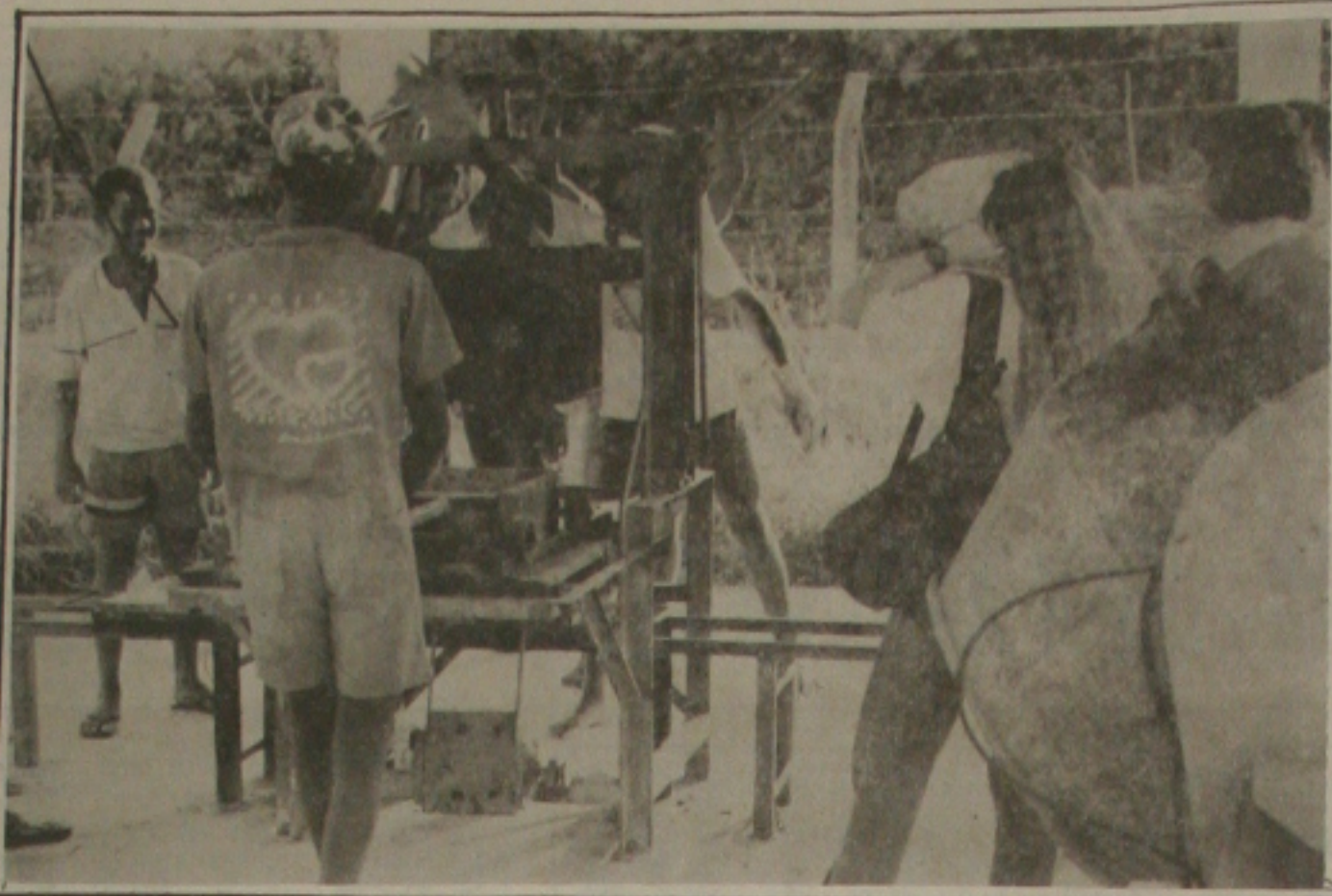
Crianças aprendem a fazer blocos de cimento através do Projeto Esperança

O deputado garantiu que as concessões desrespeitam a Constituição baiana, "que, no seu artigo 24, exige a concorrência pública para a criação de novas linhas de ônibus intermunicipais e até mesmo a autorização da Assembléia Legislativa do Estado".