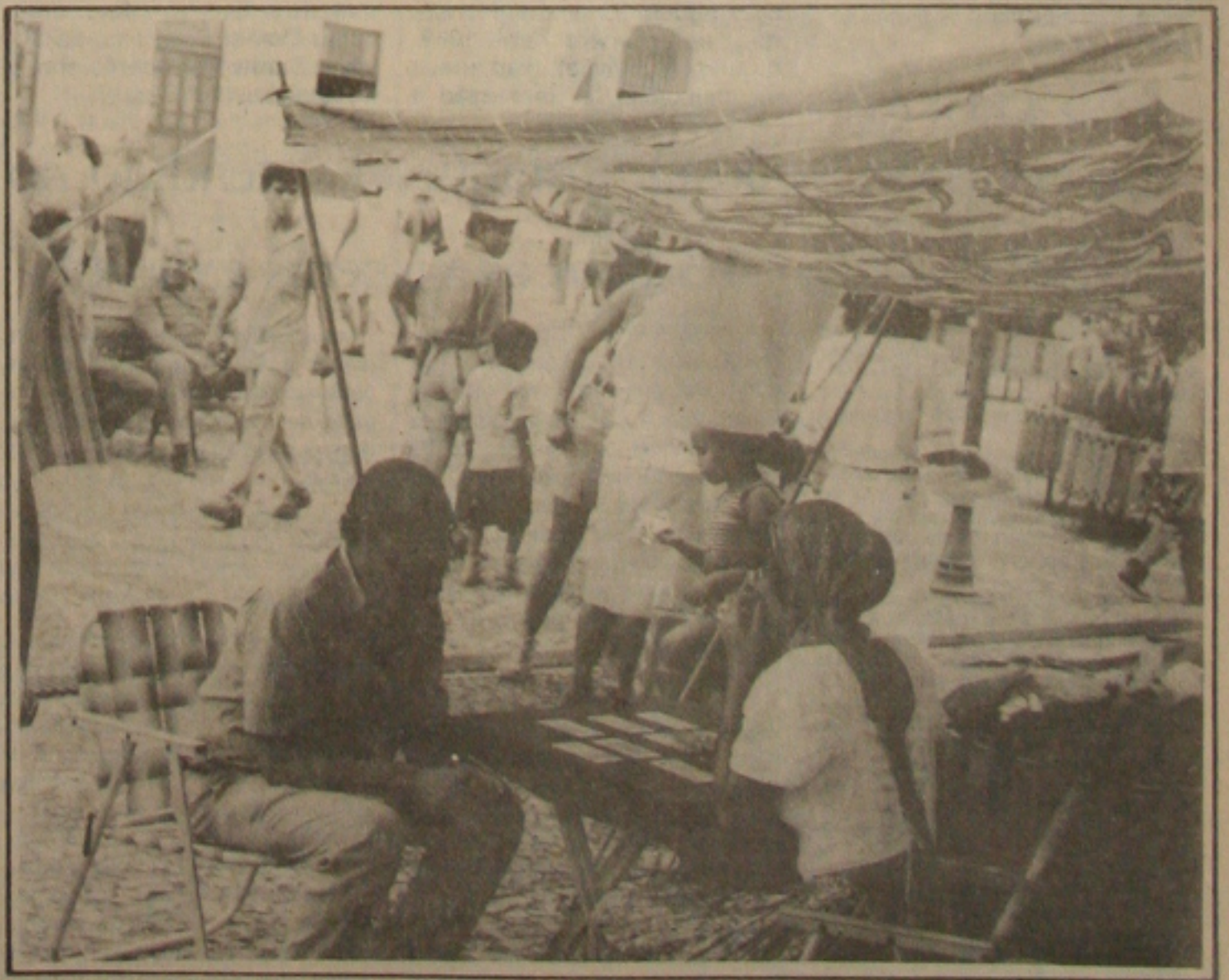
Os professores da UFS fizeram ontem um bazar para arrecadar verbas para o fundo de greve