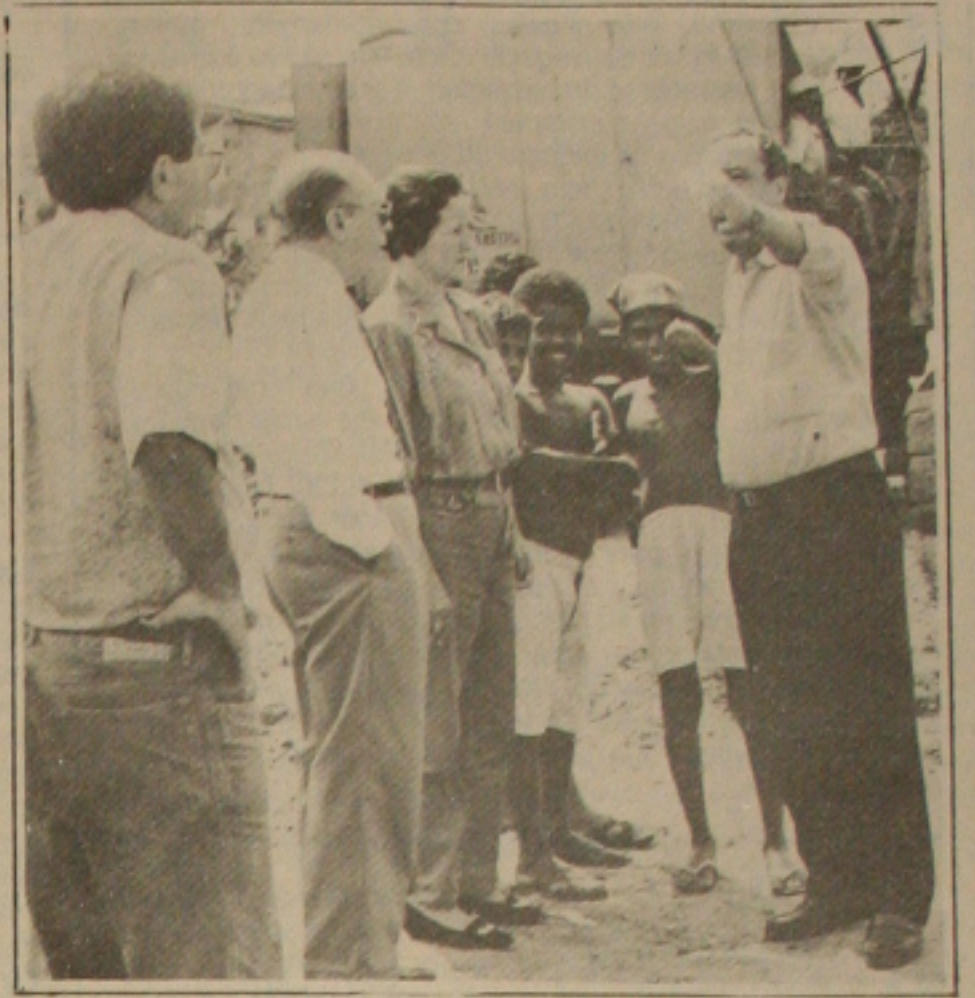
O governador João Alves explica como pretende acabar com as favelas.

Realizando que está impressionado com o crescimento de favelas e invasões na capital sergipana nos últimos 4 anos, o governador João Alves Filho assegurou ontem que durante sua administração não vai permitir o surgimento de novas invasões e prometeu que acabará com a miséria e com o sofrimento da população carente, "já que com a pobreza não podemos acabar". Foi ontem durante visita às principais favelas da cidade, onde o governo do Estado através da Secretaria de Ação Social iniciou no mês passado o programa de destavelamento, que consiste na urbanização das áreas das favelas para construção de casas em regime de mutirão, pelos próprios favelados, com material fornecido pelo poder público. (Página 3B)