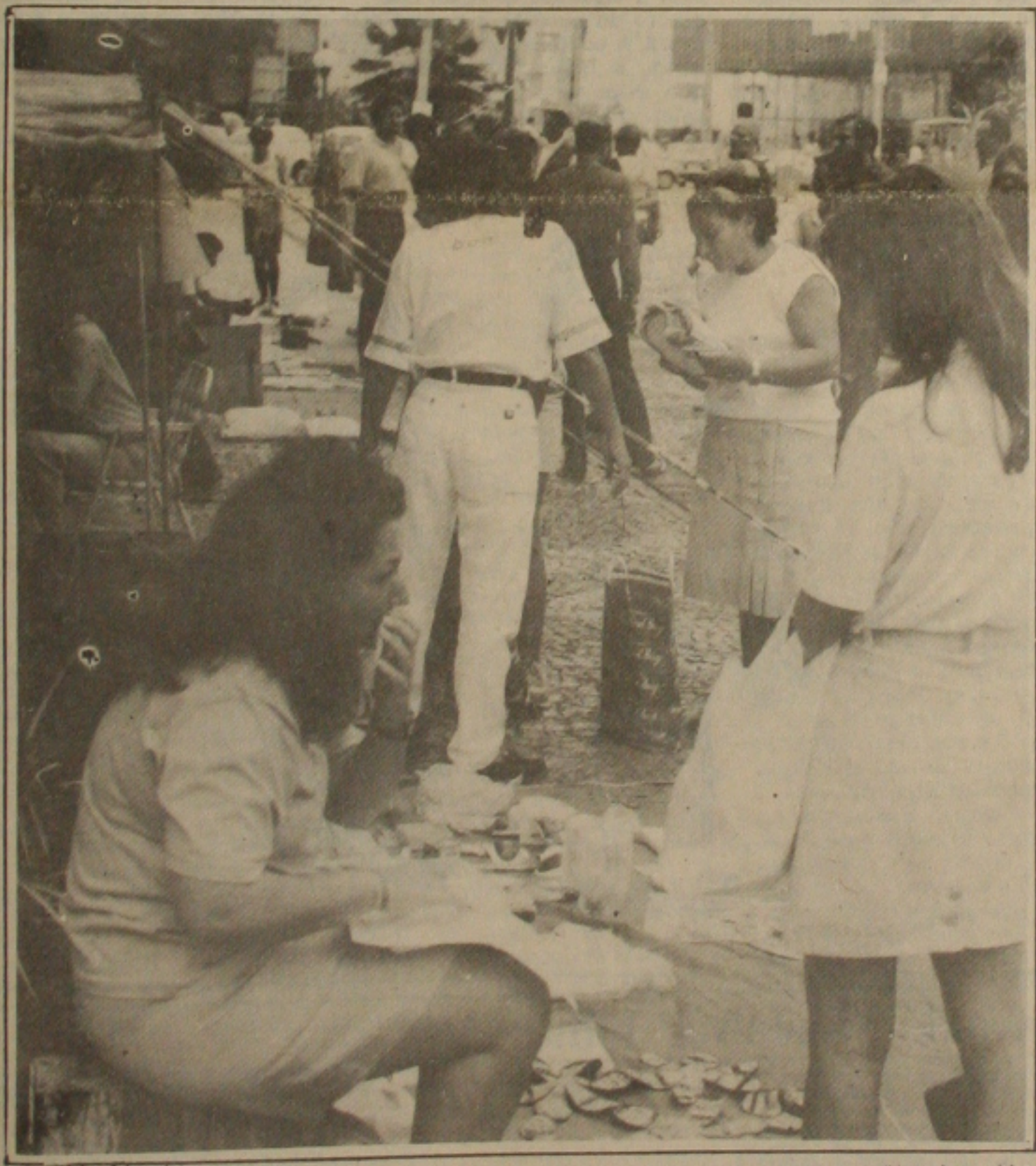
A população participou do Bazar da Greve comprando os produtos vendidos pelos grevistas.

A difícil situação da Universidade Federal de Sergipe foi ontem no Bazar da Greve montado na Praça Fausto Cardoso, pelos funcionários administrativos e professores que estão em greve desde o mês passado. Para os organizadores da manifestação atingiu os objetivos propostos, foi arrecadado dinheiro para custear a presença de um representante sergipano no comando nacional da greve e denunciada à população das instituições de ensino superior do País, que vem se reunindo no Governador Collor.