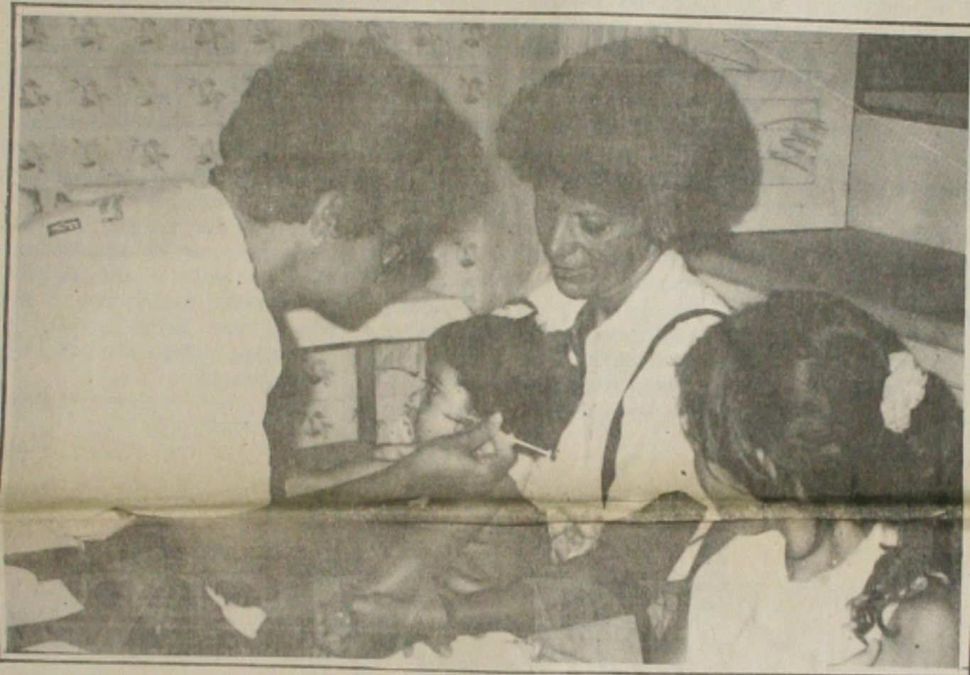
A campanha de vacinação acontecerá apenas duas vezes este ano