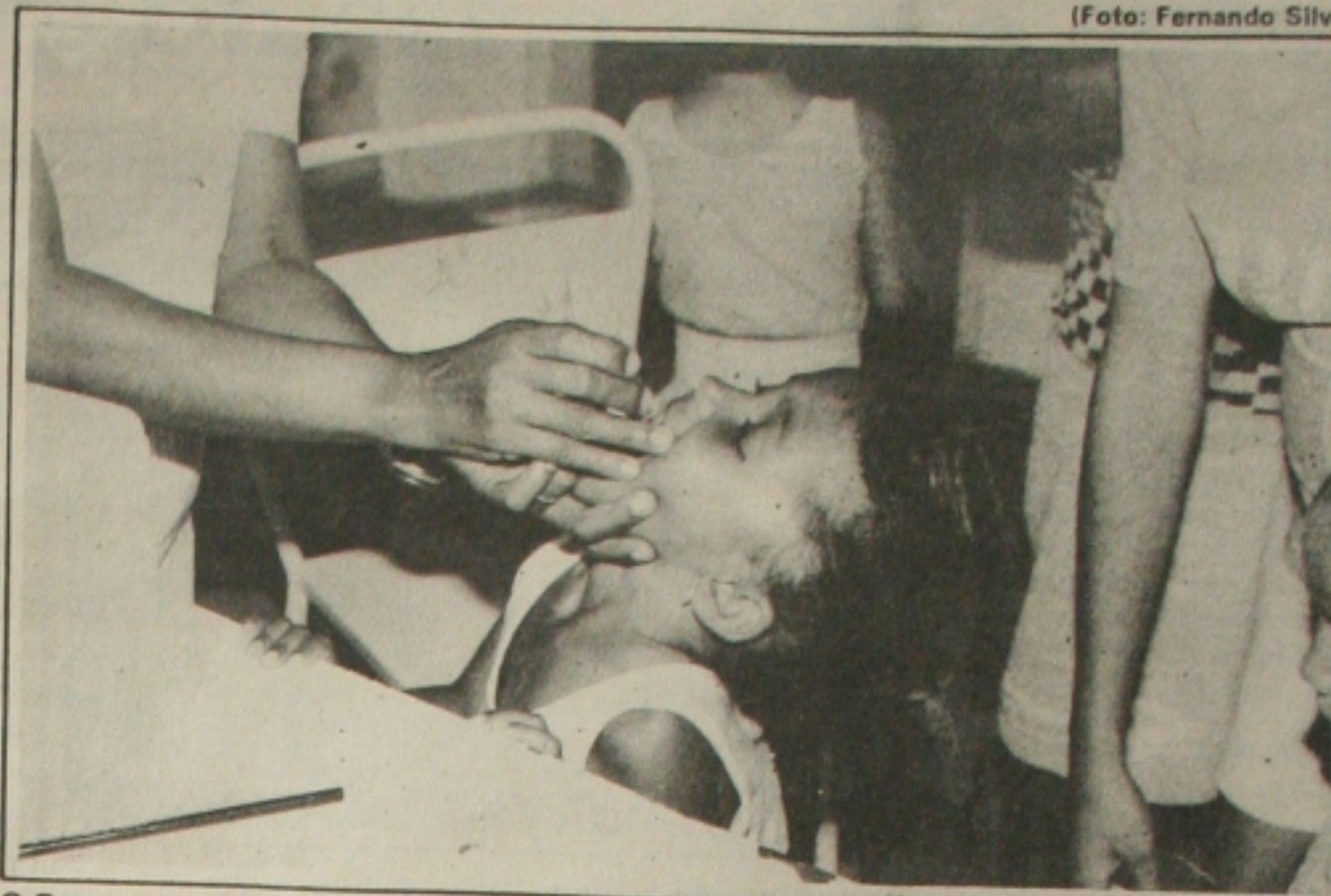
O Governo pretende este ano realizar duas campanhas de vacinação contra a poliomielite.