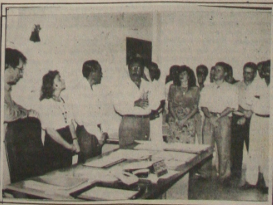
A solenidade de posse do diretor financeiro da Emurb

Ao finalizar o seu discurso, o prefeito disse que a criação da diretoria Financeira não se trata de cabide de emprego e sim de uma adequação das necessidades da própria empresa de Urbanização.