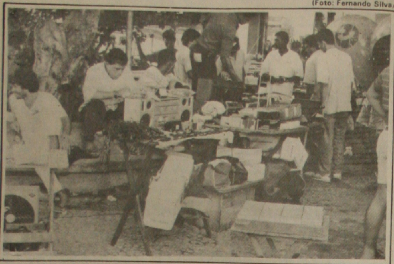
As vendas de produtos importados caíram pela metade no ano passado.