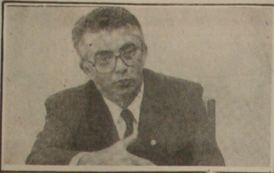
Correa: saldo bancário alto

A barragem de Oiticica é feita pela Norberto Odebrecht e o Açude Santa Cruz de Apodí por um consórcio formado pela OAS/Eit. O TCU encontrou indícios de fraudes na licitação desta obra.