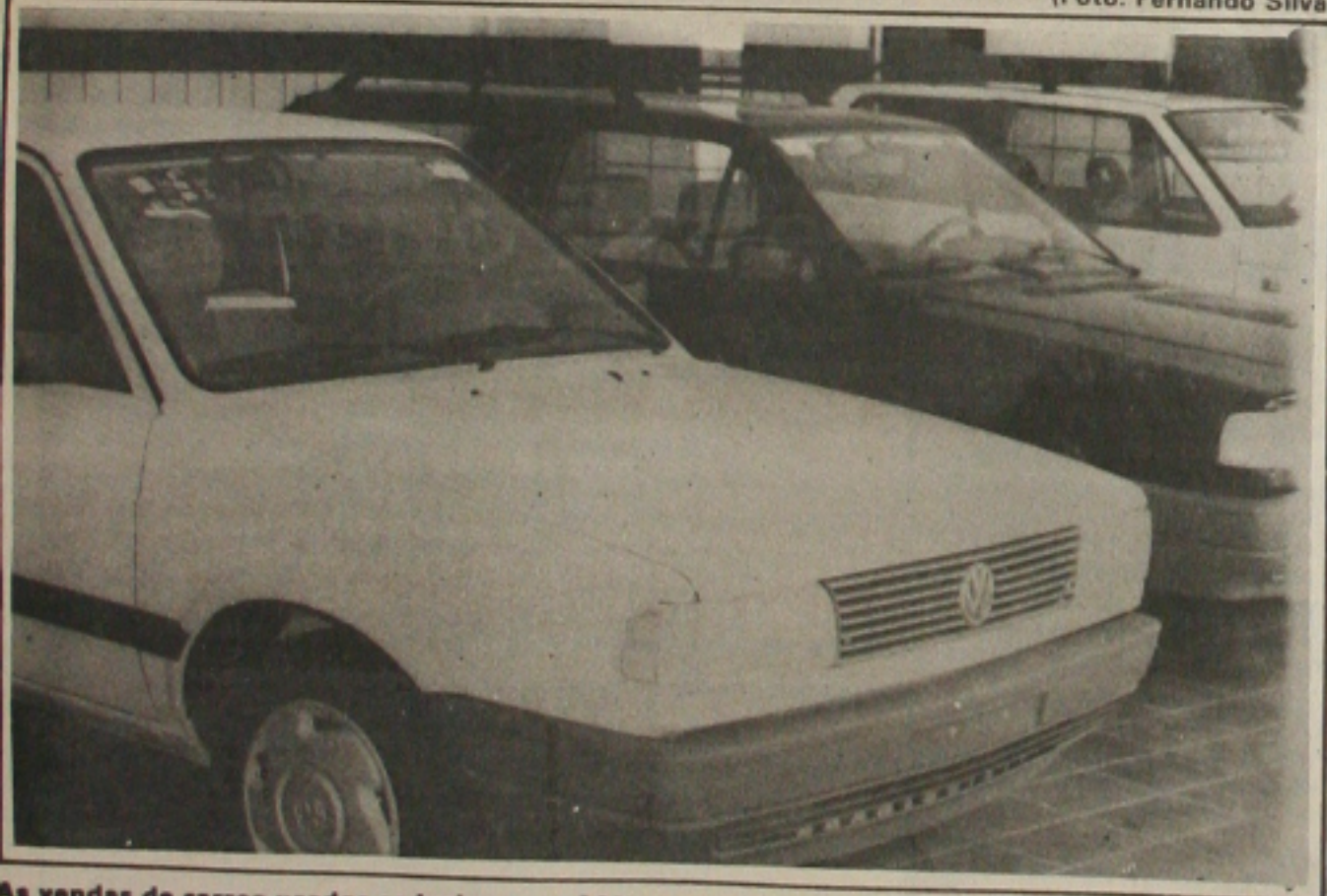
As vendas de carros usados reduziram em 20% devido o último reajuste