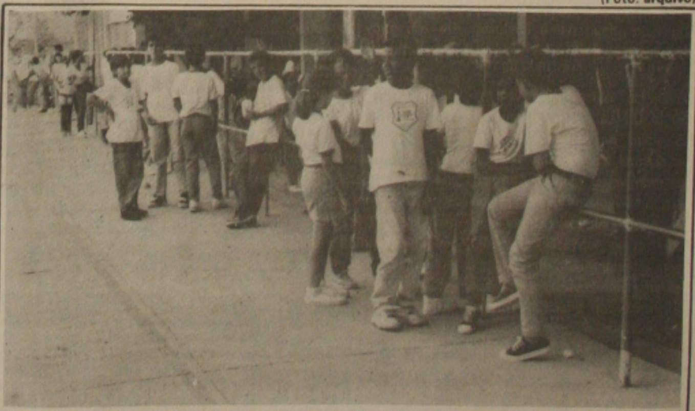
O início de matrículas no Estado levará muita gente às escolas