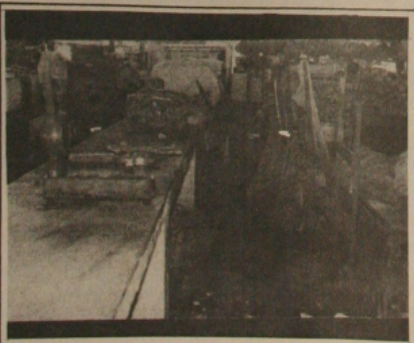
A sujeira no mercado e falta de higiene põem em risco a saúde do consumidor

TURISMO - Os turistas argentinos estão curtindo as delícias de Sergipe desde da última sexta-feira. O turismo está crescendo em nosso Estado.