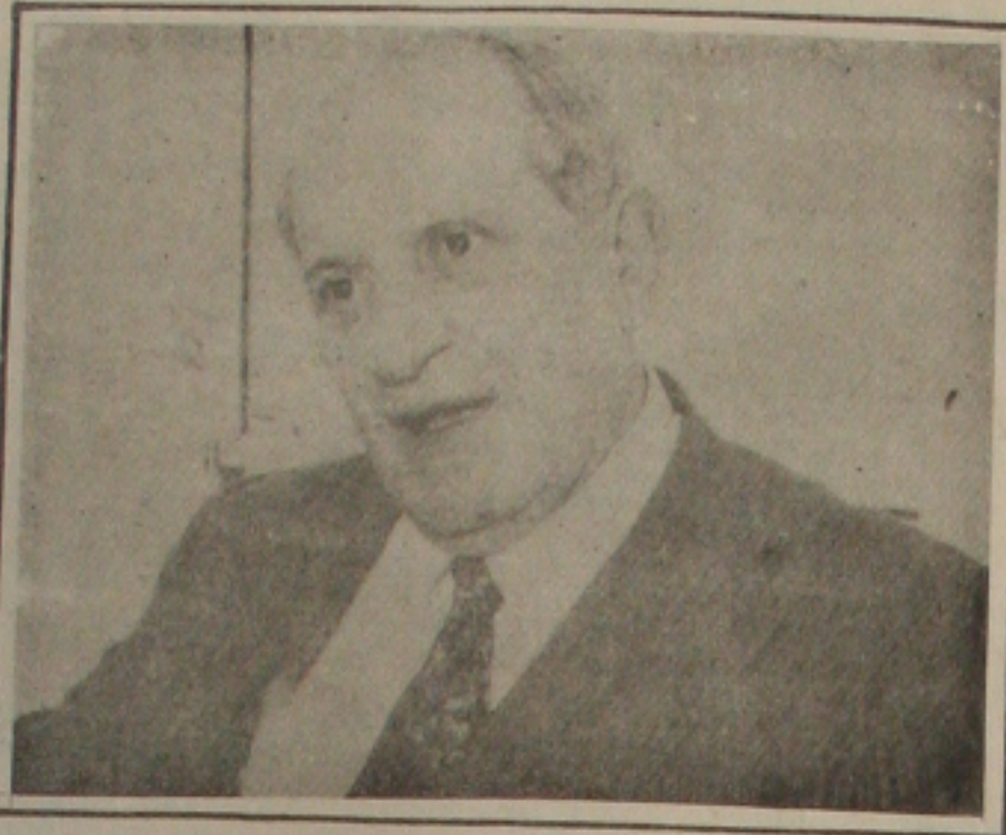
O ministro Maurício Corrêa fala em fujimorização

- Nós, militares, somos democratas. Brigamos pela democracia, por mais inconvenien-