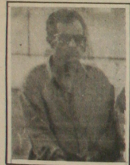
Manilton pode ir para o Gararu

OS MELHORES DE 93 SERÃO HOMENAGeadOS NO JOGO ENTRE O CAMPEÃO MOSQUEIRENSE X MELHORES DE 93, A SER MARCADO PELA ASSOCIAÇÃO SERGIPANA DE CLUBES DE BAIRROS.