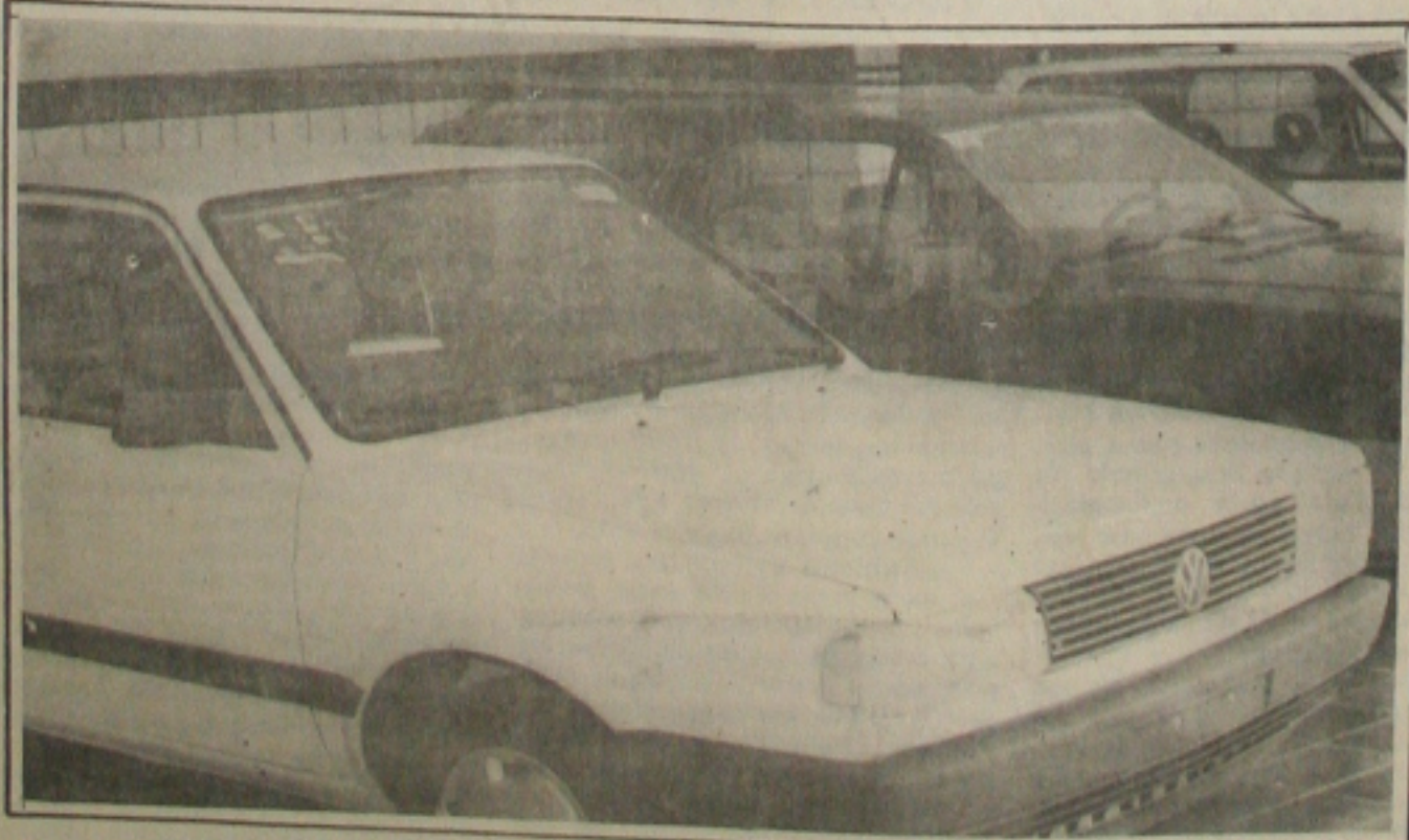
O comércio de carros usados em Sergipe sofreu forte impacto da crise econômica em 1993.

O ano de 1993 não foi muito bom para o comércio de carros usados em Sergipe. As revendedoras da capital apresentaram uma queda substancial nas vendas, em torno de 20 por cento. Nestes primeiros dias de 1994, os negócios estão praticamente parados, principalmente por conta do reajuste de 32% nos preços em vigor desde a última sexta-feira. Alguns revendedores consideram normal esta reação do mercado nos primeiros dias do ano, enquanto outros, mais pessimistas, acreditam que somente a partir do próximo mês as vendas tendem a crescer. (Página 5A)