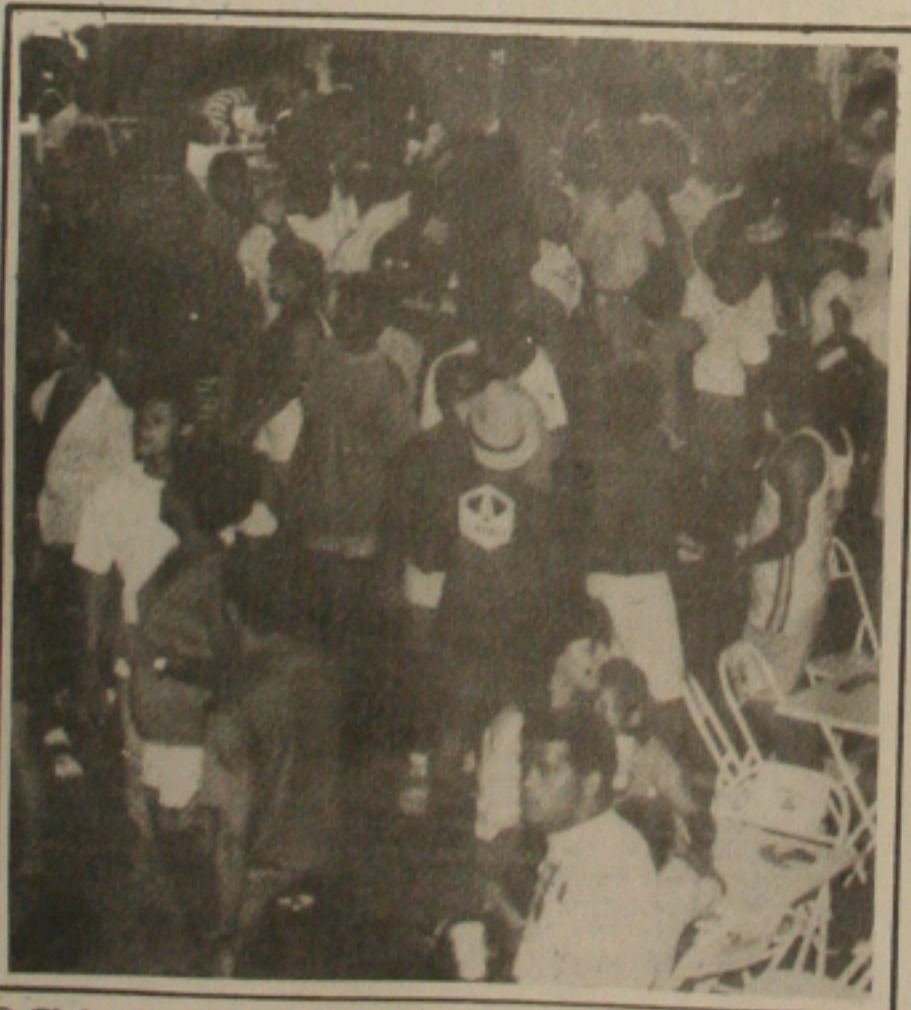
O Clube do Povo reunirá centenas de foliões nas cinco noites.

No Carnaval do Povo 94 será montado um stand, no Parque Teófilo Dantas, onde os foliões poderão se fazer maquiagem típica dos festejos momescos. O trabalho foi idealizado por Tácio e Jô que estarão à disposição dos aracajuanos no Armazém da Maquiagem.