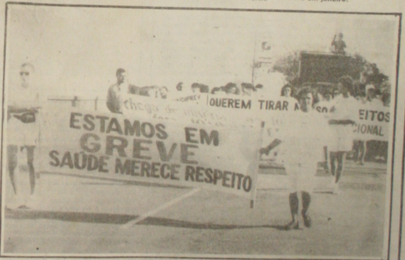
Os servidores da área de saúde foram às ruas protestar contra os baixos salários.

Portando faixas com palavras de protesto contra a política salarial do Governo do Estado, dezenas de servidores públicos da área de saúde, em greve há 20 dias, saíram em passeata ontem pelas ruas do centro de Aracaju até chegar em frente ao Palácio Olímpio Campos, na Praça Fausto Cardoso. Além dos baixos salários, os grevistas também denunciaram as péssimas condições de trabalho nos postos de saúde da rede estadual e nos Hospitais conveniados ao SUS (Sistema Único de Saúde). (Página 6A).