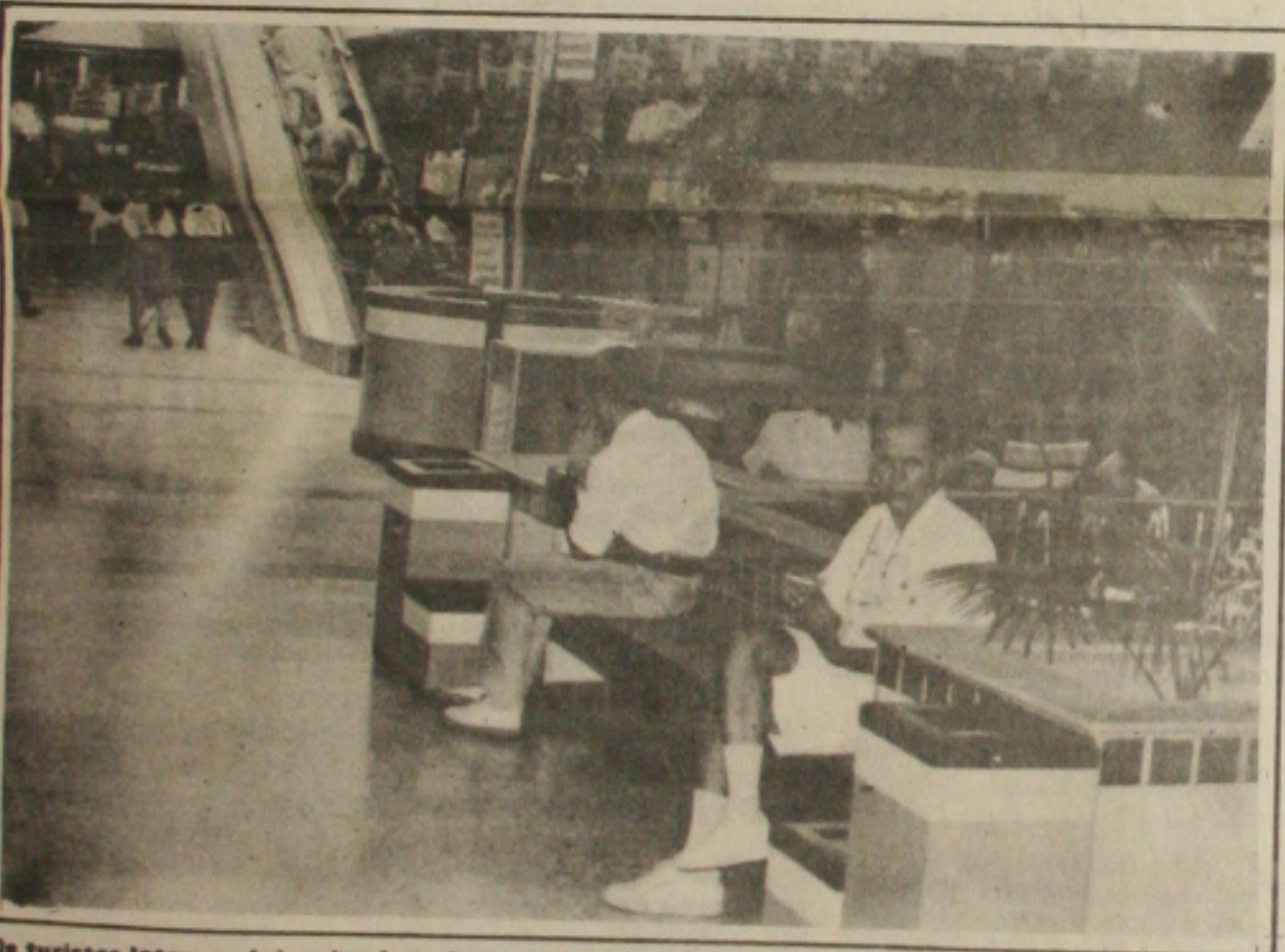
Os turistas lotam as lojas do shopping neste período de verão.

da coleção primavera/verão e já aguardam a nova coleção, outono/inverno que deverá ser lançada a partir da segunda quinzena do mês de março. Nesta nova fase, a administração do shopping e os lojistas pretendem proporcionar desfiles para exibir os novos modelos. "Em 93 registramos um crescimento real de 30% em relação ao ano anterior. Em 94 nós estamos apostando no crescimento e já estamos pensando no lançamento da ampliação do shopping. Acreditamos portanto que 94 será o ano de consolidação do empreendimento em Aracaju", finalizou Pires.