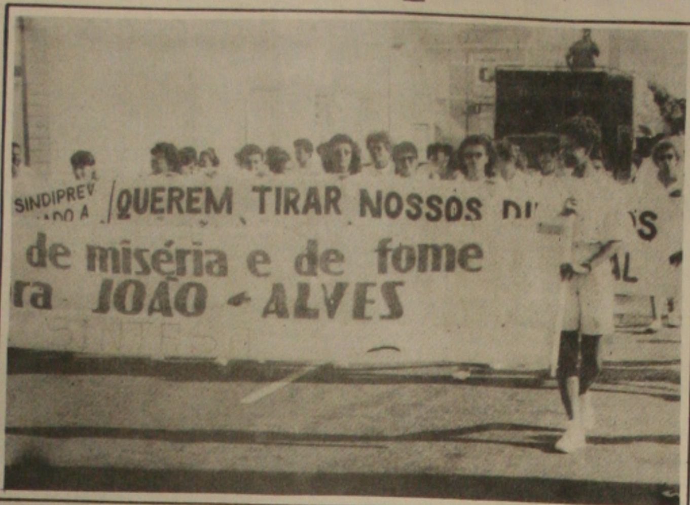
Os servidores da Saúde saíram em passeata contra os baixos salários pagos pelo Governo.