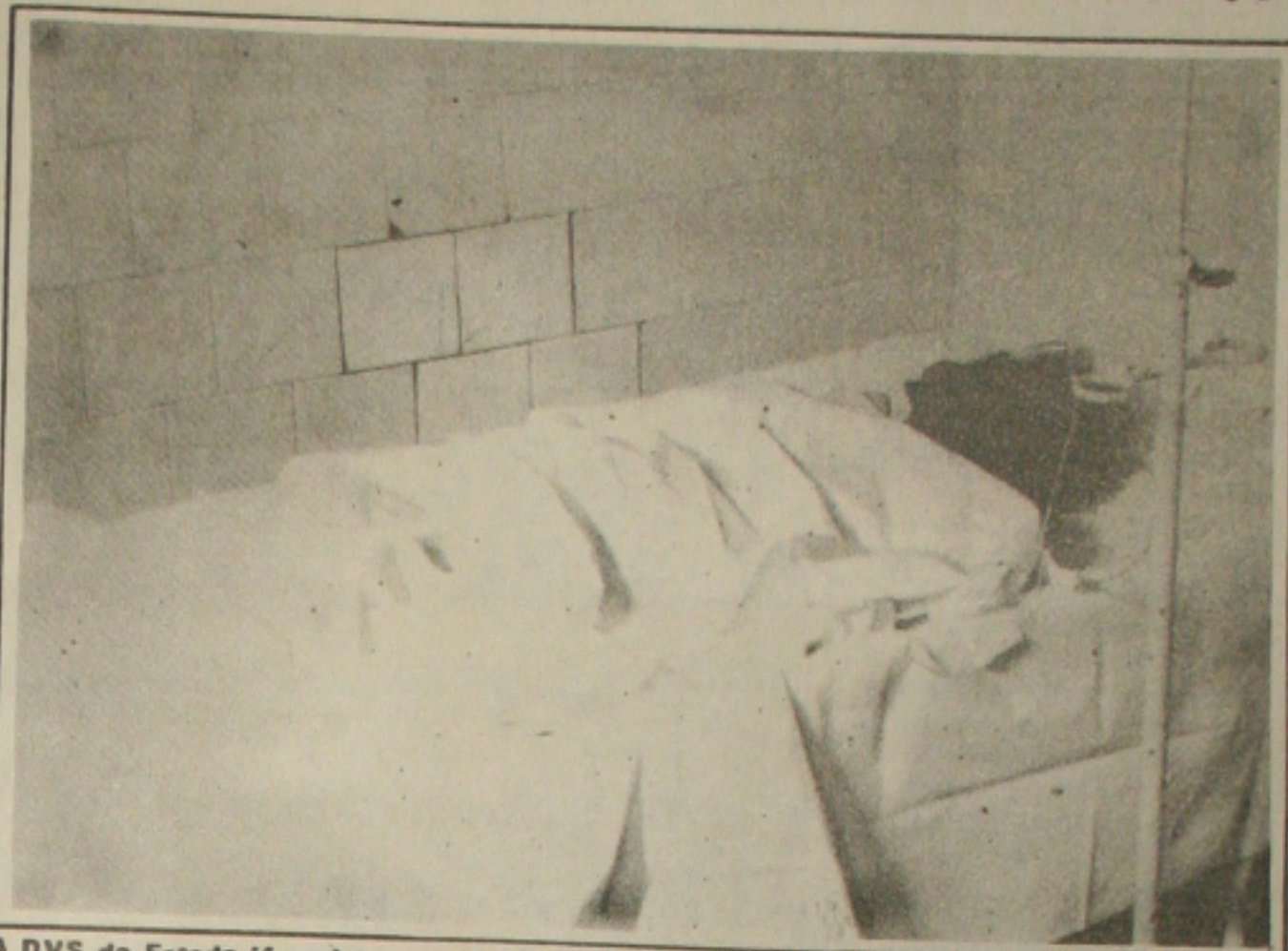
A DVS do Estado já registrou de janeiro até agora, 11 casos de cólera em Sergipe.

Ela acredita que a doença tende a se expandir em Sergipe por conta do intercâmbio entre sergipanos e alagoanos. Como forma de evitar a disseminação da doença, técnicos da Secretaria da Saúde estão viajando para o interior do Estado fazendo o monitoramento dos rios e desencadeando uma campanha corpo a corpo junto à população transmitindo informações precisas sobre as medidas que devem ser adotadas pela comunidade para evitar o contágio da doença.