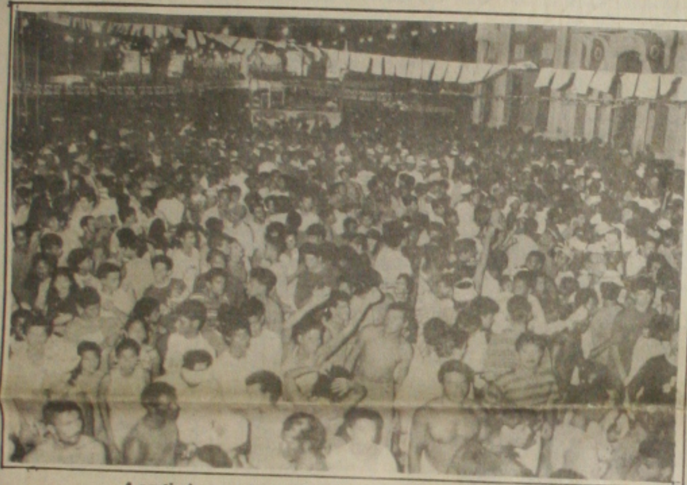
A partir de sexta-feira, milhares de foliões voltarão a ocupar o Clube do Povo

Em março, a Unidade Real de Valor, que servirá como referência para a correção monetária em toda a economia, já poderá estar vigorando, admitiu ontem o ministro da Fazenda, Fernando Henrique Cardoso. O lançamento da URV depende apenas da promulgação da emenda constitucional que cria o Fundo Social de Emergência (FSE). Para Fernando Henrique, isto deve ocorrer até o final de fevereiro, a emenda foi aprovada em primeiro turno ontem e deverá ser votada