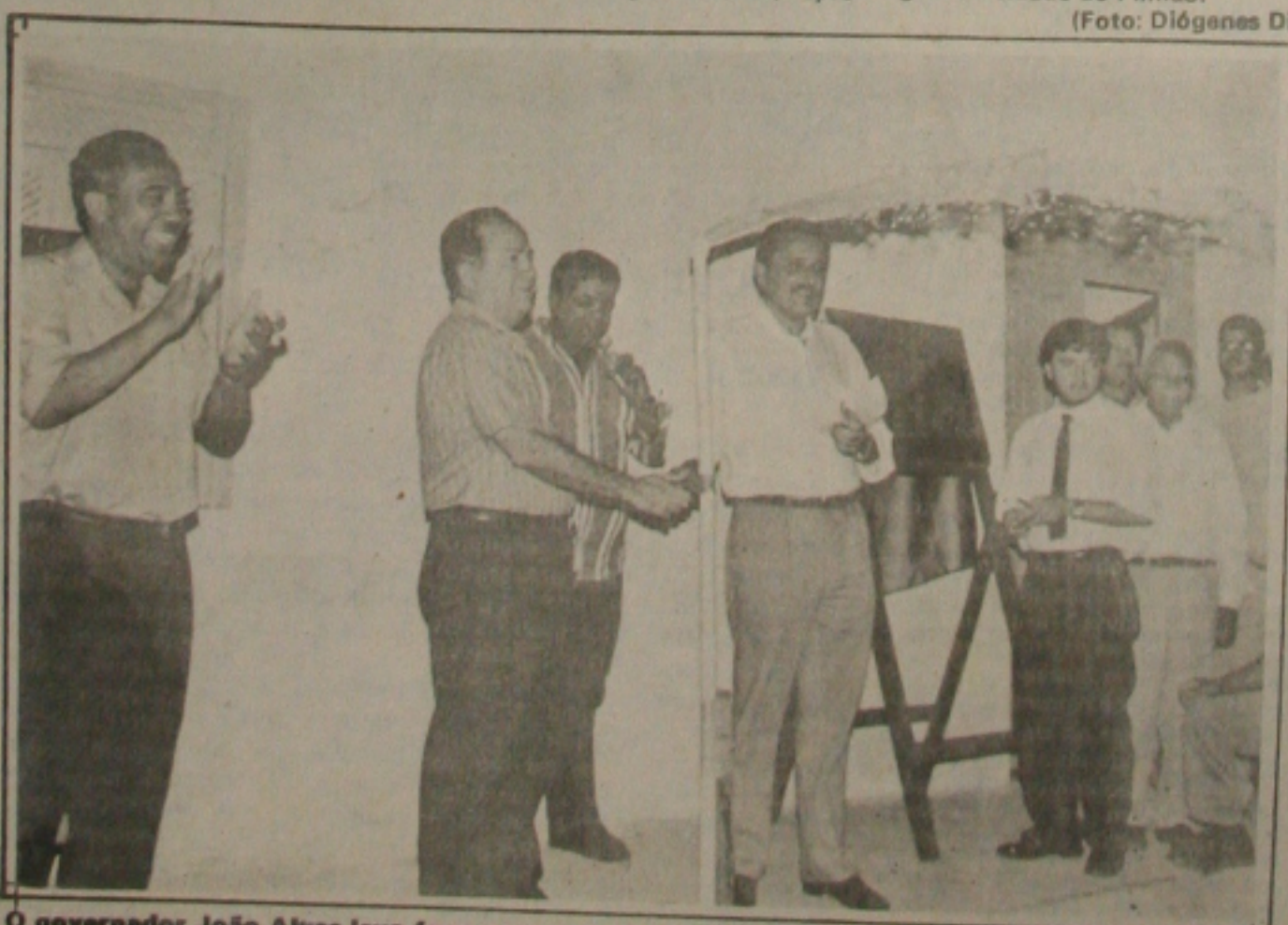
O governador João Alves leva água para mais dois povoados

Amanhã é o Dia Nacional de Mobilizações e Greves com atos públicos e passeatas. Por conta disso, trabalhadores sergipanos, assim como os de todo o país, irão às ruas protestar contra o Plano Fernando Henrique Cardoso (FHC2), revisão constitucional e reivindicar reforma agrária, revisão constitucional, controle rígido dos preços e não pagamento da dívida externa.