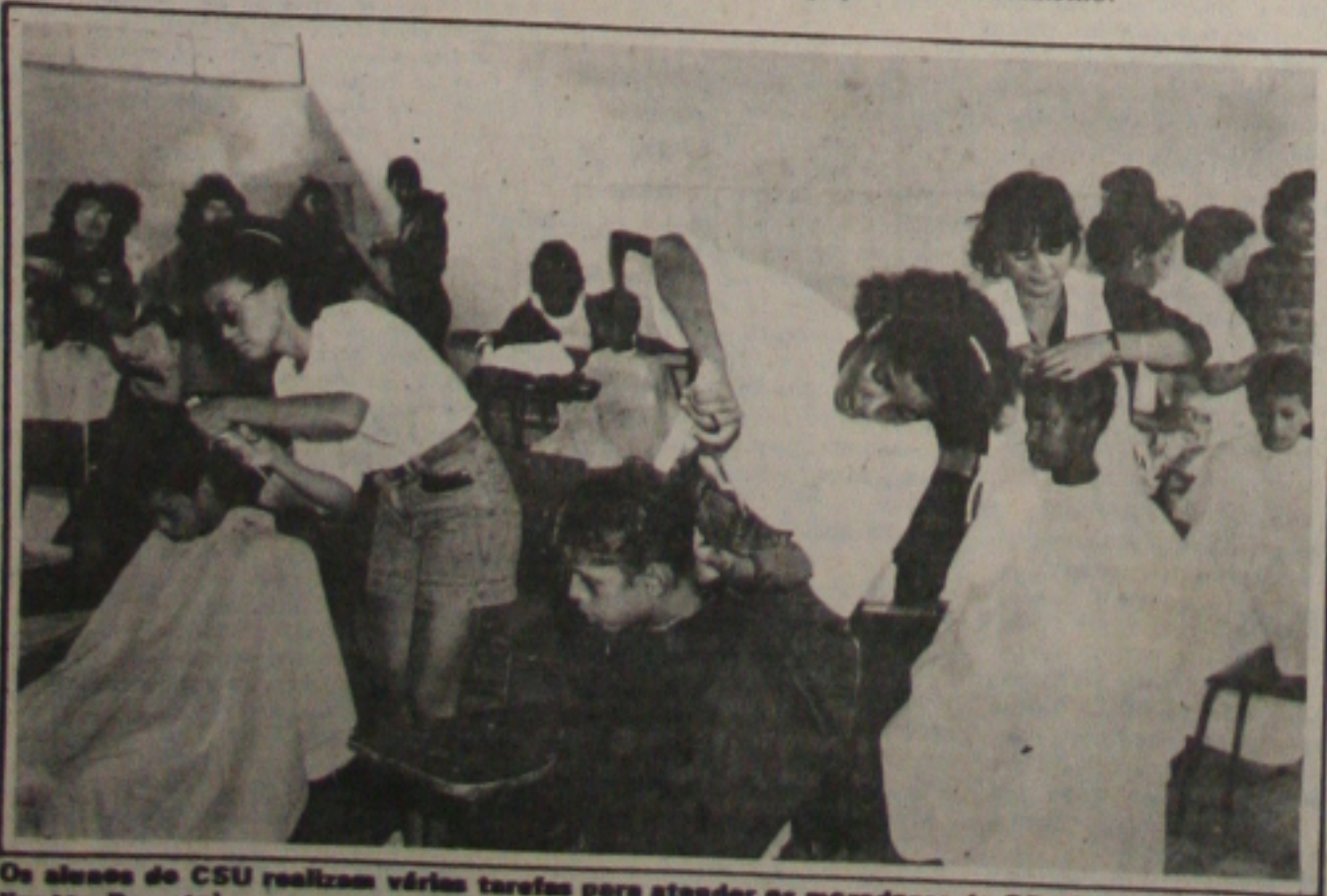
Os alunos do CSU realizam várias tarefas para atender os moradores do São Carlos.