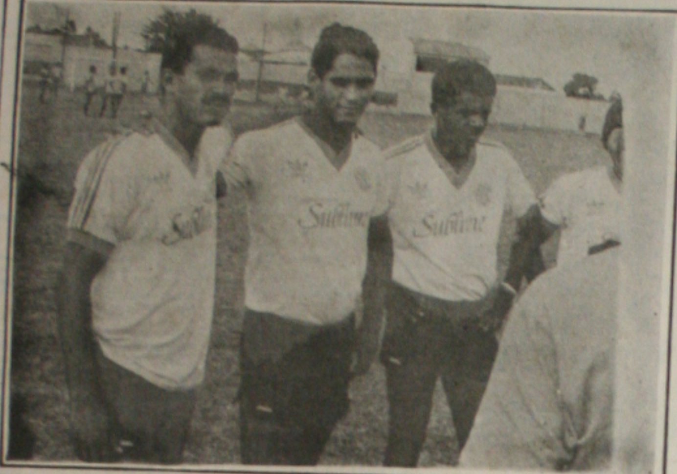
Malvina não usufruirá o Cotinguiba