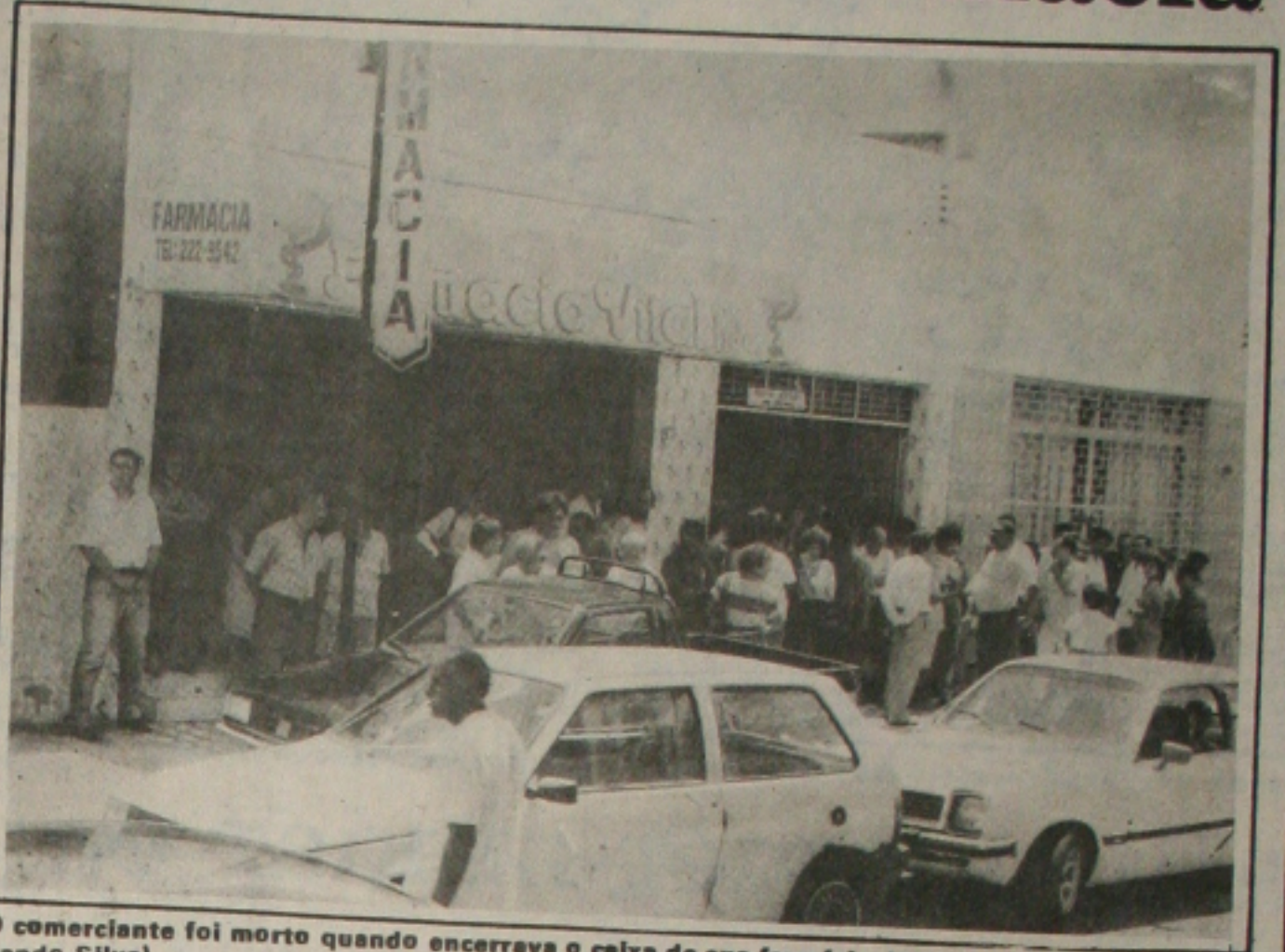
O comerciante foi morto quando encerrava o caixa de sua farmácia domingo à noite.

A polícia fará um raio X da atual situação do comerciante para chegar a uma conclusão do motivo do crime. Todos os casos em que esteve envolvido será investigado a partir de agora e todos os amigos e inimigos também serão acompanhados de perto pelos policiais da Homicídios.