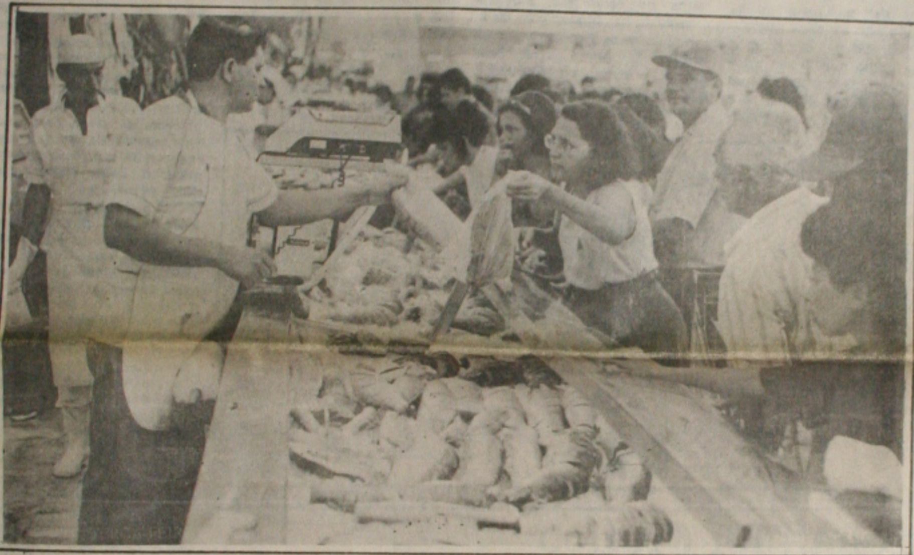
Os consumidores têm reclamado constantemente dos aumentos nos preços do pescado

BRASILIA - A crise entre os Poderes Executivo, Legislativo e Judiciário assumiu ontem proporções imprevisíveis depois que o presidente Itamar Franco mandou o Banco do Brasil cancelar o acréscimo de 10,94% ao pagamento dos órgãos do Poder Judiciário, do Senado Federal, do Ministério Público e do Tribunal de Contas da União. A decisão de Itamar foi seguida de uma pesada nota divulgada pelo Supremo Tribunal Federal em que os onze ministros mantiveram a decisão de converter seus salários em URV pela média do dia 20 e não pelo dia 30. A decisão do STF, baseada no artigo 168 da Constituição, contrária a Medida Provisória do Plano Econômico, que cria a Nova Unidade de Valor.