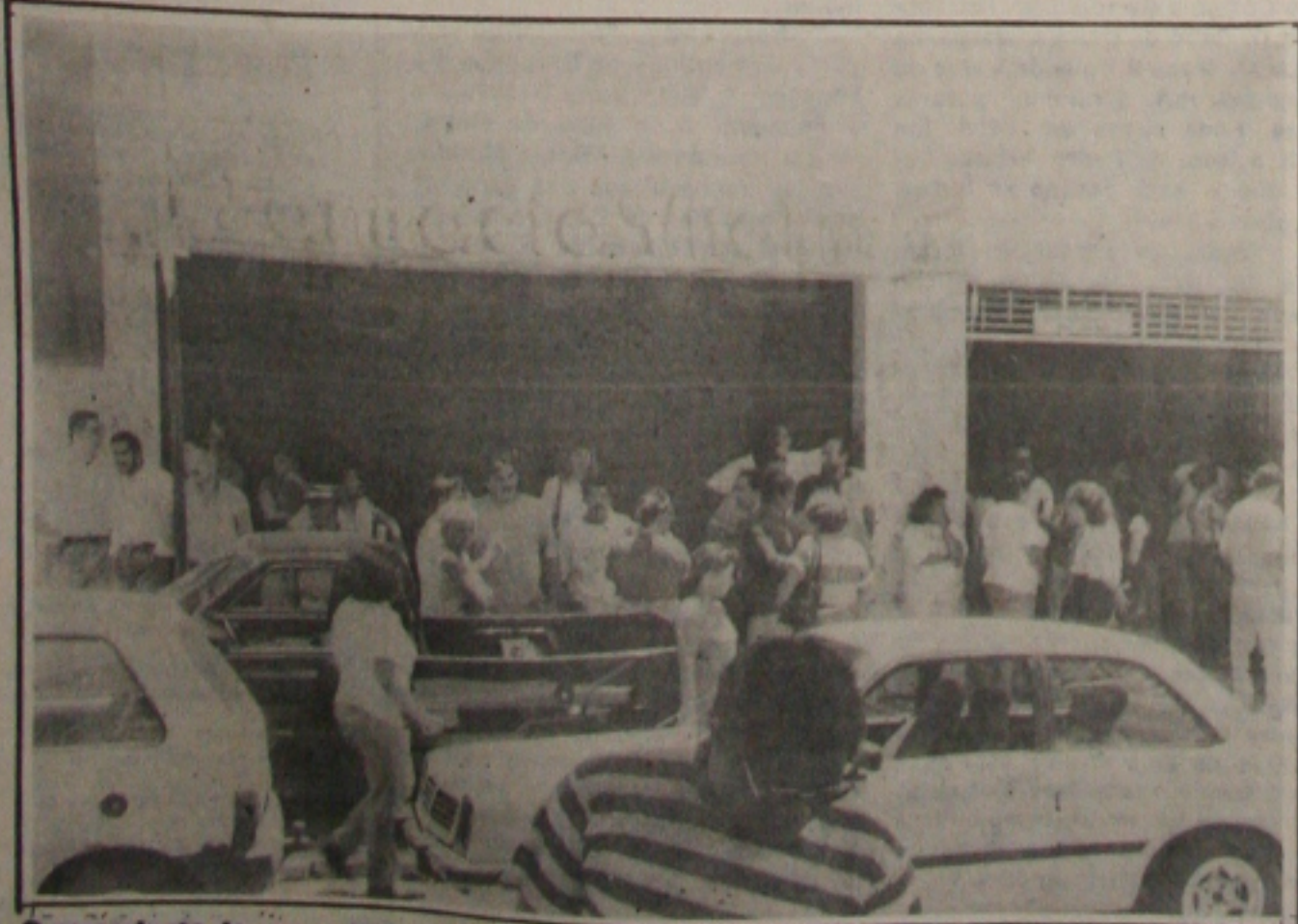
O assassinato de comerciante atrai muita gente à porta da farmácia da vítima.

dos "sete anos" da máfia do orçamento. O ex-líder do PMDB Genebaldo Correia (PMDB-BA) aplicou ontem o "golpe da renúncia" e garantiu assim a manutenção de seus direitos políticos e o encerramento do processo de cassação na Comissão de Justiça e Constituição. (Página 4B)