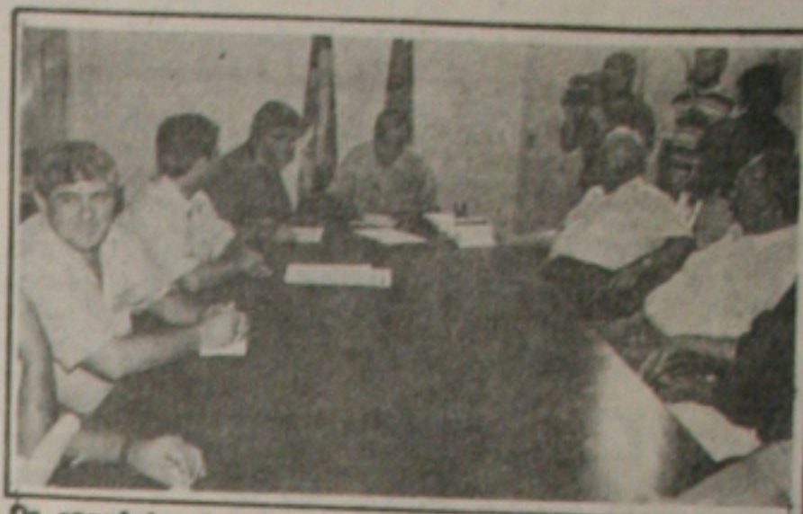
Os convênios foram assinados ontem pelo governador e os prefeitos.