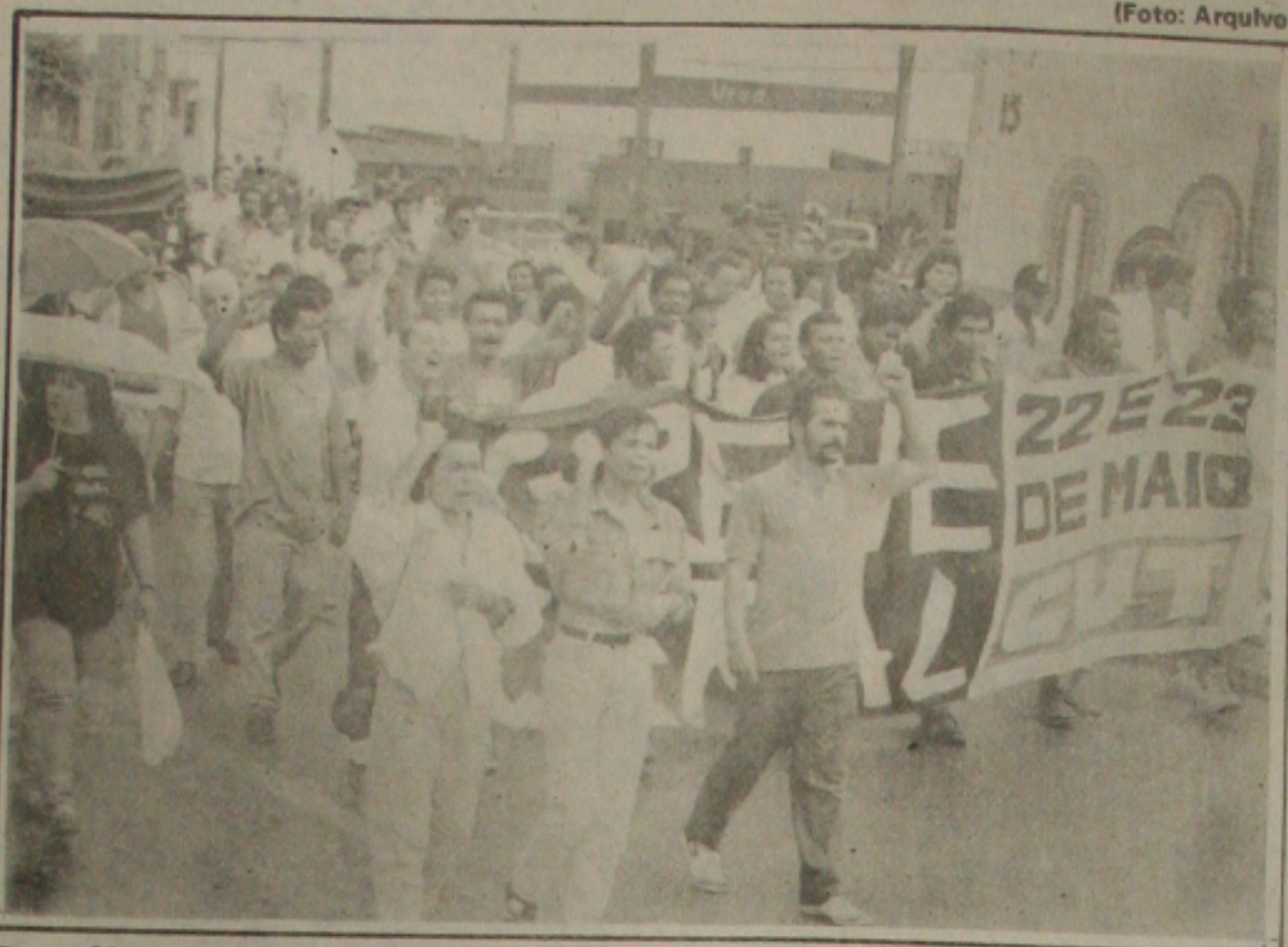
Os servidores federais participarão amanhã de protestos contra o Plano FHC 2

O Parlamento Eumênico da LBV lutará pela conciliação universal de todo o conhecimento humano e espiritual, numa poderosa força a serviço dos povos. É um convite à Paz, um brado de Amor à Humanidade: ou nos unimos ou não sabemos onde iremos parar. E a solução é a reforma íntima do Ser Humano, inspirado Naquele que é o Pai do mundo, Jesus!