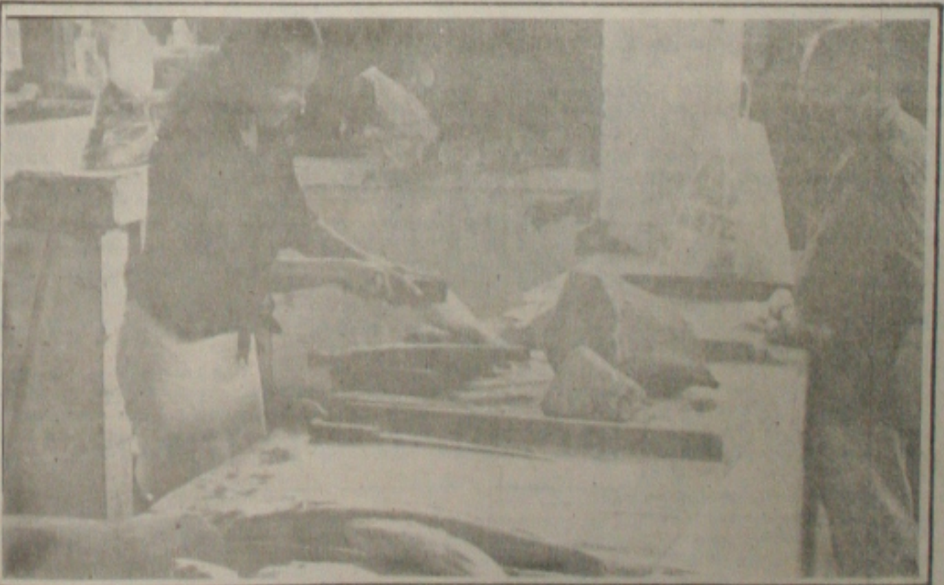
A pesquisa da Sunab mostra a elevação do preço do pescado em Aracaju.

O bacalhau foi encontrado em apenas um estabelecimento comercial, o Hiper Bompreço onde variou de preço de acordo com a qualidade. O de primeira foi comercializado por CRS 5.400 enquanto que o mais inferior está custando CRS 5.140 o quilo.