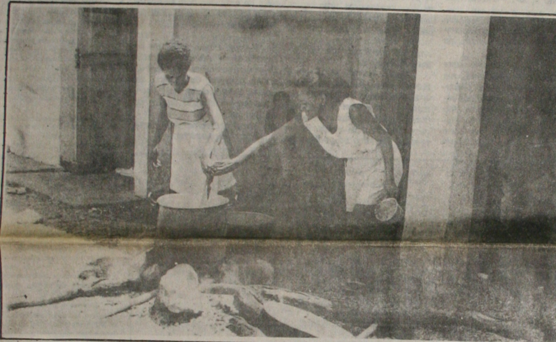
As famílias de colonos acampam no Incra onde até improvisaram um fogareiro e lenha para preparar a comida

Líderes dos maiores partidos no Congresso Nacional - PMDB, PFL, PSDB e PPR - elaboraram um projeto alternativo como uma solução para contornar a grave crise institucional entre o Executivo Judiciário e Legislativo em relação à questão dos salários. As lideranças encontraram uma saída honrosa tanto para o presidente Itamar Franco quanto para os ministros do Supremo Tribunal Federal. Pelo projeto, o governo ficaria proibido de reter parte de valores solicitados pelos chefes de Poderes para pagamento da folha de salário e no dia 30, de cada mês seria fixado como data para conversão dos vencimentos em URV. O projeto deve ser votado hoje, juntamente com a MP 434, que cria a URV, cuja votação, prevista para ontem, acabou adiada. (Página 4B).