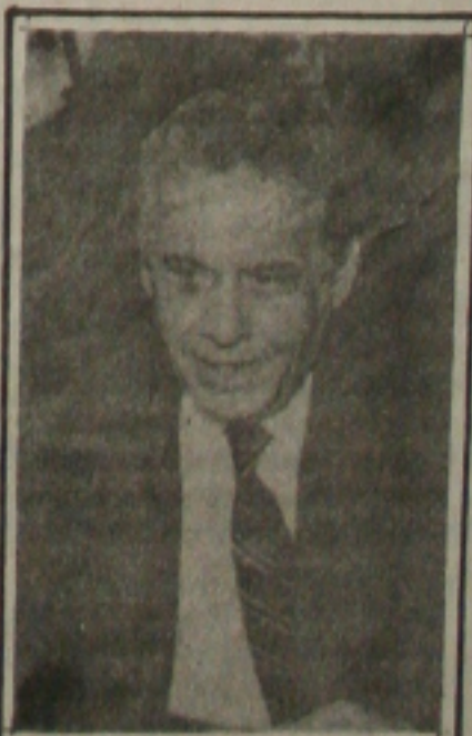
Cardoso: vitória ao negociar mudanças depois da reedição da medida.

A estratégia dos líderes governistas foi protelar o início da votação com intermináveis discursos até que o plenário ficasse vazio e a sessão, que começou às 10 horas, fosse encerrada por falta de quorum. Os líderes do Governo na Câmara, Luís Carlos Santos, e no Senado, Pedro Simon, e do PMDB, Tarcísio Delgado, subiram a tribuna para pedir o adiamento da votação, atendendo a um pedido de Fernando Henrique. Simon apelou para o senso de responsabilidade dos parlamentares num momento de crise entre os três poderes e garantiu que o ministro estará abor-