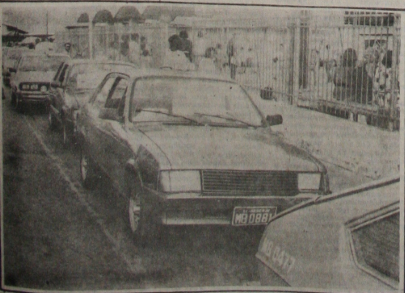
Se a isenção for aprovada, os taxistas terão mais condições de renovar a atual frota de veículos