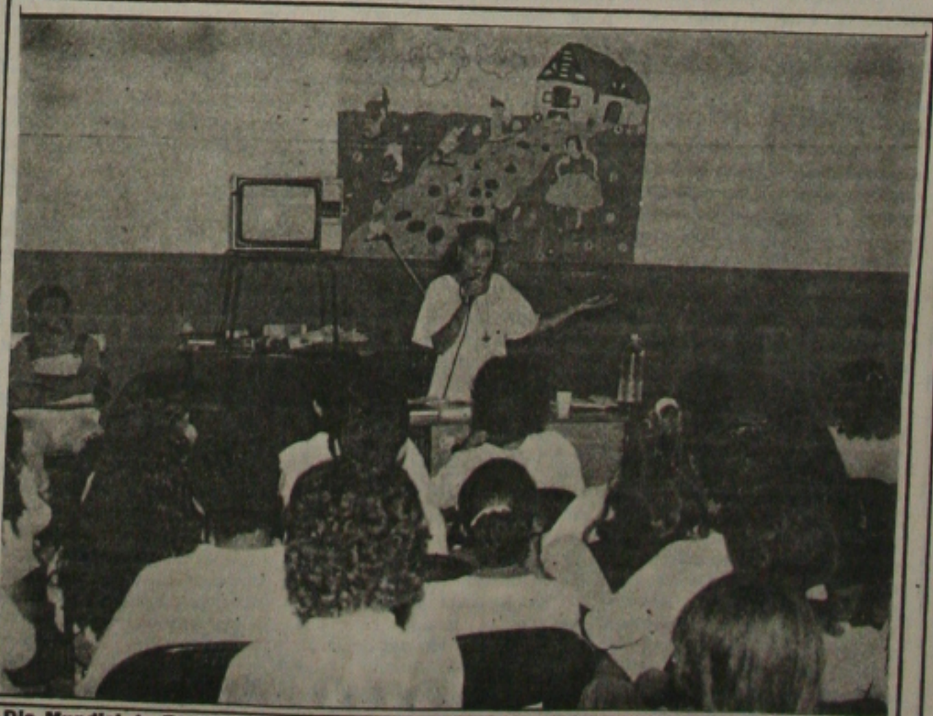
O Dia Mundial do Teatro será comemorado hoje com palestra e almoço no Sesc.