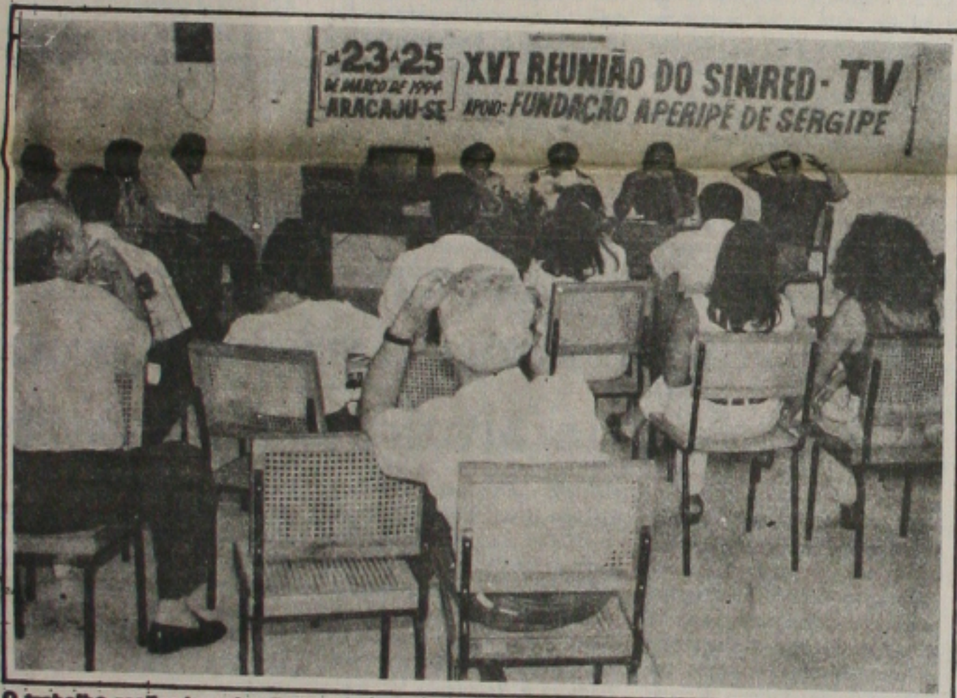
O trabalho realizado pelas TV's Educativas estão em debates na reunião do Sinred.