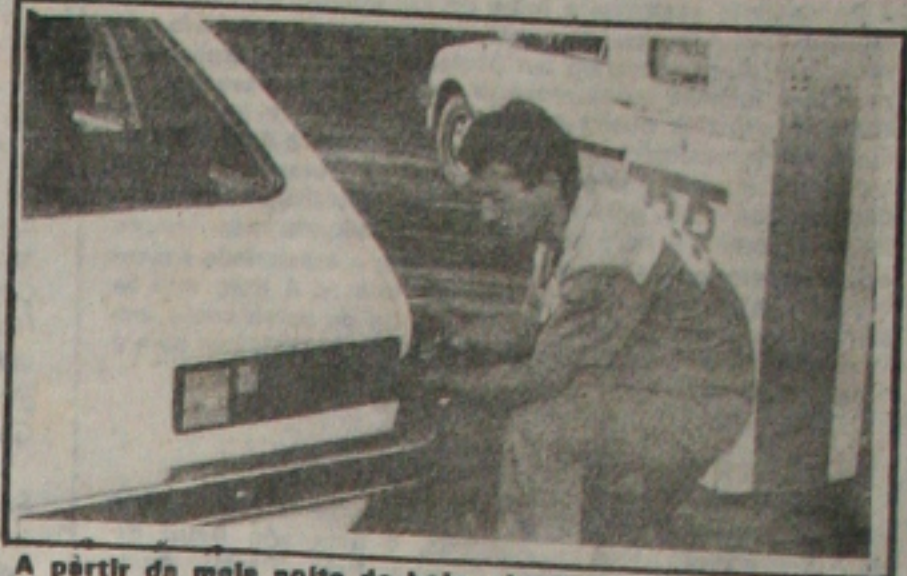
A partir de meia-noite de hoje, abastecer vai ficar mais caro outra vez

Os combustíveis ficam 19,25% mais caros a partir da meia-noite de hoje. O reajuste foi anunciado ontem pelo Ministério da Fazenda, com bastante antecedência para não repetir a confusão do último aumento, quando os preços foram corrigidos sem qualquer aviso prévio à população, conforme orientação do presidente Itamar Franco. Com este novo reajuste os combustíveis já acumulam correção de 168,14%, para uma variação da UFIR de aproximadamente 163% e da URV de 154,85% no mesmo período. Este é o sexto aumento do ano para os combustíveis.