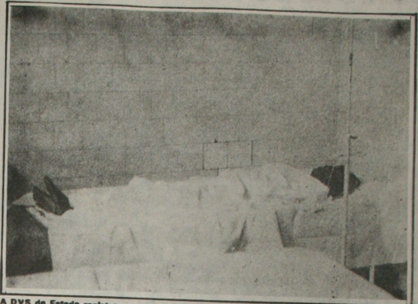
A DVS de Estado registrou o primeiro óbito causado pela cólera este ano em Sergipe.

Para evitar a proliferação da doença no Estado, a Secretaria da Saúde está realizando semanalmente o monitoramento das águas dos rios, um trabalho