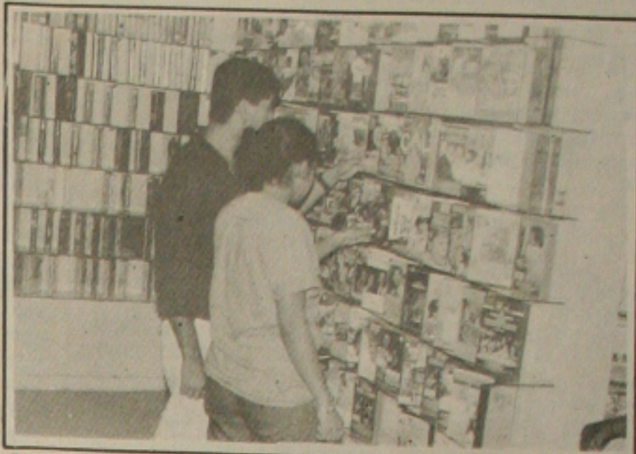
Com o horário político, tem sido grande a procura de filmes nas locadoras da capital.

O programa eleitoral gratuito transmitido diariamente através da TV, antes de ajudar o eleitorado a escolher melhor seus candidatos, tem ao contrário provocado muita insatisfação entre os sergipanos. E quem tem lucrado com isso são as locadoras de vídeo. Em algumas delas, a procura por filmes chegou a aumentar mais de 100%. (Página 4A)