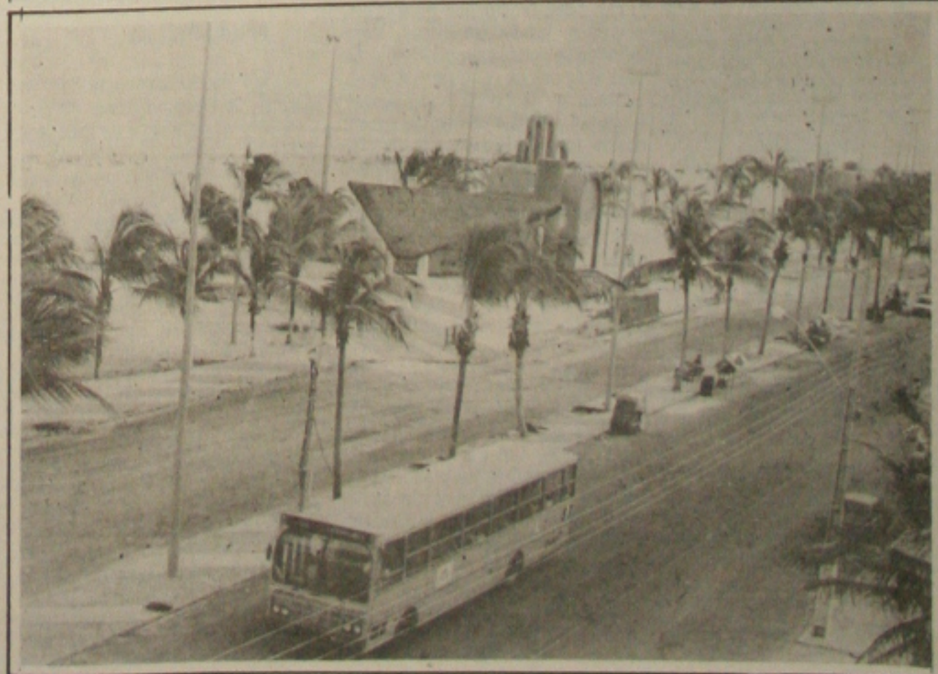
O Projeto Orla inaugura a sua segunda etapa no final de setembro em grande estilo.

Nos próximos 60 dias a Rua 24 Horas será entregue à comunidade sergipana. Ela, que foi no projeto da Rua 24 Horas de Curitiba, terá cinema, lanchonetes, farmácias e lojas de conveniências, entre outras coisas. "Já foi feita a licitação de 40 lojas e apareceram 300 interessados. Para a construção da obra foram gerados 300 empregos diretos", afirmou, acrescentando que a Rua 24 Horas também atrairá vários turistas.