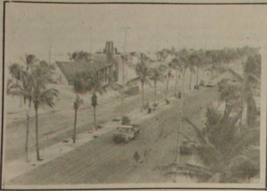
As obras da primeira etapa do Orla já mudaram radicalmente a Praia de Atalaia.