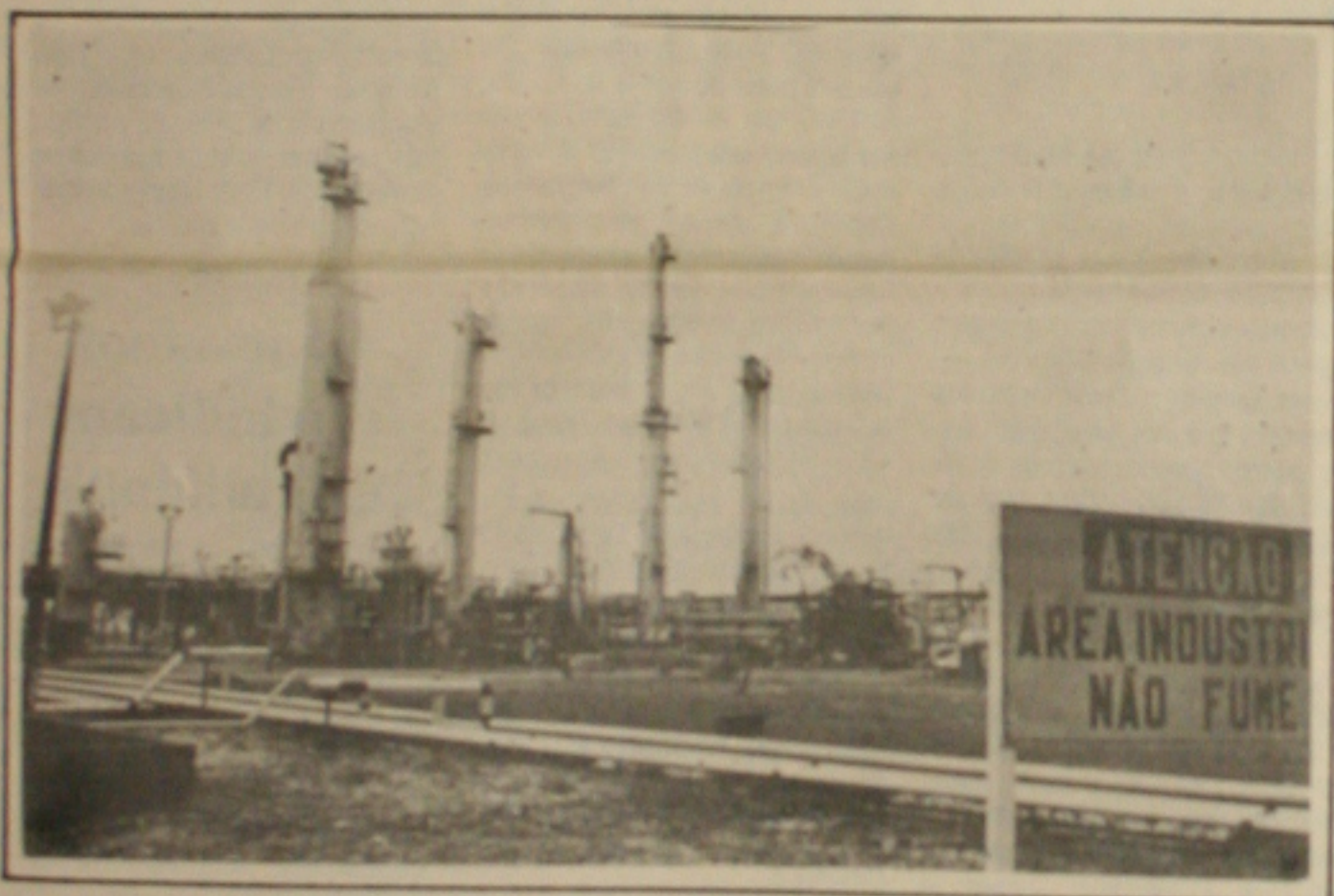
A produção de gás de cozinha ainda está assegurada no Estado.

O número de candidatos inscritos cresceu nos últimos anos, mas neste ano, se comparado com os números registrados no ano passado, foi inferior. Em 1992, a Universidade Federal de Sergipe inscreveu 8.786 candidatos, no ano seguinte este número aumentou para 12.063 e neste ano são 11.825 candidatos. Os cursos mais concorridos são medicina que se destaca em primeiro lugar com 1998 candidatos inscritos disputando as 70 vagas oferecidas, direito noturno com 1205 candidatos inscritos disputando as 40 vagas disponíveis e o curso de odontologia com 754 candidatos inscritos que disputam as 40 vagas ofertadas.