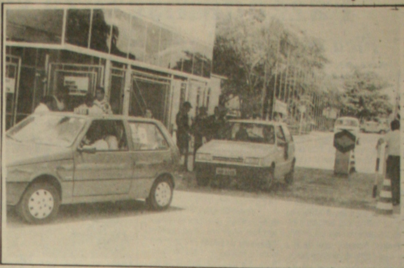
Os petroleiros não rendem as ameaças e mantêm a greve em Sergipe e Alagoas.

"Isto parte de uma pessoa desequilibrada. Um homem que se diz democrata jamais poderia conceder entrevistas ameaçando grevistas e colocando o efetivo militar para cobrir uma manifestação de trabalhadores insatisfeitos", avalia o sindicalista.