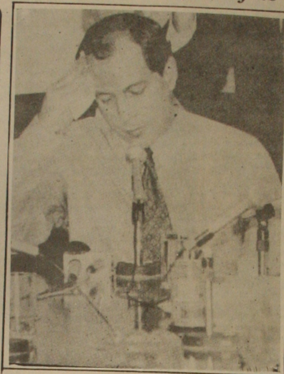
Ciro: quebra do monopólio

As prioridades serão as reformas fiscal e previdenciária. "Meu empenho é para assumir no governo os compromissos de campanha", disse o presidente eleito. "Se vocês quiserem ir além, ótimo."