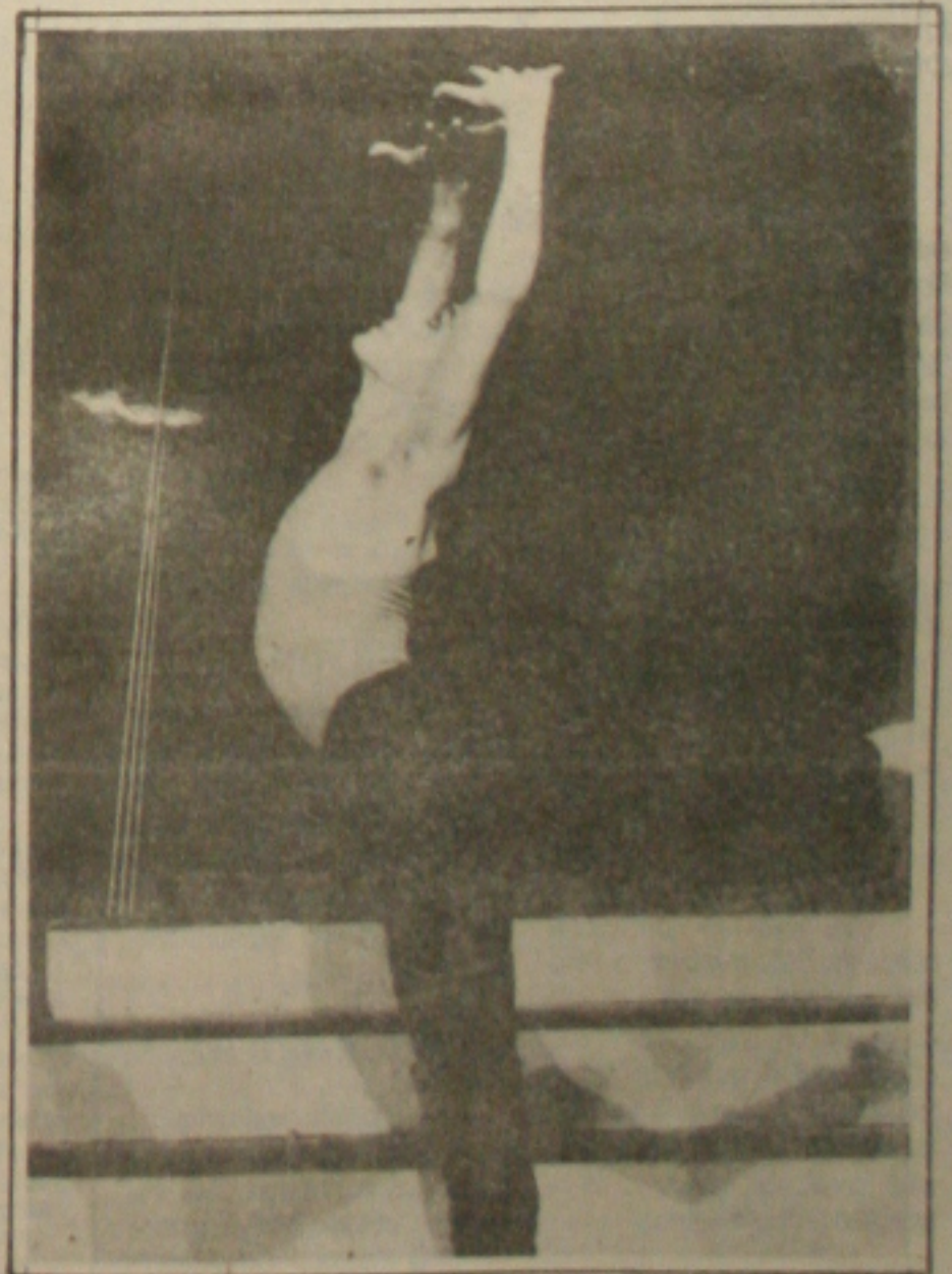
Este ano, o FASC não terá em sua programação shows e espetáculos de dança

ju e está disposta a continuar com as atividades paralisadas até o julgamento da greve pelo Tribunal Superior de Justiça (TSJ). Ontem, os trabalhadores iniciaram o processo de paralisação da produção da Fábrica de Fertilizantes do Nordeste (FAFEN) e também na Unidade de Processamento de Gás Natural (UPGN).