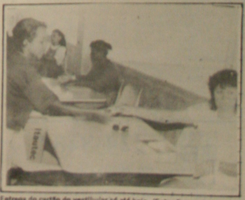
Entrega do cartão de vestibular só até hoje.