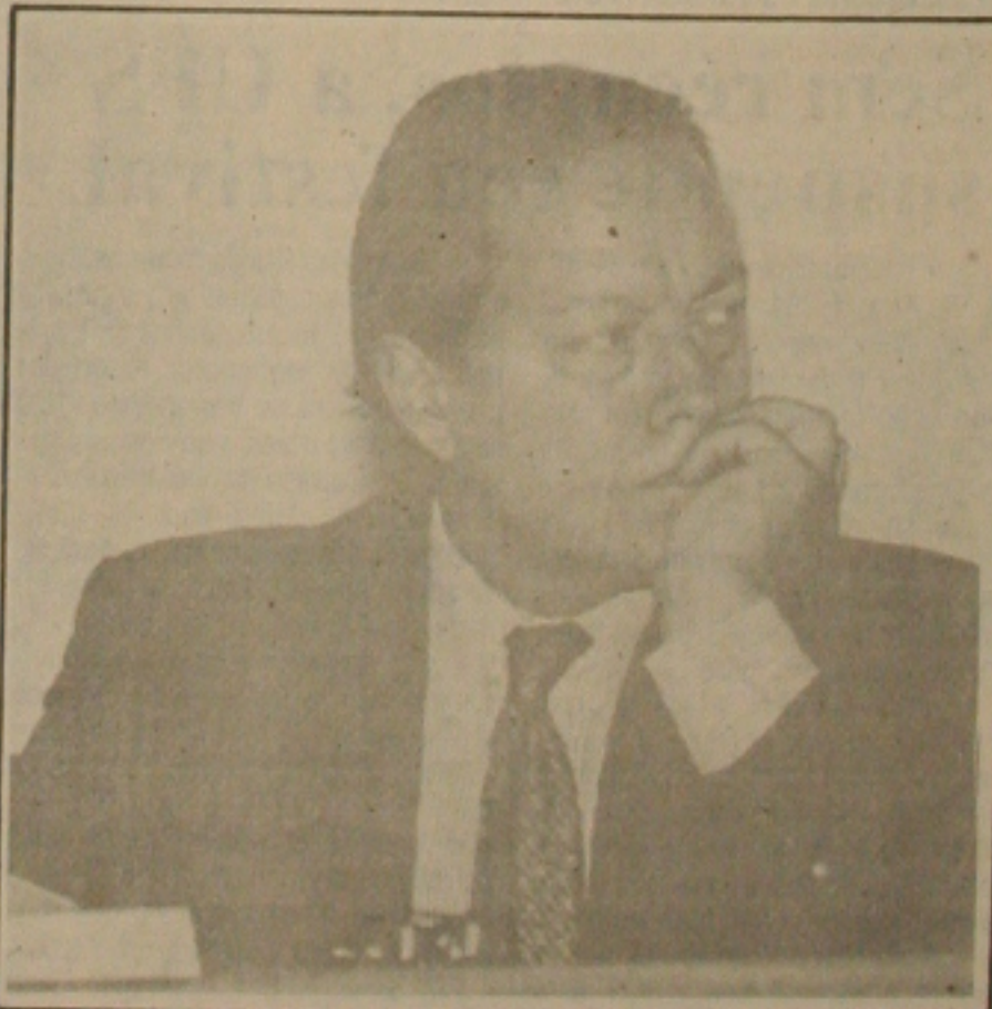
Pedro está preocupado com boato de quebra de instituições financeiras.

Pedro Malan disse que não se trata de tratamento especial e há casos que são precisos envolver o governador, como é o caso do Banespa (São Paulo). Malan não acha que o futuro governo vai pegar um abacaxi para descascar e todos estão confiantes no futuro do País (POR CLÁUDIO MESSIAS)