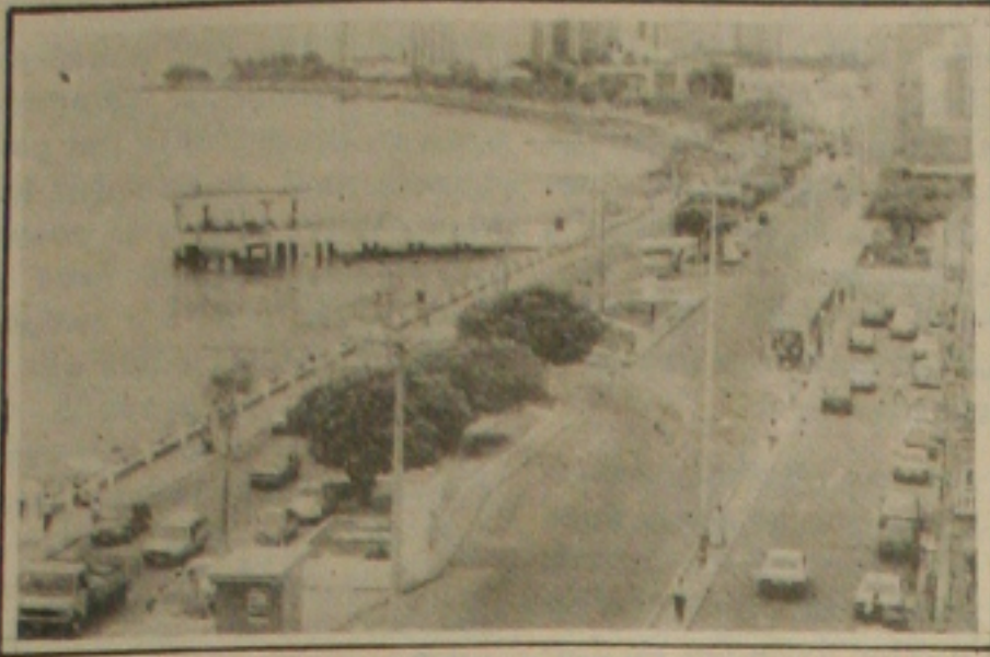
Aracaju tem crescido de forma desordenada, daí a necessidade do novo plano diretor