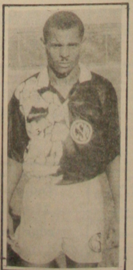
Currel, do CSM