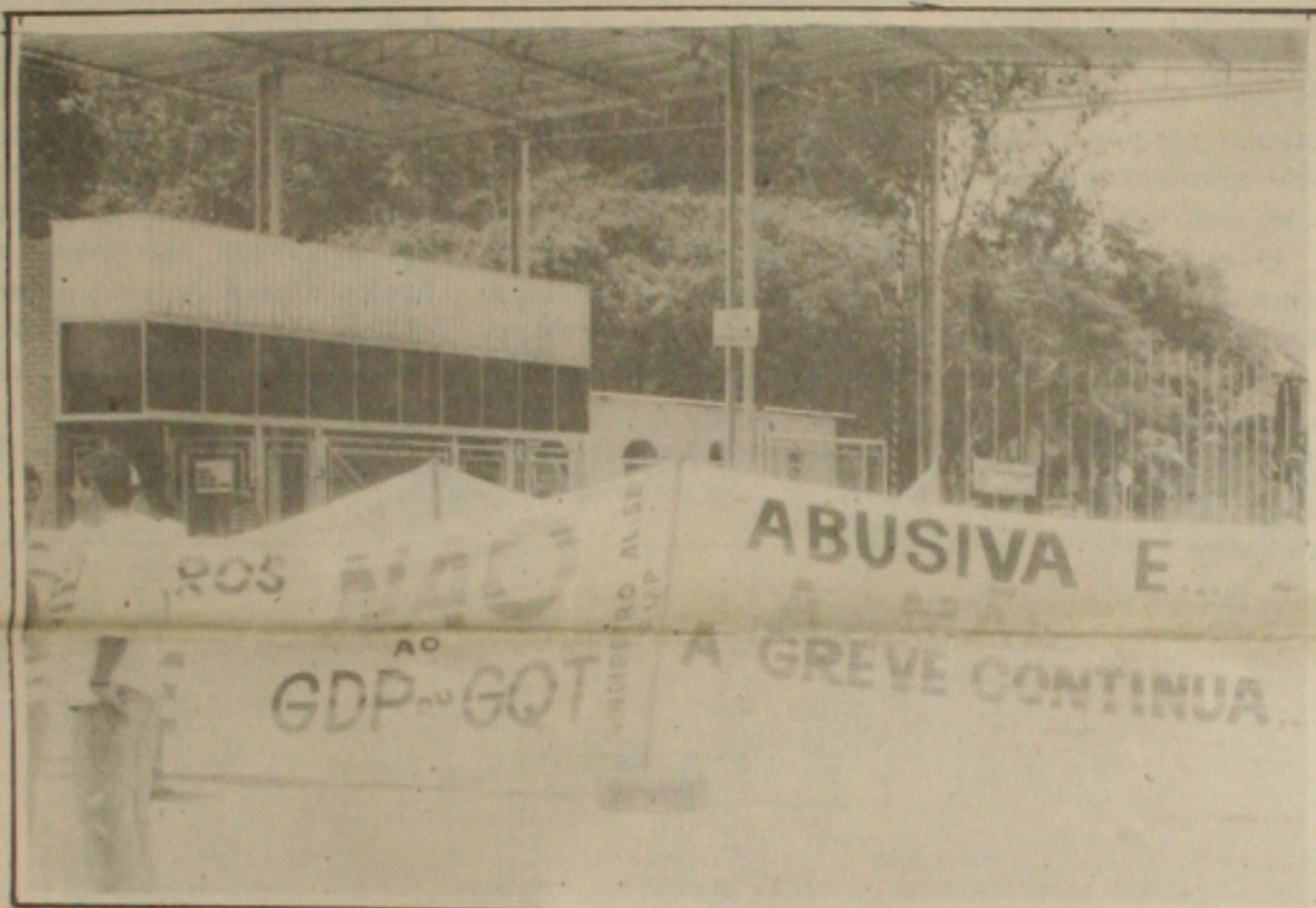
Na sede da Petrobrás, em Aracaju, os grevistas colocaram faixas criticando a posição do TST