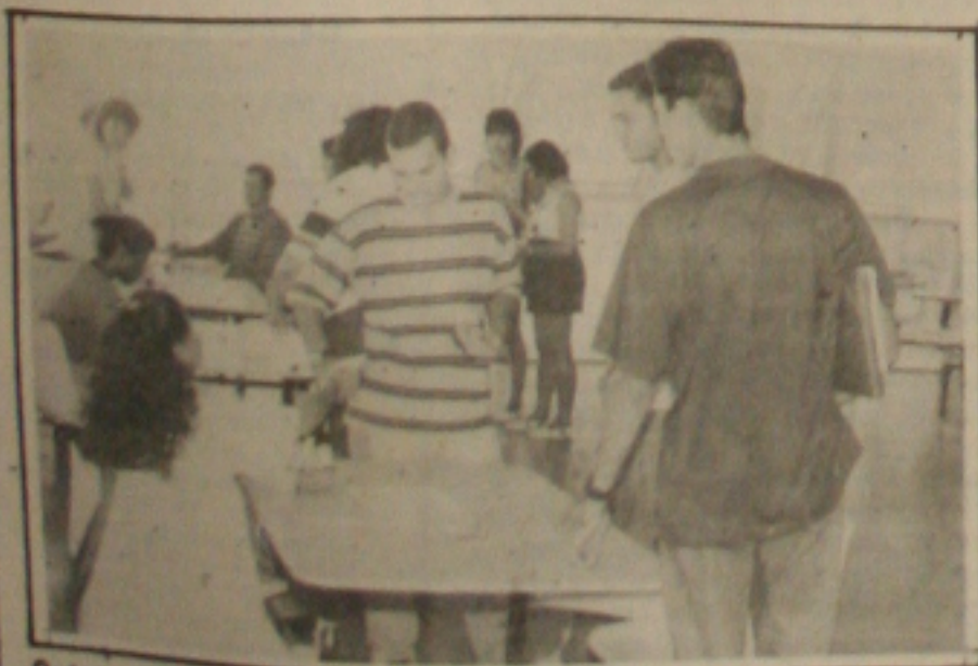
Ontem, muitos vestibulandos aproveitaram para pegar logo o cartão de identificação

Ciro prega o fim do monopólio (Página 4B)