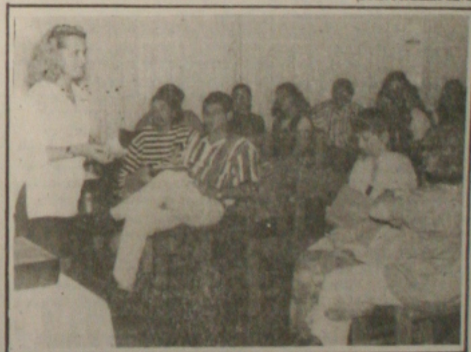
Encerrado o treinamento sobre aleitamento materno.

Monteiro diz que os "invasores" tiram os passageiros do SIT e quanto menor o número de pagantes, maior será a tarifa que, mesmo assim, está defasada, não dando para renovação da frota do SIT, prejudicando o usuário que reclama por ônibus novos. O DER está cometendo uma ilegalidade usando dois pesos e duas medidas.