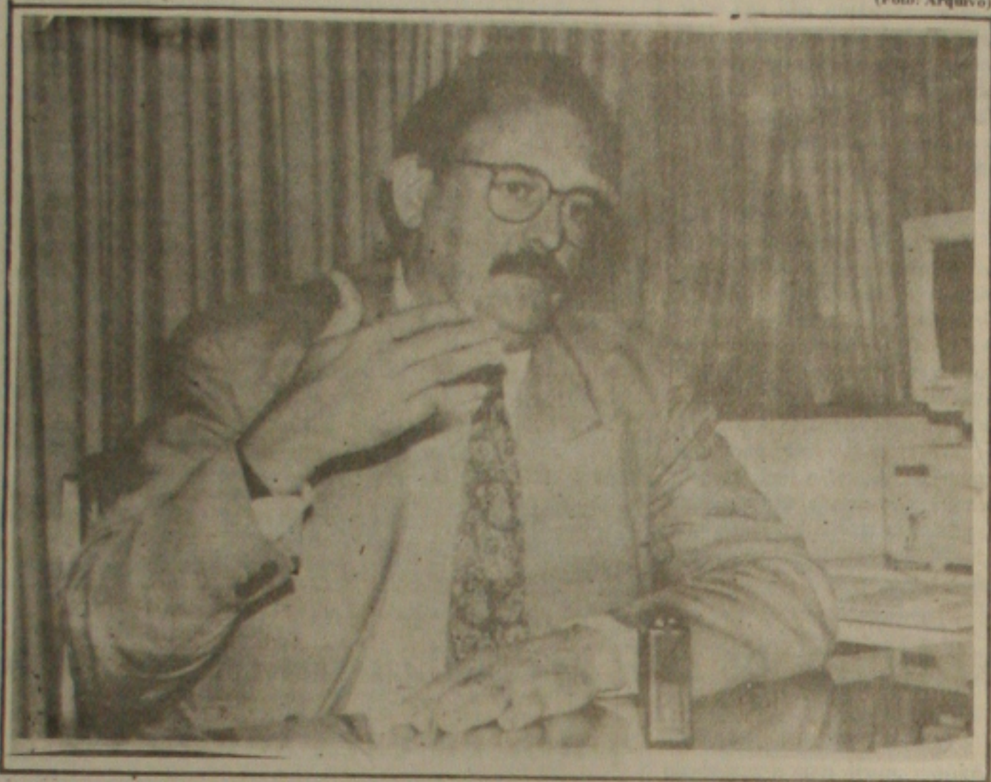
O ministro da Justiça Nelson Jobim será um dos palestrantes do seminário.