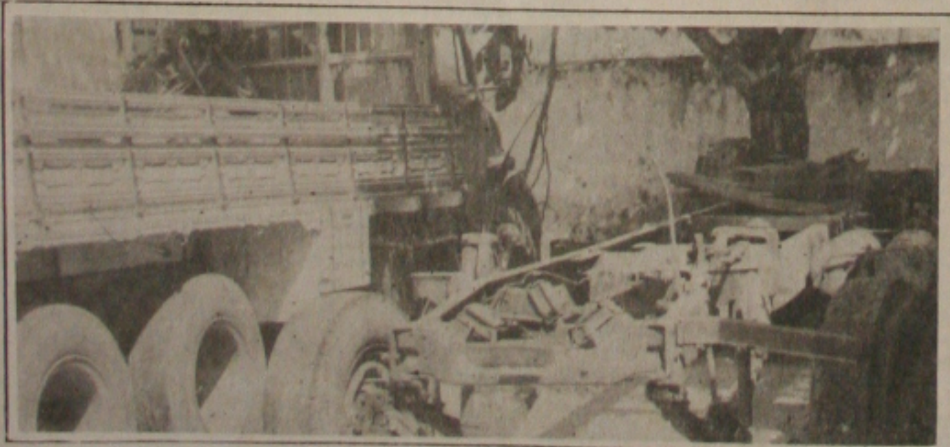
Na semana passada, a polícia conseguiu apreender o chassi de um dos caminhões roubados pela gangue