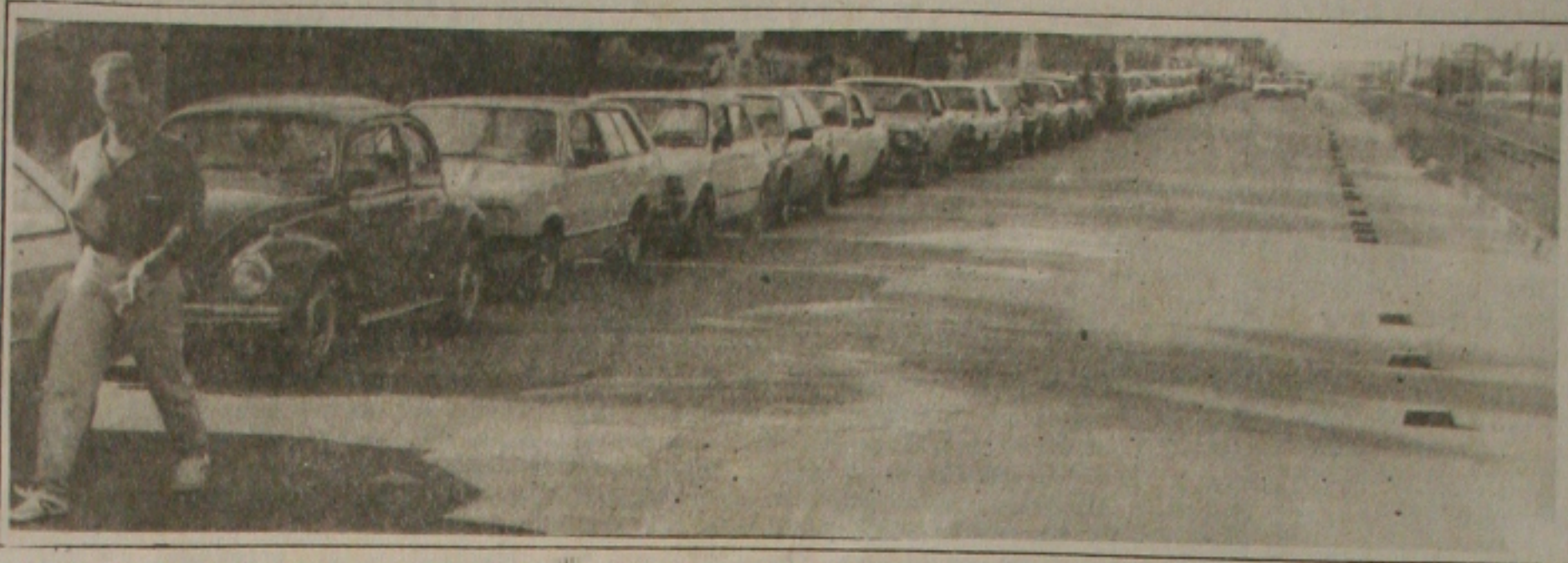
Este mês, a vistoria obrigatória dos veículos de placas amarelas provocou grandes filas