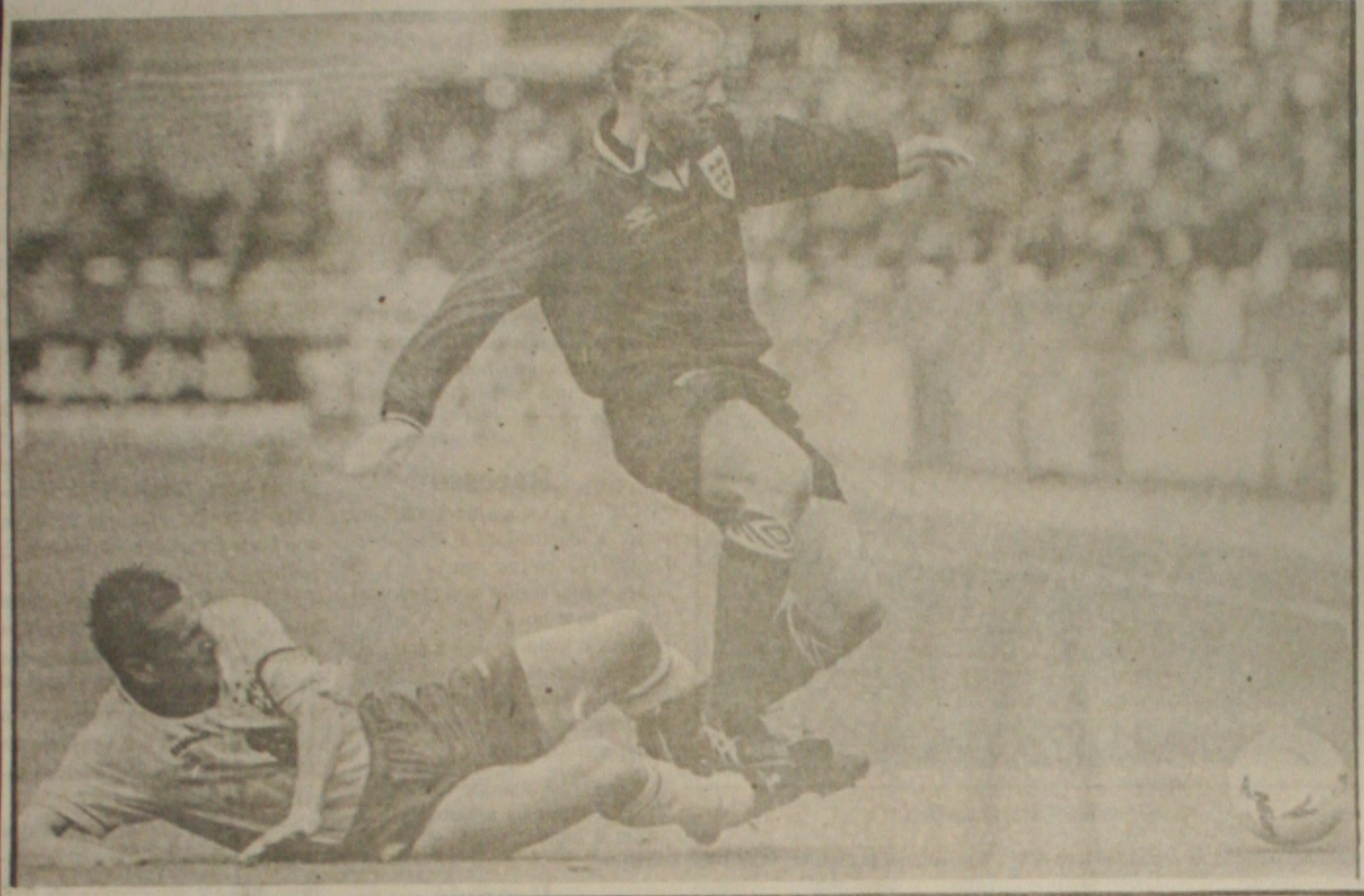
O capitão Dunga, mantém o seu estilo na Seleção.