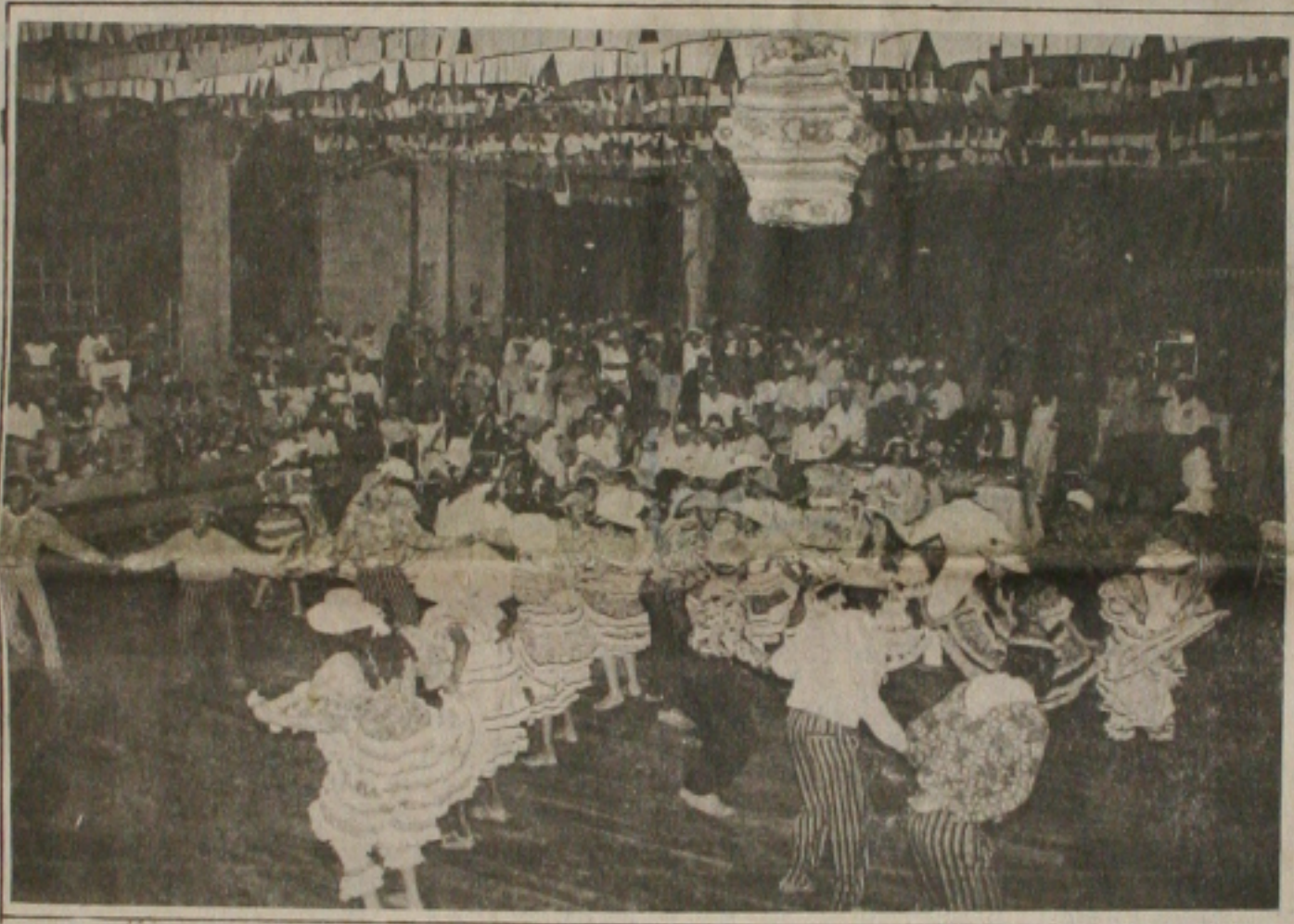
Os festejos juninos chegam ao fim, mantendo muitas tradições, como a dos concursos de quadrilhas matutas

Ainda não bem curados da ressaca de um dos maiores São João de todos os tempos, sergipanos e turistas voltaram a "ariar a fivela" nas comemorações ao dia de São Pedro, o último santo festejado em junho e que encerra uma programação de sucesso em todo o Estado, principalmente em municípios de maior tradição nos festejos do mês, a exemplo de Aracaju, Areia Branca, Estância, Murbeca e Capela. Até o próximo dia 2, quem ainda dispuser de fôlego poderá desfrutar de shows com atrações locais e regionais. (Página 5A)