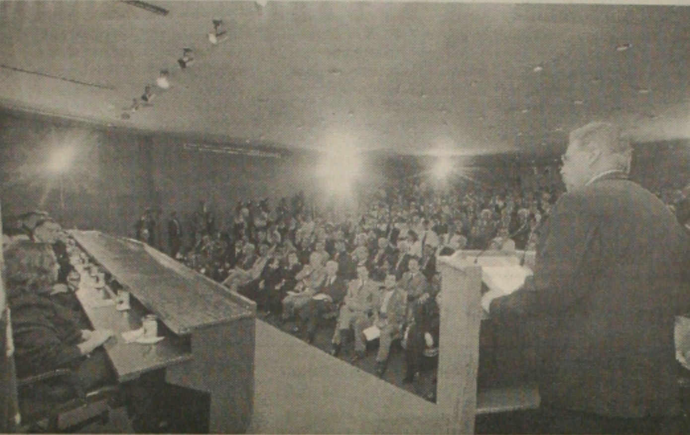
Durante o discurso na OAB/DF, prometeu acelerar uma nova reforma política no País, para possibilitar o parlamentarismo. (Página 8A)

Opositores da privatização da Telebrás estão discutindo a apresentação de ações à Justiça para evitar a liquidação da venda da estatal, marcada para o próximo dia 4. Com o bloqueio do pagamento, a oposição espera conseguir na Justiça a anulação do leilão. De acordo com o deputado federal Walter Pinheiro (PT-BA), a oposição deverá questionar, entre outros aspectos, "o fato de o leilão ter sido iniciado mesmo com a existência de duas liminares impedindo sua realização". Pinheiro disse que a oposição fará um levantamento detalhado sobre os horários de comunicação das liminares e de suas respectivas cassações. O leilão que passou a Telebrás para a iniciativa privada começou às 10 horas de quarta-feira (29). O Tribunal Regional Federal (TRF) da 1ª Região, em Brasília, recebeu o pedido de cassação às 9h50 e deu sua última decisão por volta das 10h40, de acordo com a assessoria de imprensa do tribunal. Ontem, o presidente Fernando Henrique Cardoso recuou de sua posição de utilizar parte das receitas obtidas com a venda da Telebrás para investir na área social. Prevaleceu a posição da equipe econômica, de utilizar todo o dinheiro para abater a dívida pública. (Página 8A)