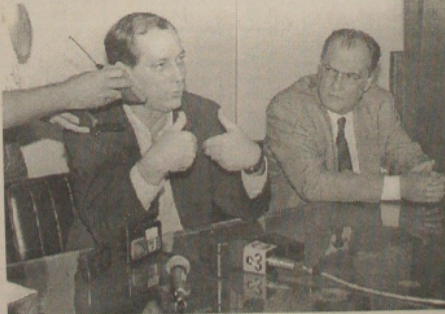
Ciro: a aliança com o PSDB local embora adversário de FHC

"Recebemos as rodovias em péssimas condições. Iniciada há 14 anos, a estrada ligando Ribeirópolis a Nossa Senhora das Dores só foi concluída agora". (Do governador Albano Franco (PSDB), ao revelar que em 95, quando assumiu o governo, a malha rodoviária do Estado estava em situação lastimável. GAZETA - 30/07)