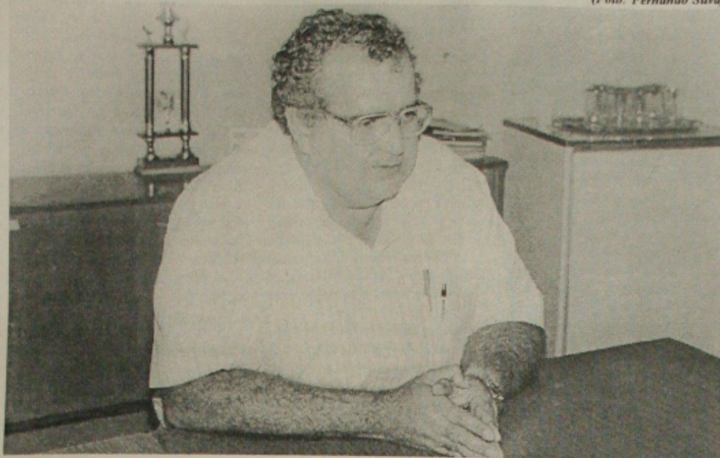
Andrade diz que o INCRA está ajuizando ações para a desapropriação de áreas para assentamentos

A expectativa é muito grande e existem novidades este ano para as inscrições dos animais, podendo os criadores receberem as informações junto à Emdagro, quando do ato de inscrição, concluiu o secretário.