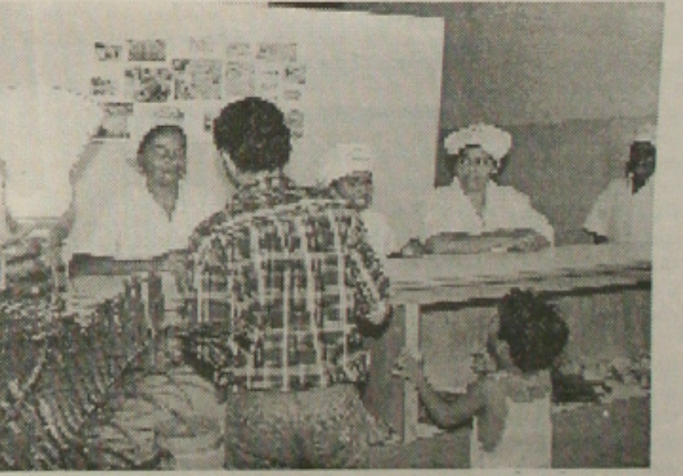
A fábrica de bolos Vida Nova, do Bairro Japãozinho, já está em pleno funcionamento com o Proger.