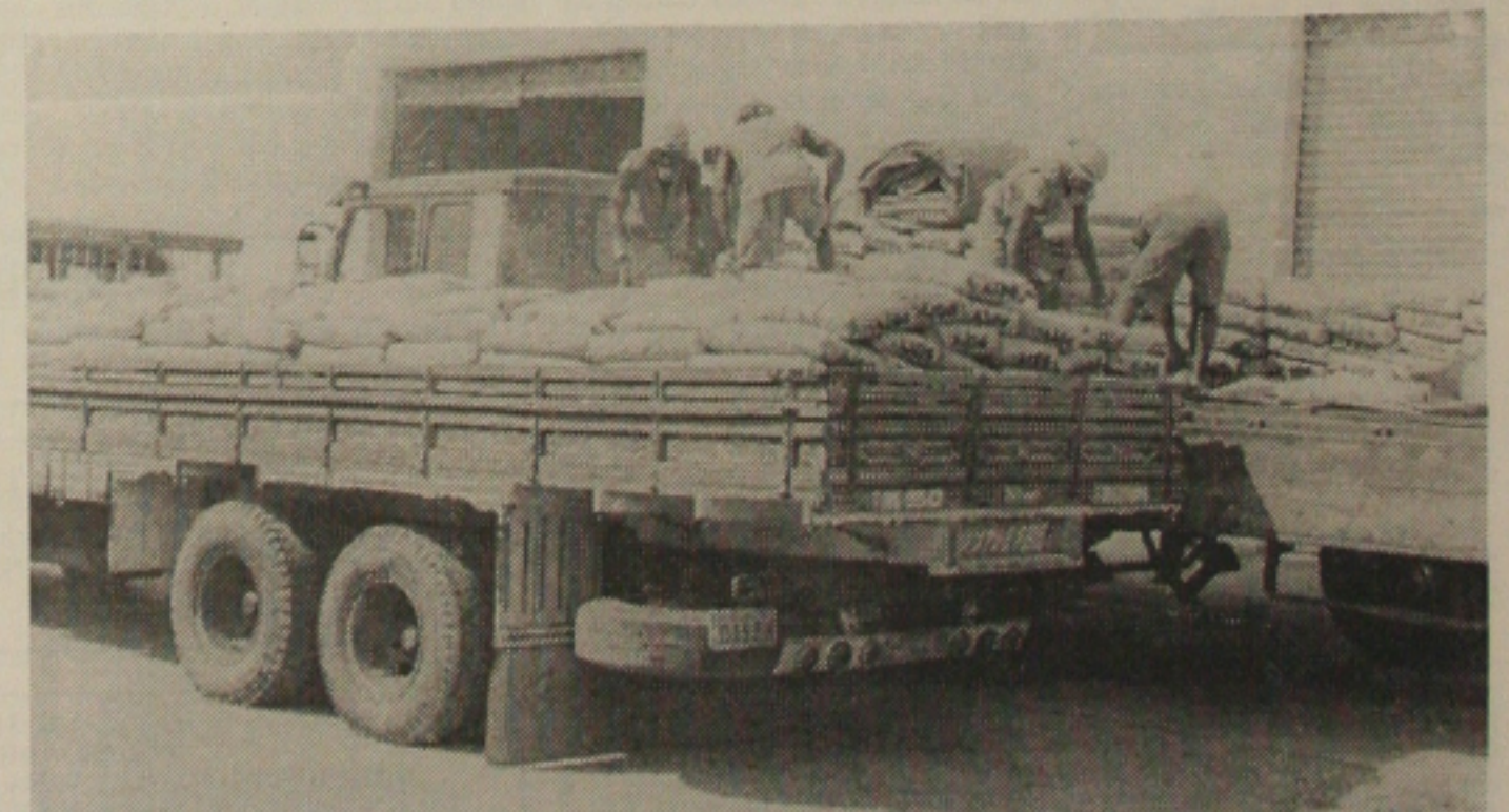
A produção de cimento triplicou na unidade industrial da Votorantim, em Laranjeiras

A empresa é parceira do Instituto do Patrimônio Histórico e Artístico Nacional (IPHAN), na restauração e manutenção de diversos monumentos históricos do município. Dentro dos limites da própria Cimesa, está a antiga Fazenda Retiro, que preserva construções, igrejas, casa grande e senzala, datadas do século XVIII.