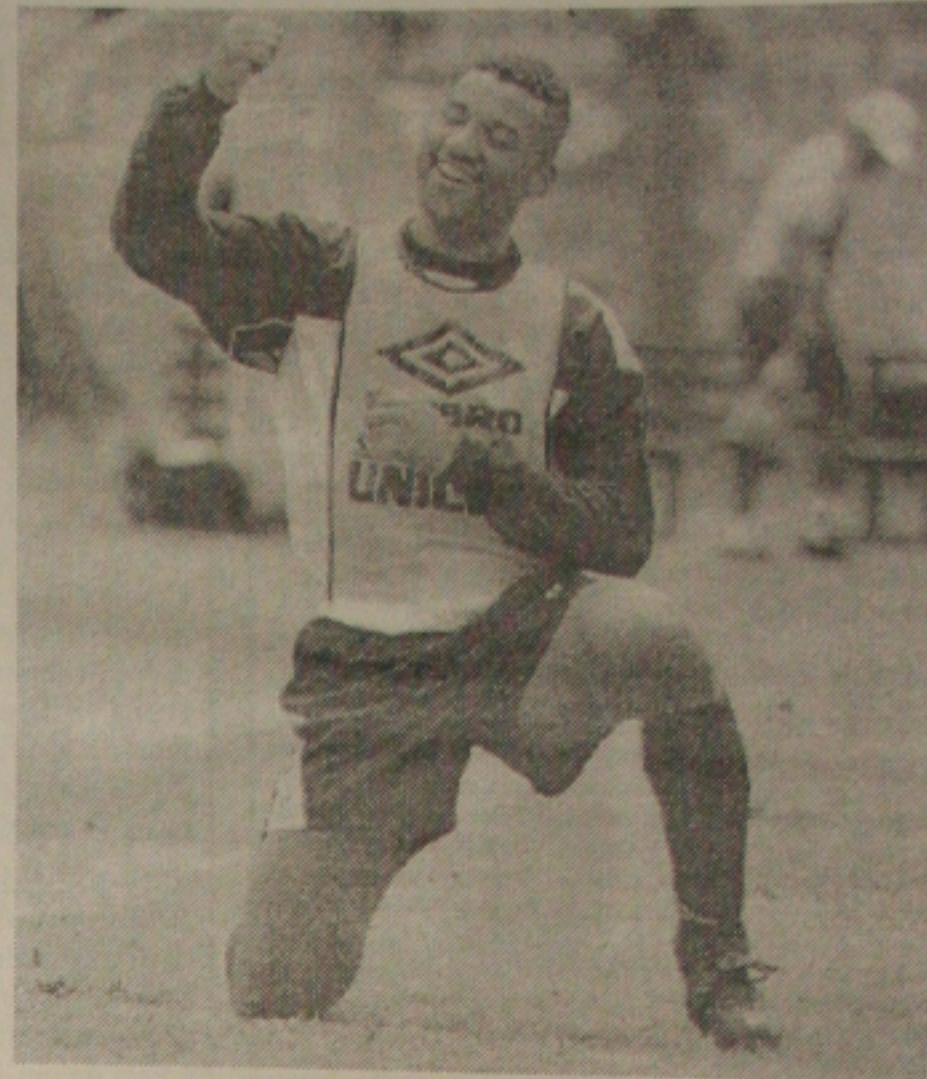
Artilheiro do Santos, Viola continua em alta

As mudanças não têm afetado apenas a vida dos clubes. O concurso 250 da loteria esportiva teve a data de apuração adiada para a sexta-feira, dia 13, às 12 horas, como informou, ontem, em Brasília, a Caixa Econômica Federal. As apostas poderão ser efetuadas normalmente até sábado, ao meio-dia. Dos 13 jogos, apenas Milan x Internacional está confirmado para domingo.