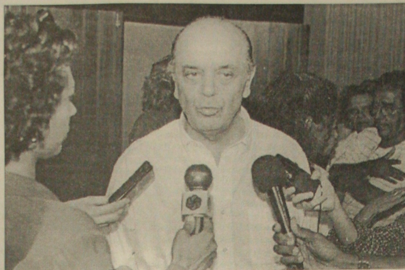
Serra: queda de 12,4% e desvio de fontes tradicionais de financiamento da saúde