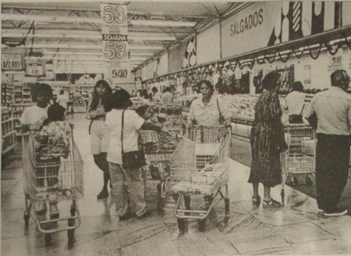
Os supermercados sergipanos recorrem à Justiça para continuar vendendo medicamentos