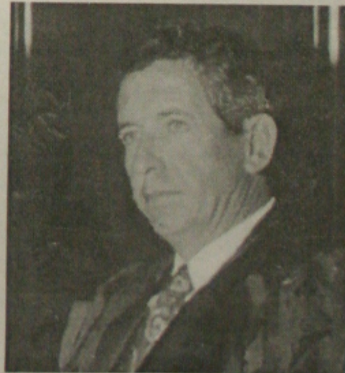
Moacyr Soares da Mota, o novo procurador geral da Justiça.

A Pró-Vida é um Instituto de Promoção de Estudos e Pesquisas Filosóficas, mas que também se preocupa com o lado prático da vida. Por isso, seus alunos, em Aracaju, estarão promovendo uma solenidade de doação para 55 entidades filantrópicas do nordeste, duas delas em Sergipe. Será no dia 14 de novembro, às 16h, no late Clube de Aracaju.