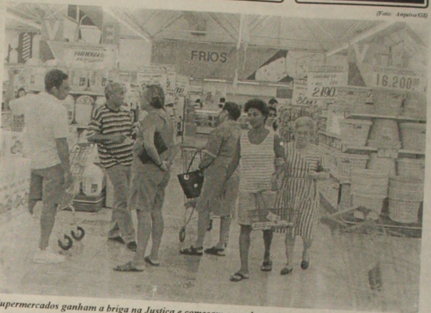
Supermercados ganham a briga na Justiça e começam a vender medicamentos

mesmo período no ano passado. Para ele não há o que comemorar diante da situação enfrentada pelos empresários no resto do País. Ele afirmou ainda que as medidas econômicas anunciadas pelo presidente Fernando Henrique Cardoso (PSDB) somente serão sentidas pelos brasileiros a partir do ano que vem. "O pior é o desemprego", afirmou. A Ases pretende inaugurar a nova sede da entidade no dia 24 de novembro. A entrega da obra seria no dia 12, dia Nacional do Supermercado, mas a solenidade foi transferida (Página 6A).