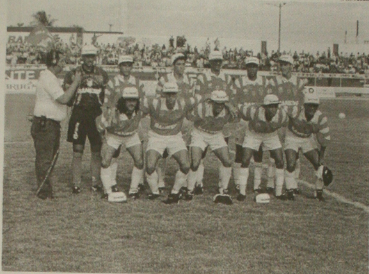
O time do Sergipe, que hoje enfrenta a Ponte Preta no Moisés Lucarelli, na luta pela classificação