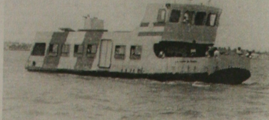
O transporte fluvial terá que ser de qualidade, sob pena de perda da concessão.