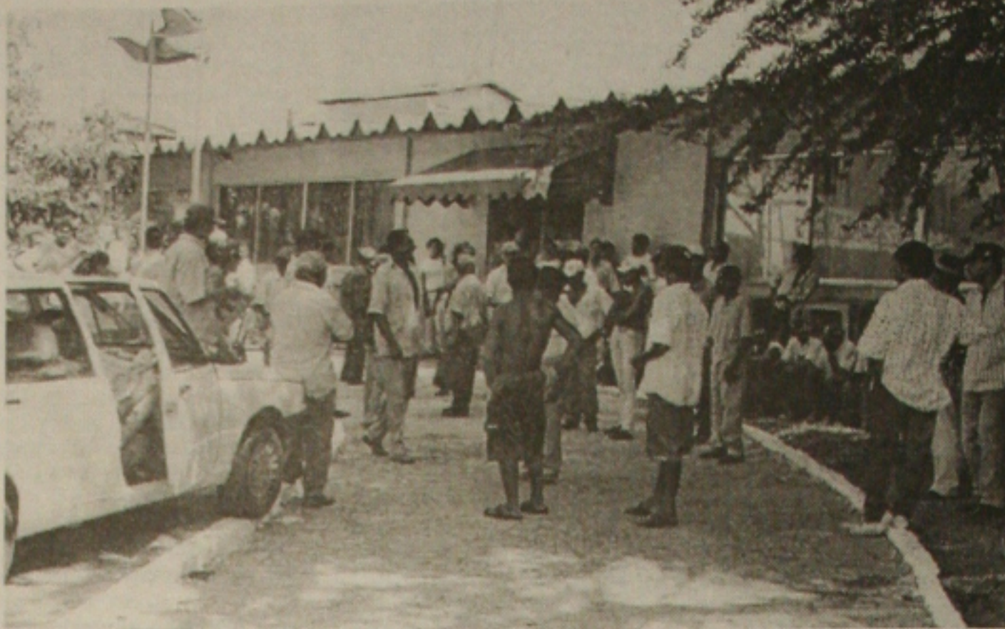
Trabalhadores rurais continuam no Incra e afirmam que só saem depois da liberação do crédito de Brasília