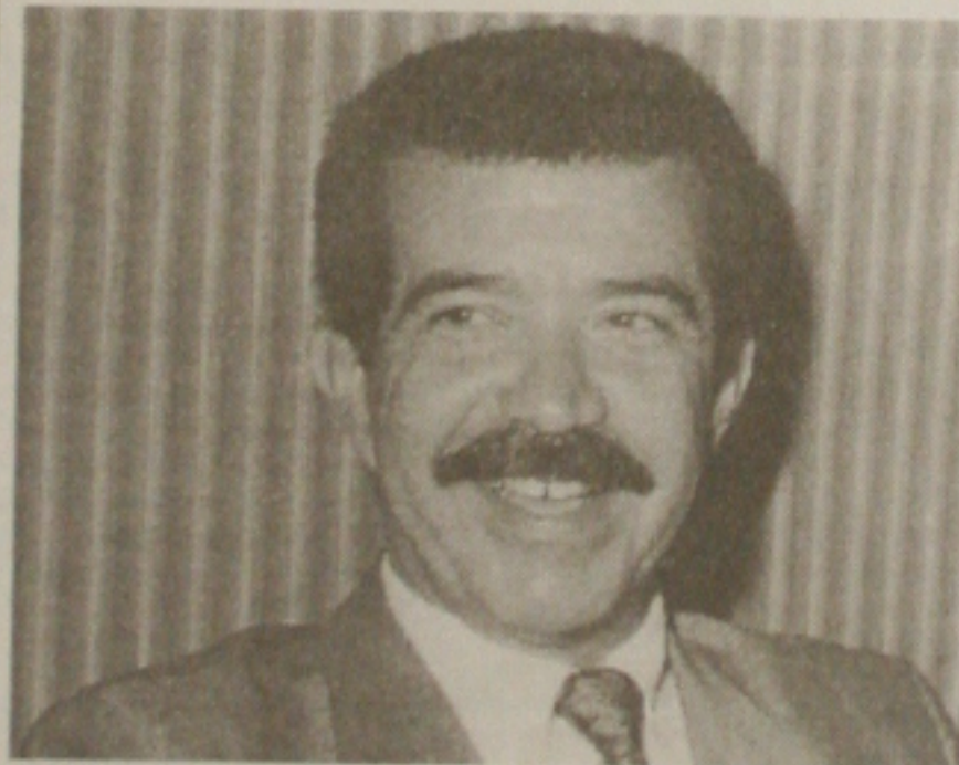
Reinaldo Moura, Presidente da Assembleia Legislativa