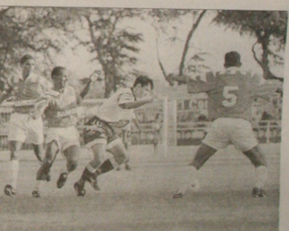
Sergipe busca hoje mais uma vitória contra a Ponte