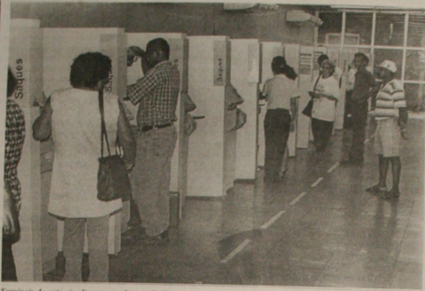
Terminais de auto-atendimento nos bancos facilitam a vida do cliente, mas aumentam o número de golpes. (Página 5A)

Alunos da rede estadual não farão vestibular. (Página 4A).