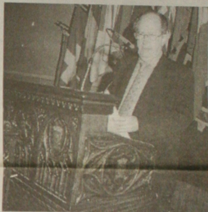
O Governador Albano Franco vai reunir governadores de outros estados aqui em Aracaju

Na Comissão de Finanças e Tributação da Câmara dos Deputados está tramitando um projeto que solicita a inclusão das empresas prestadoras de serviço no Simples. Empresas como clínicas médicas, escolas, corretoras de seguros e até casas lotéricas poderiam ser incluídas ainda durante este ano. Resta saber, depois de feitas as contas, se o Simples vai trazer alguma vantagem para elas.