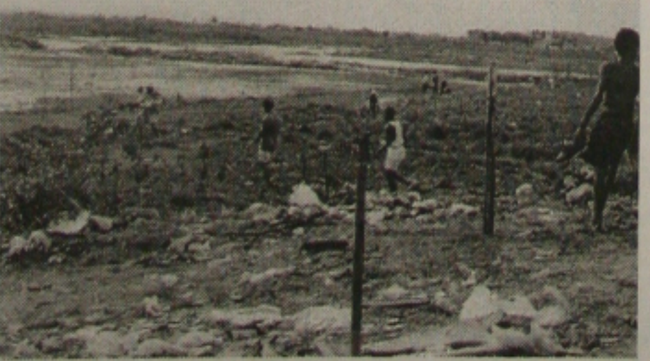
Invasores sem-teto não desistem e lutam para permanecer no terreno do Lamarão

Os sem-teto estão organizados e prontos para resistência. Conforme informações de Santos, pessoas dizendo-se proprietárias da área têm aparecido, mas que não os têm intimidado. "Vimos para ficar".