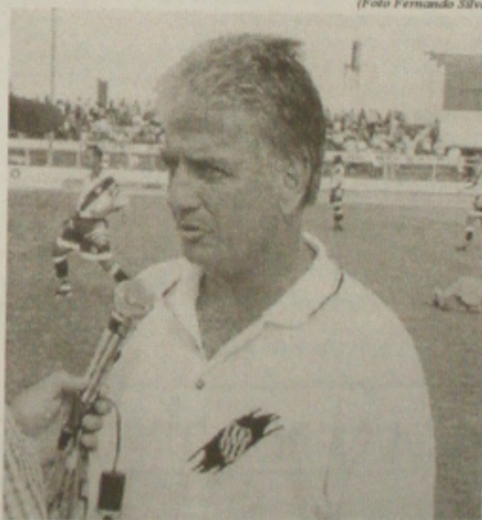
O técnico da Ponte Preta acha difícil, mas acredita na classificação