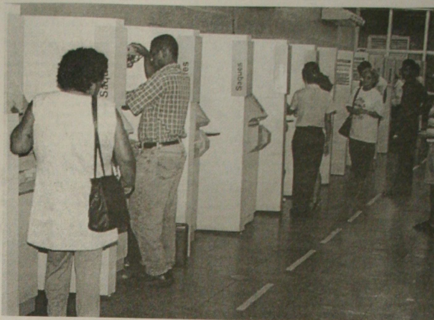
Clientes e correntistas podem ser lesados ao utilizar serviço de auto-atendimento

O sindicalista ressaltou que o auto-atendimento está voltado para os clientes dos bancos, mas que ainda existe uma parcela de pessoas que não é e que, portanto, se utiliza dos guichês (caixas) para efetuar pagamentos e outros serviços.