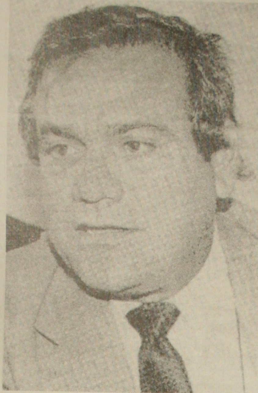
Lessa admite que terá que demitir 5 mil servidores

O ABN-Amro reduziu a taxa máxima do cheque especial de 10,7% para 9,9%, mantendo em 6% a taxa mínima. Os juros de outros segmentos de crédito não foram alterados.