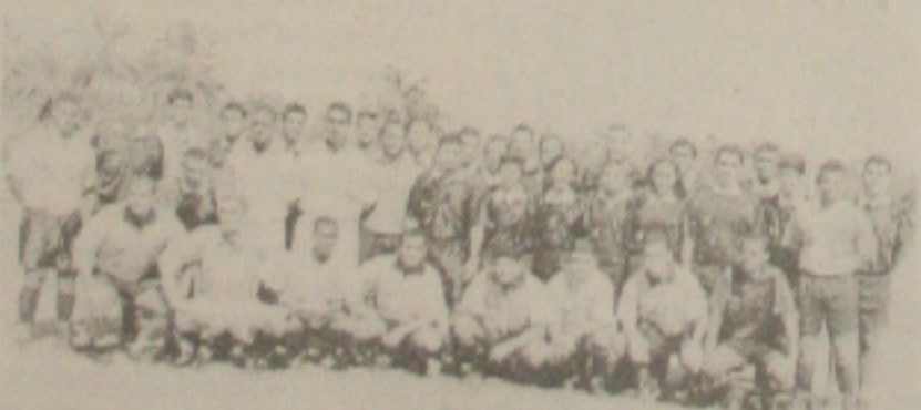
A nova safra de árbitros representa o trabalho de renovação