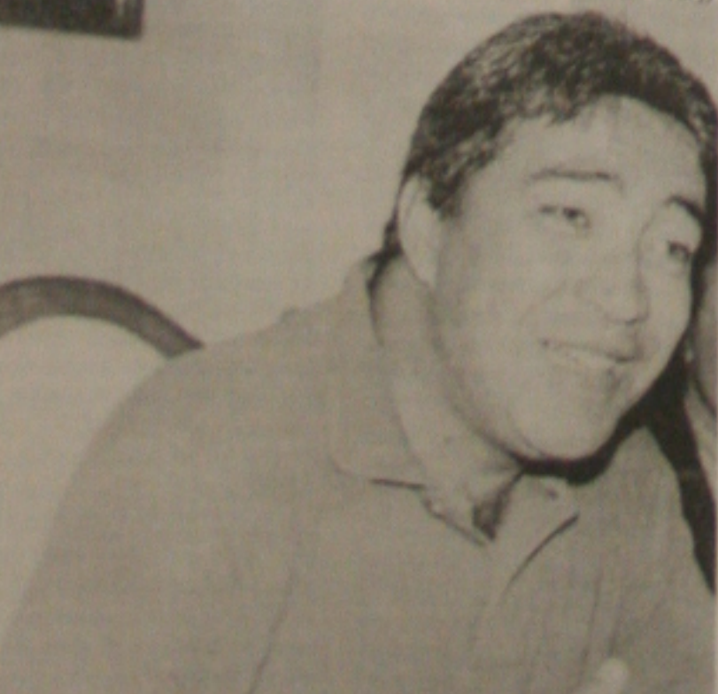
Deputado federal Marcelo Déda