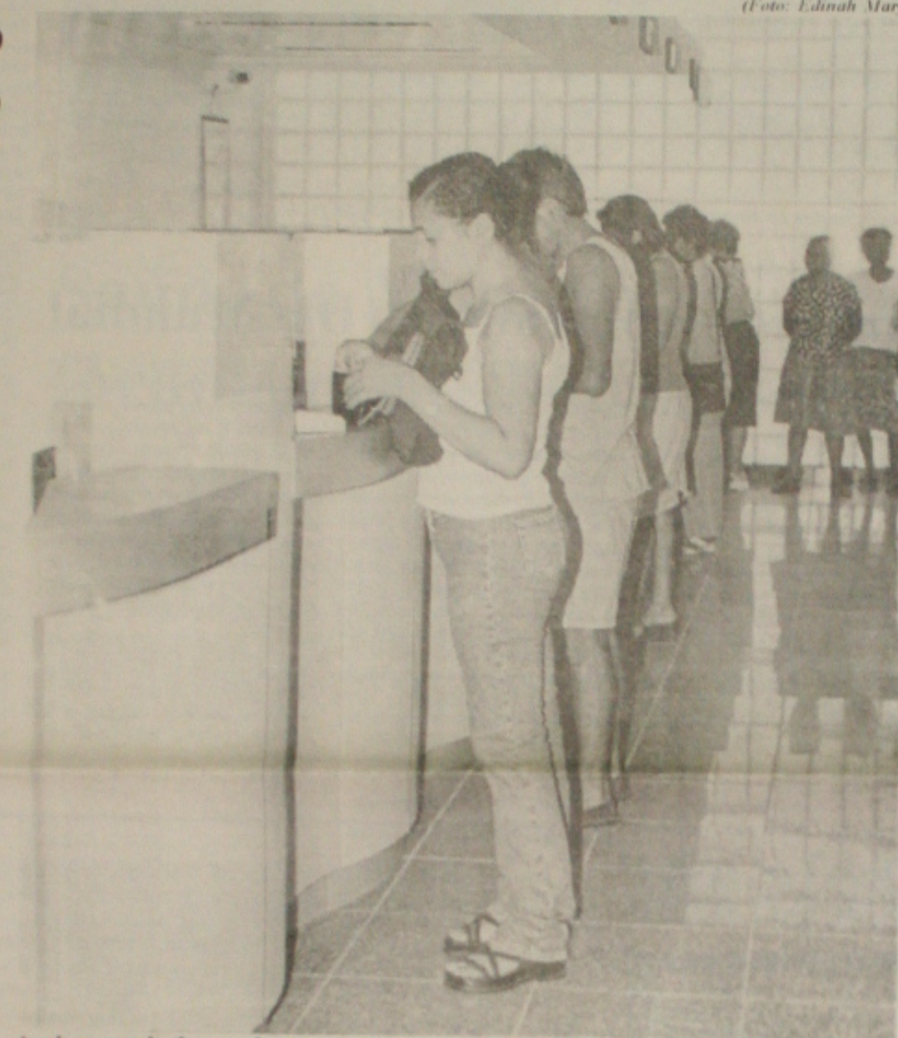
A cobrança pelos bancos de taxa pelo cheque inferior a R$ 20,00 tem sido motivo de reclamação

O Centro de Criatividade, que é administrado pela Secretaria Estadual de Cultura, está com uma vasta programação de cursos e oficinas aberta para toda a população sergipana, interessada em manter viva a cultura nordestina de teatro de boneco,