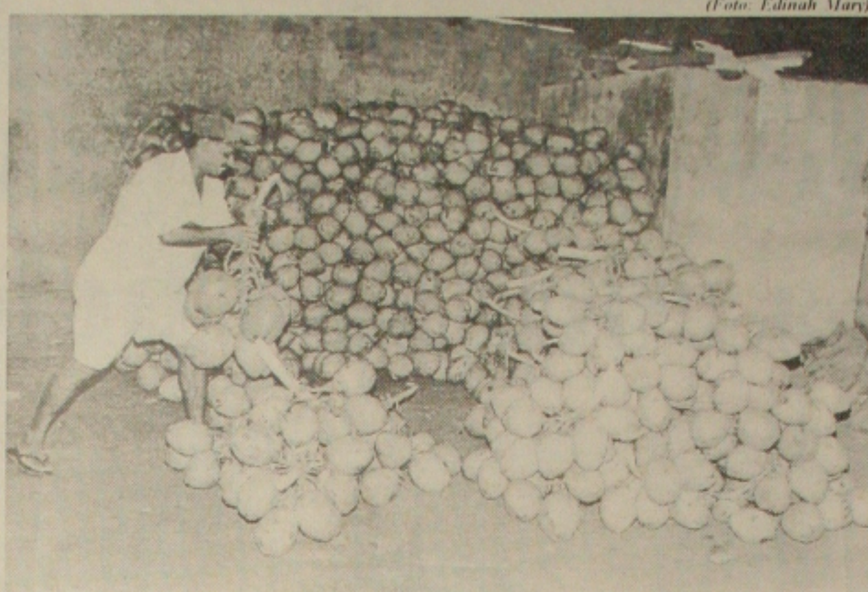
Comerciantes reclamam da concorrência desleal dos vendedores de coco ao lado da Ceasa

"O cliente sequer entra no mercado, mas compra logo o coco fora"