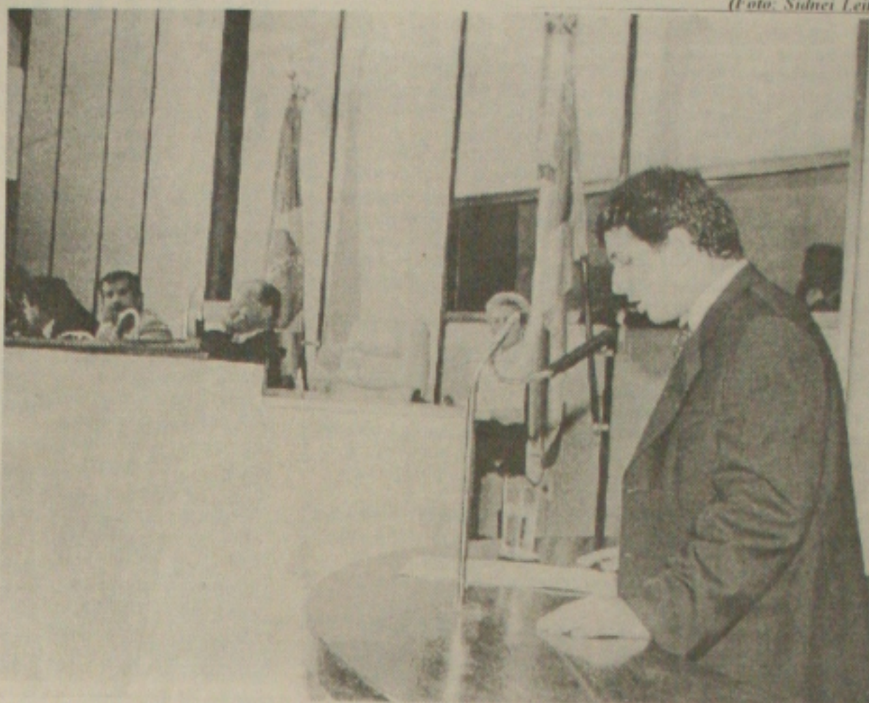
Deputado Marcos Franco faz pronunciamento duro contra governo

"Vou passar a ser um cobrador rigoroso para que o governo retome o seu caminho de honrar seu programa, dotando o Estado das condições concretas de desenvolvimento, sem desculpas de falta de dinheiro, sem protelatórios, sem enrolação. Não tratar, como foi tratado", garante.