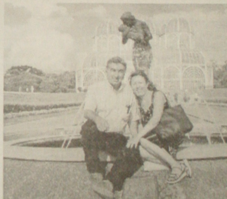
Casal Amárizo Flávio Monteiro no Jardim Botânico da tremendamente bela Curitiba.

Logo mais às 15 horas, será aberto o 5º Workshop MDM e o 4º MDM Fest, em Salvador, eventos comandados por Marcos Almeida, sergipano vitorioso na área do turismo brasileiro, que vai reunir no Bahia Othon Valente, agentes de viagem nacionais e internacionais, hotéis e operadoras, com o apoio da rede Orlion, da Varig, de Pousadas do Rio Quente. No dia 21, próxima terça-feira, Marcos encara o 8º Workshop de Aracaju, a partir das 17 horas, no Delmar Hotel, reunindo o trade sergipano e agentes e hotéis de diversos pontos do País, com apoio da Nordeste Varig, Delmar, Pousada do Rio Quente e Bahiatursa. Marcarei presença.