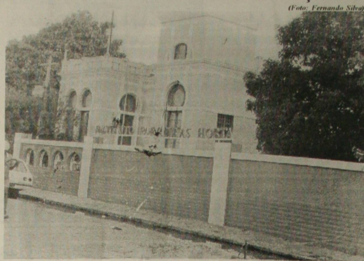
Parreiras Horta realizará curso de biosegurança para conclusão de exames clínicos