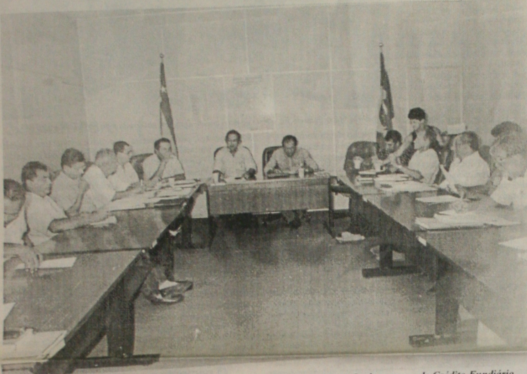
Trabalhadores rurais estiveram reunidos ontem na Fetase para discutir a liberação de recursos do Crédito Fundiário