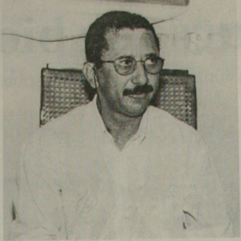
... em Itabaiana com a saída de Israel, para conter a onda de violência...