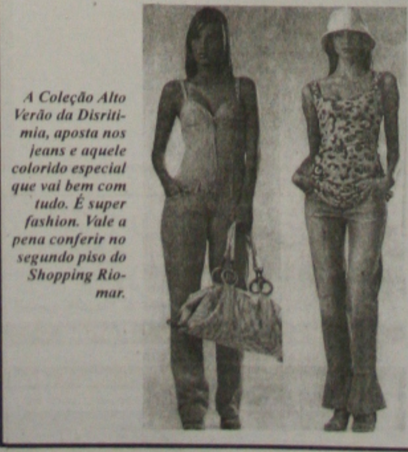
A Coleção Alto Verão da Disritmia, aposta nos jeans e aquele colorido especial que vai bem com tudo. É super fashion. Vale a pena conferir no segundo piso do Shopping Riomar.