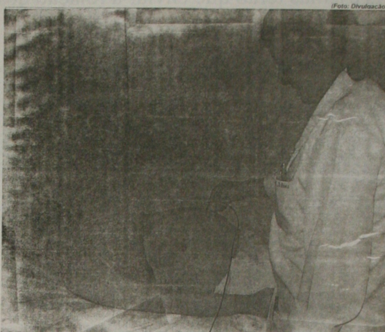
A realização do exame pré-natal é por demais importante para reduzir a mortalidade infantil