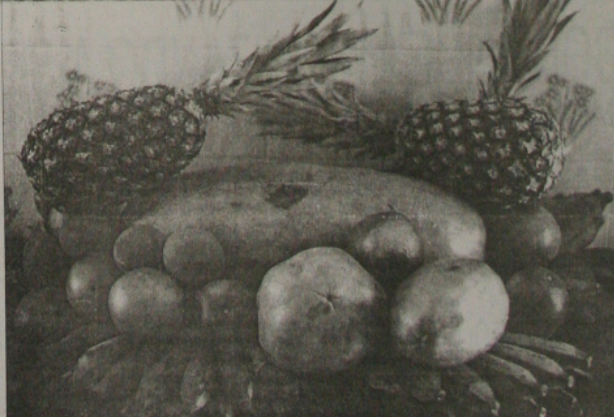
A chegada do verão faz com que as pessoas exagerem na malhação em busca de um emagrecimento rápido e se descuidem de uma alimentação saudável, o que pode provocar doenças graves

Uma alimentação rica em antioxidantes é apontada como o melhor método