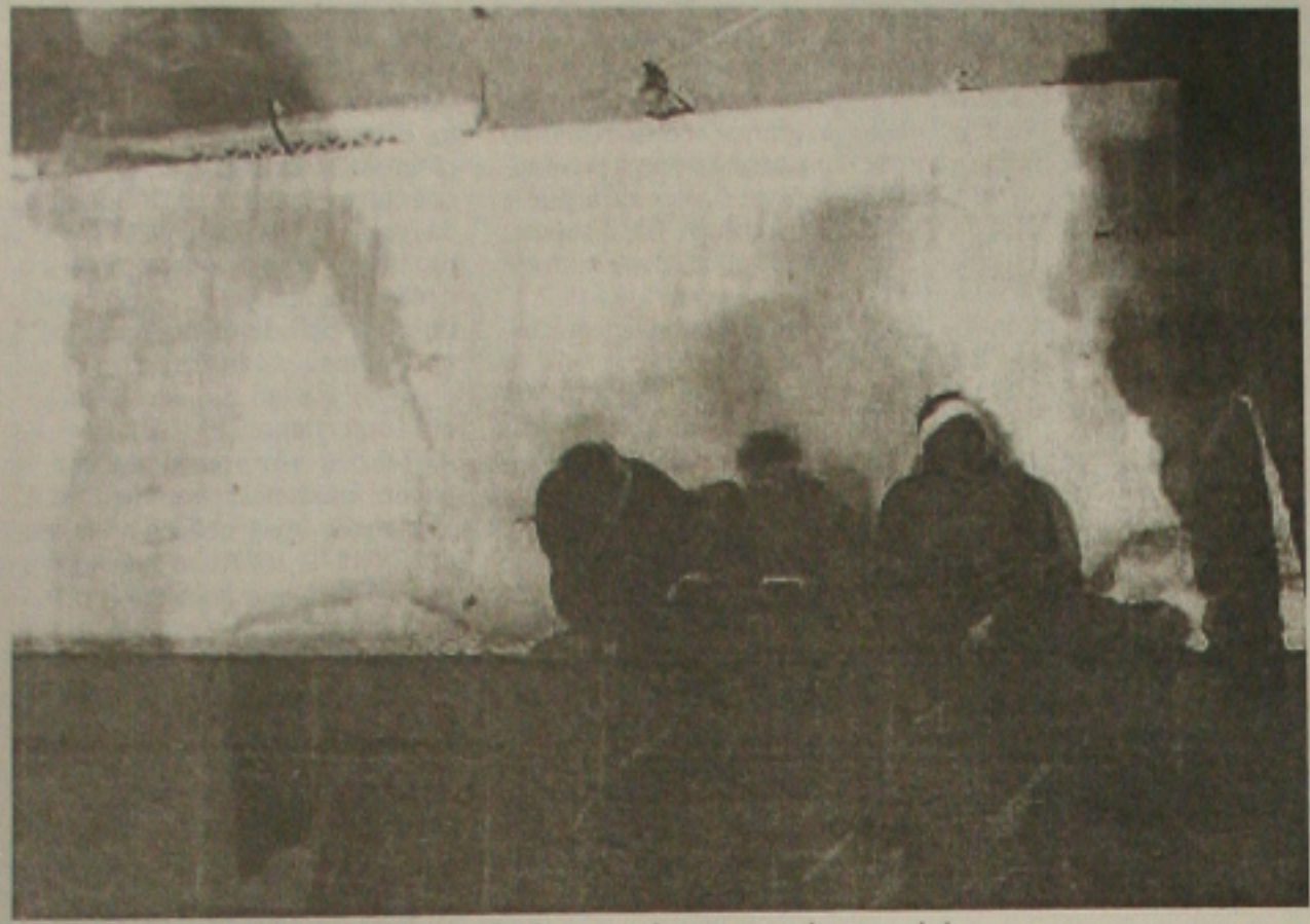
Em todas as cidades do Iraque, exército americano amedronta civis

Militar americano garante que ex-ditador é tratado de acordo com "Convenção de Genebra"