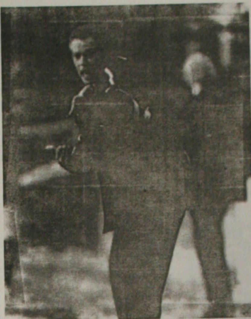
Leão administra os problemas