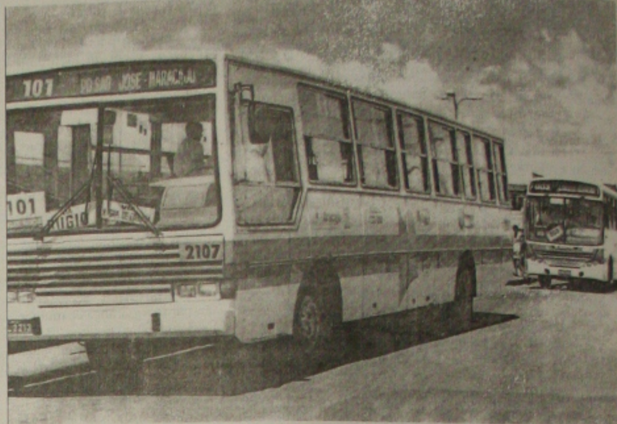
Para ter acesso ao transporte coletivo, o aluno deve estar com a identificação emitida pela SMTT

A gratuidade também é um instituto combatido pelo Setransp e, uma vez que reduz a receita das empresas, causando prejuízos para o município e o trabalhador que não tem esse privilégio, uma vez que ele paga para diversos setores da sociedade não pagarem a tarifa. (CM)