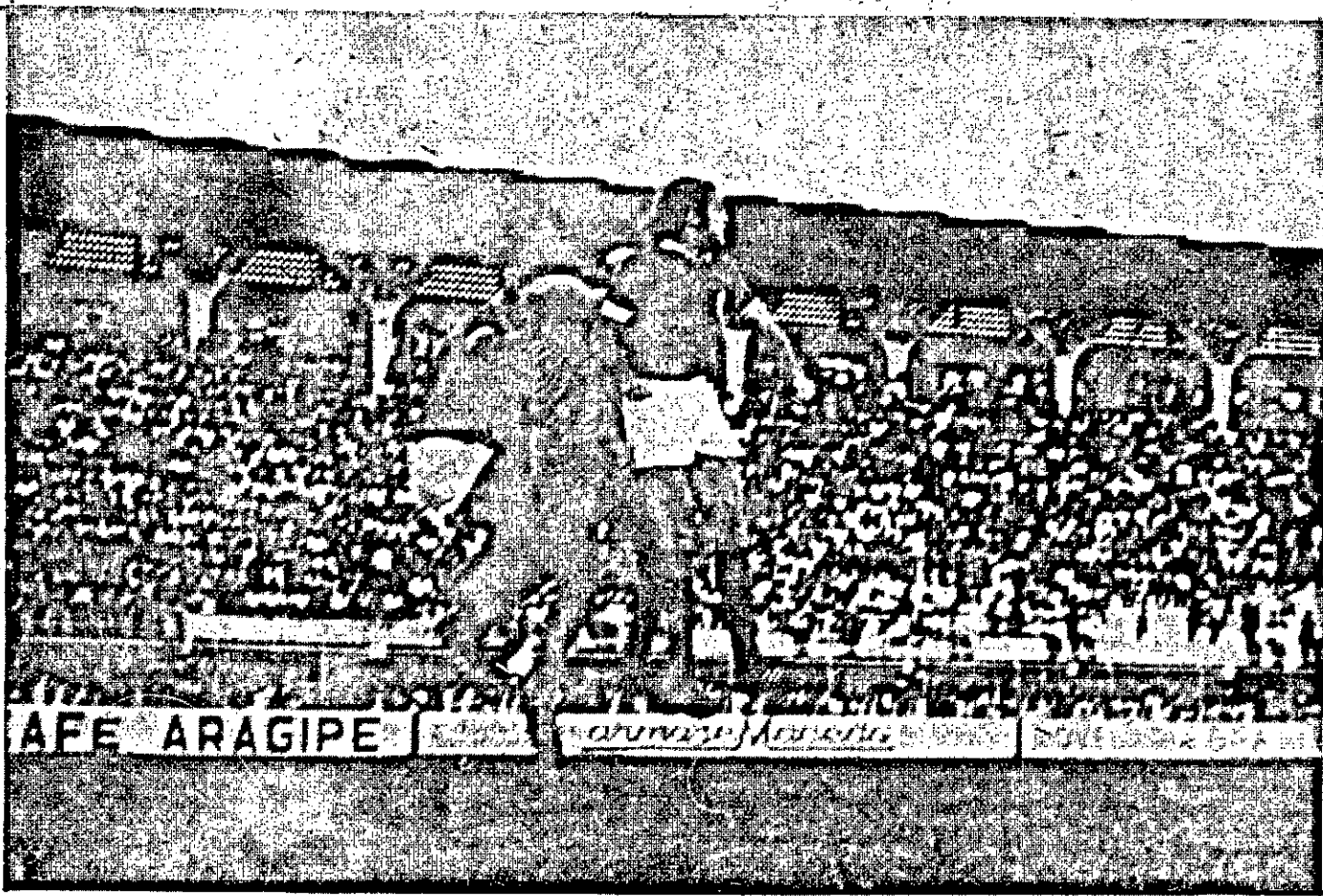
É assim que o povo quer. Um Sergipe valente lá em Curitiba.