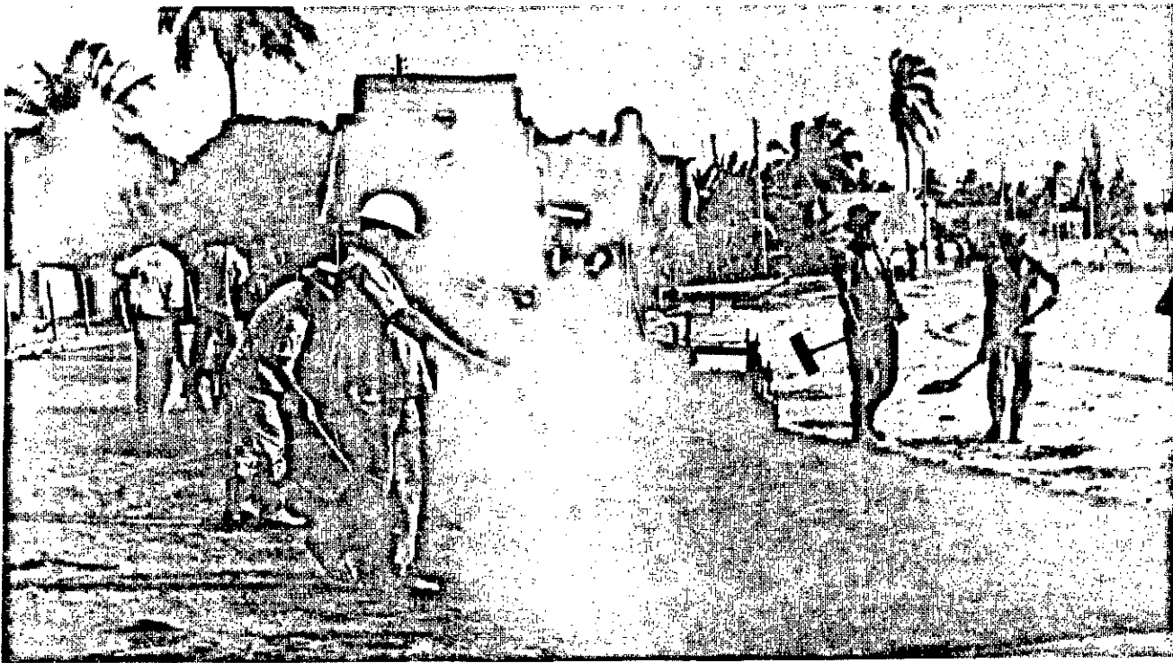
Aspecto dos serviços de asfaltamento da avenida Hermes Fontes.