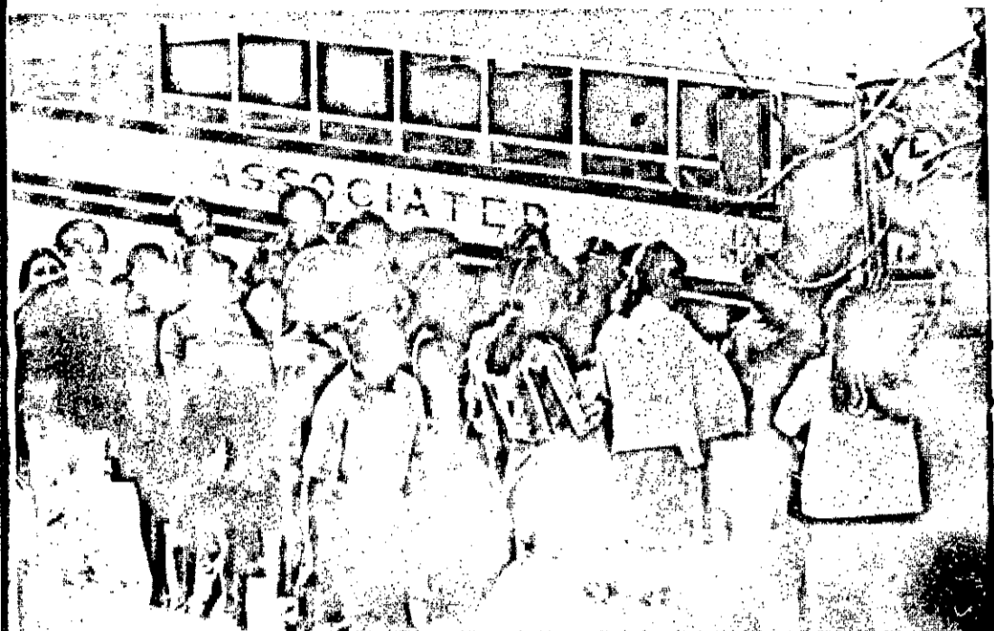
Estudantes secundários de Pasadena, California, têm sido transportados em ônibus, nos últimos 18 meses, a fim de ser alcançado o equilíbrio racial nas

escolas. O "busing", como é denominado este sistema, ainda constitui um assunto controverso nos EUA.