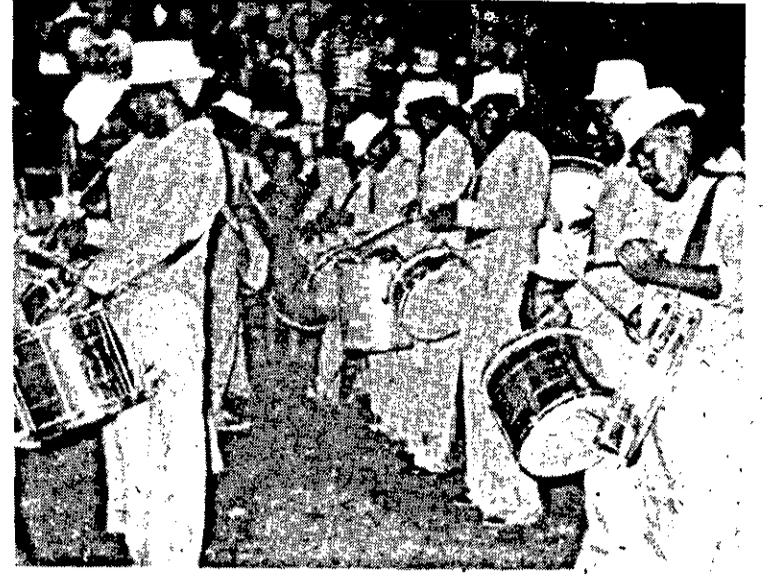
A forte bateria dos Unidos de São José, agradou a todos. Lembrou até um pouquinho, a bateria da Mocidade Independente.