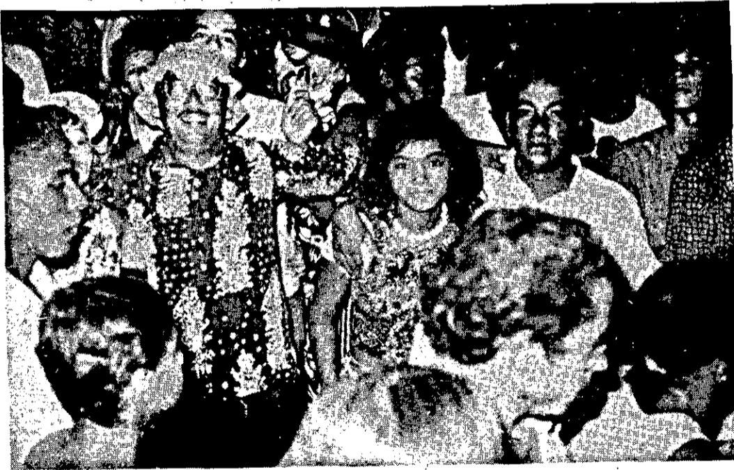
A FUGASE foi outra entidade que vibrou nos quatro dias de Momo.