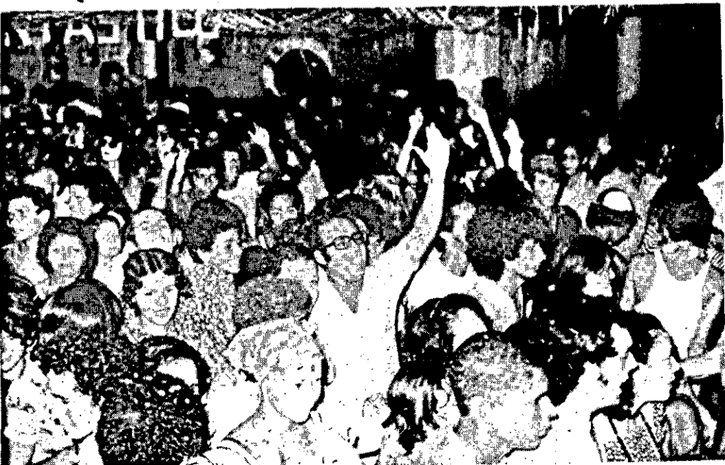
Os bancários souberam brincar seu Carnaval.