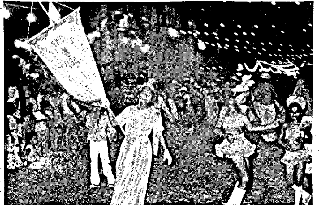
O desfile de blocos carnavalescos, rememorou carnavais passados.