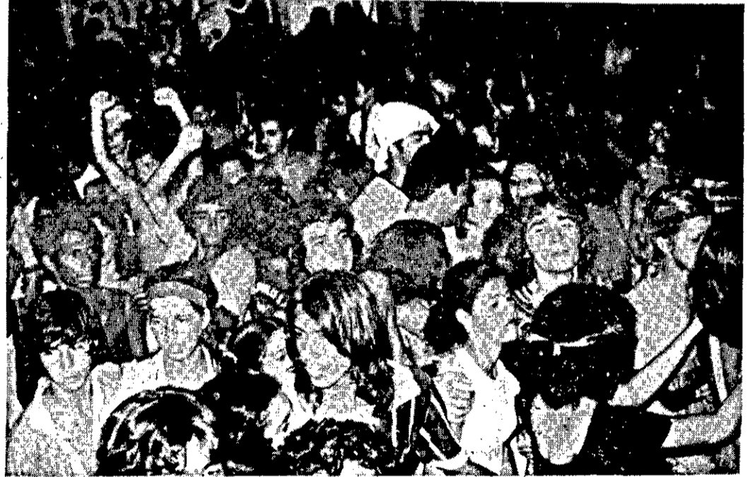
A Associação Atlética, como ocorre todos os anos, foi de grande animação.