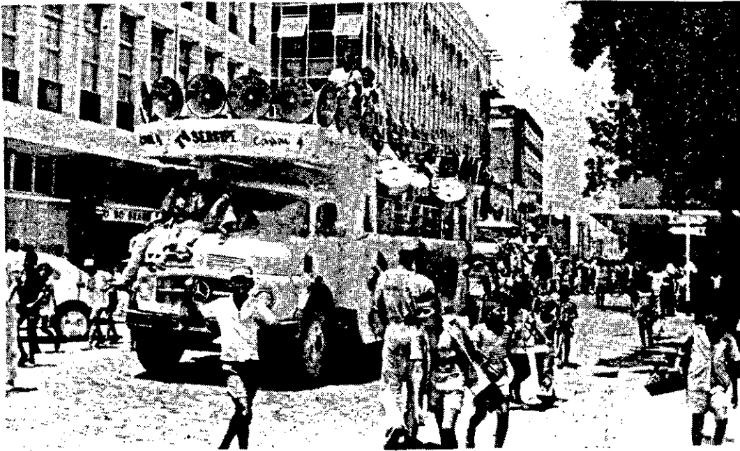
O Trio Elétrico da BOMFIM foi a atração maior do Carnaval

Os tradicionais desfiles de Escolas de Samba ocorreram domingo passado na Praça Fausto Cardoso. A pobreza das fantasias somente contrastou com a alegria contagiante dos participantes das escolas. Muita garra, disposição, o ritmo quente do samba e do frevo contagiou a todos os que presenciaram os desfiles. Seis escolas desfilaram alcançando classificação Acadêmicos do Samba, Batuqueiros do Morro, Império Serrano, e ainda Império do Morro. O ponto alto do carnaval, sem sombra de dúvidas, foi o Trio Elétrico da BOMFIM que durante os quatro dias, percorreu as ruas de nossa capital e ainda teve tempo de visitar as principais cidades do interior. A animação maior foi nos clubes com orquestras se revezando não permitindo intervalos entre as músicas. O samba, o frevo, tudo ficou para trás, restando agora a lembrança dos bons momentos. (Matérias nas páginas 7 e 8.).