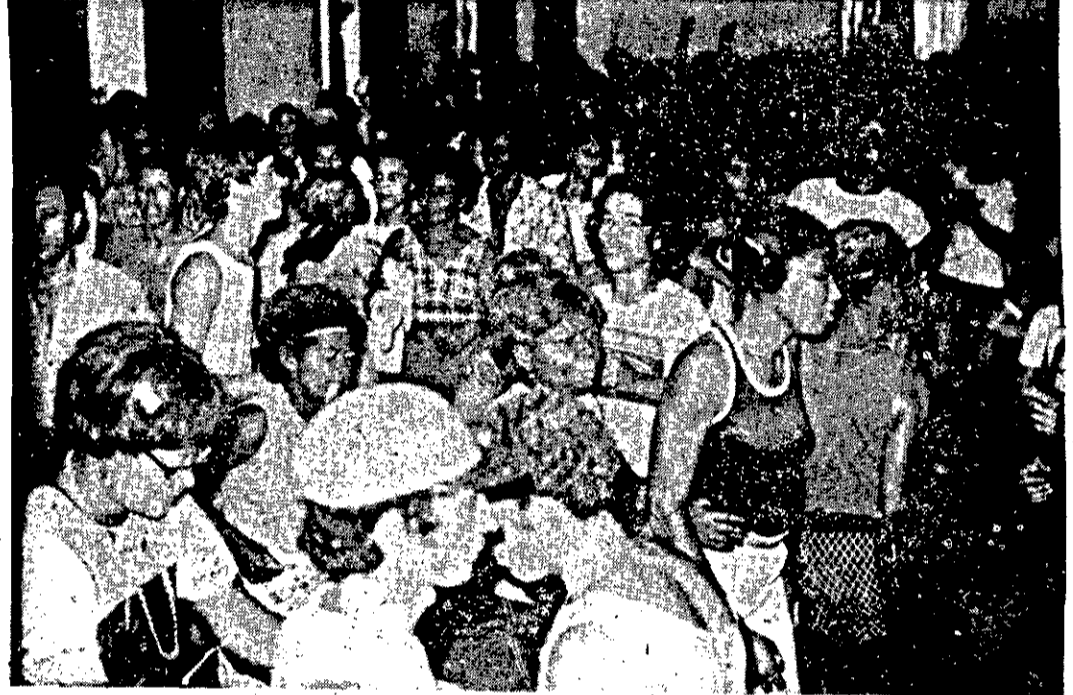
O Vasco teve um Carnaval muito animado.