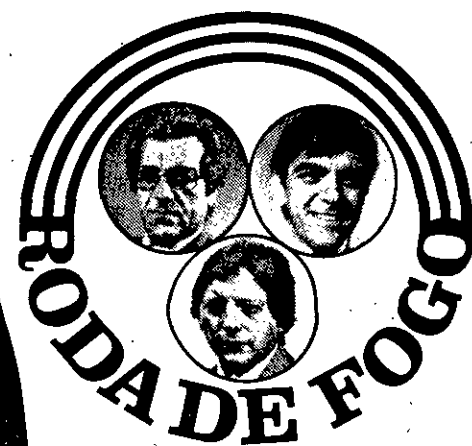
Eduardo - Rolando Boldrin Bento - Francisco Milani Edmundo - Fulvio Stefanini