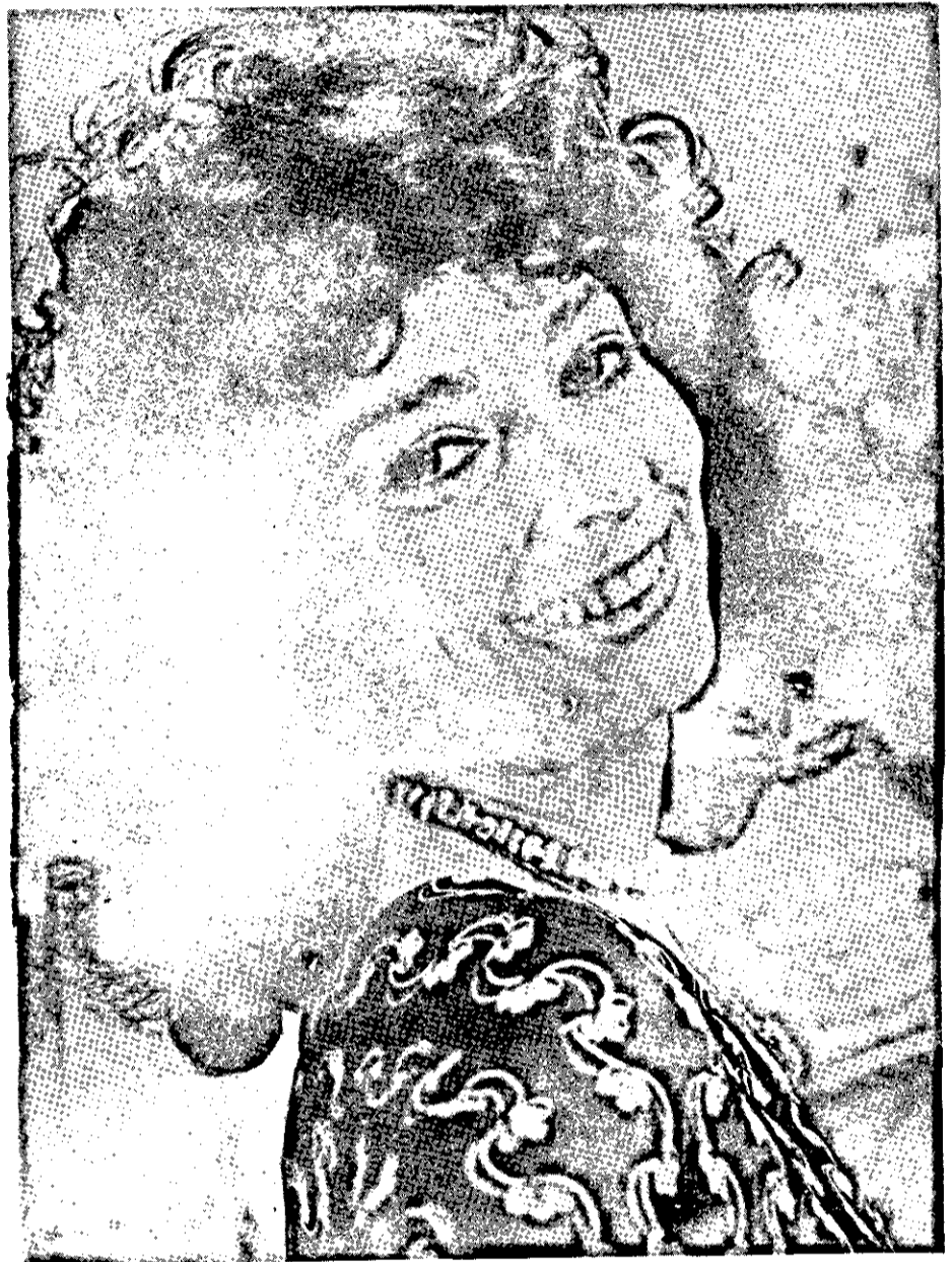
A beleza e o charme de MARIA DO ROCCIO uma das estrelas mais fulgurantes da televisão brasileira.

O espírito que até hoje guiou o Seminário Internacional de Violão está identificado com os mais altos ideais da cultura e o aperfeiçoamento do homem através da educação musical e especificamente do violão. Seu objetivo fundamental sempre foi dar a juventude um entusiasmo maior no estudo do instrumento, uma série de elementos técnicos, científicos, artísticos e humanos que lhes permita aumentar suas possibilidades musicais em todos os níveis.