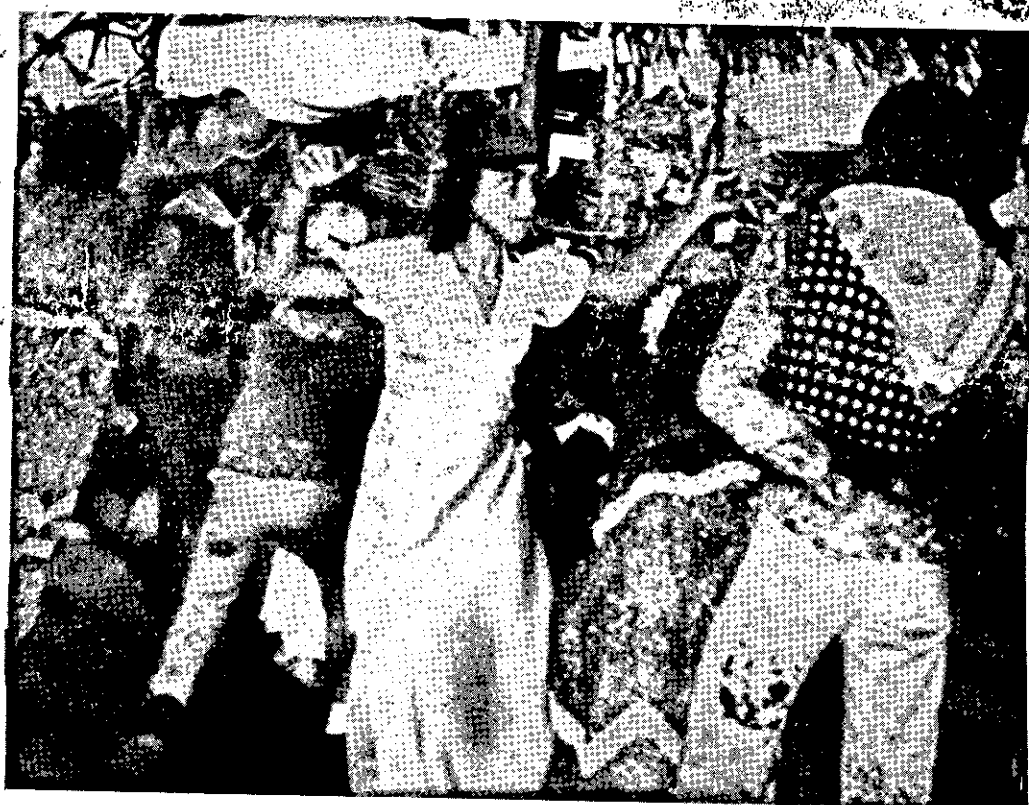
ciclo das chamadas festas juninas, que em Sergipe, como todos os anos, teve a maior animação na Cidade de Estancia, que ainda conserva a tradição dos fogos de artifícios e de explosão viva. A sua famosa "batalha de busca-pés" sempre consegue grande participação, inclusive de visitantes de Aracaju.