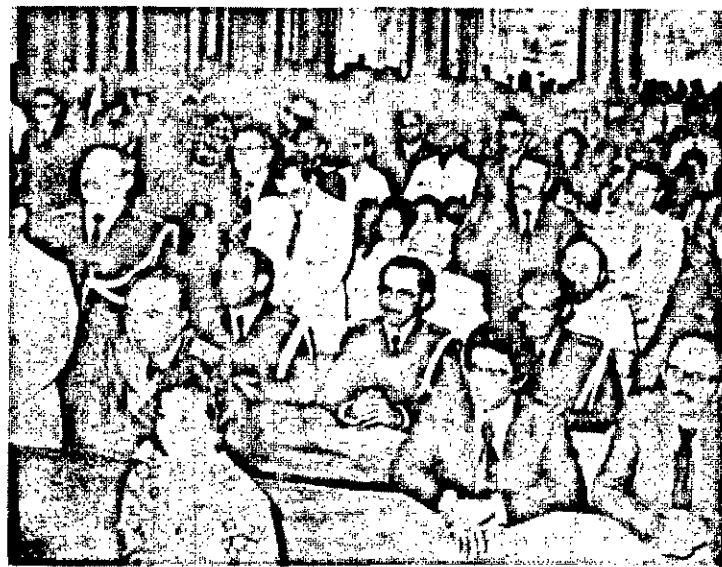
Autoridades federais, estaduais e municipais, além de grande número de amigos e correligionários, foram a Catedral assistir a missa em Ação de Graças pelo aniversário do governador.