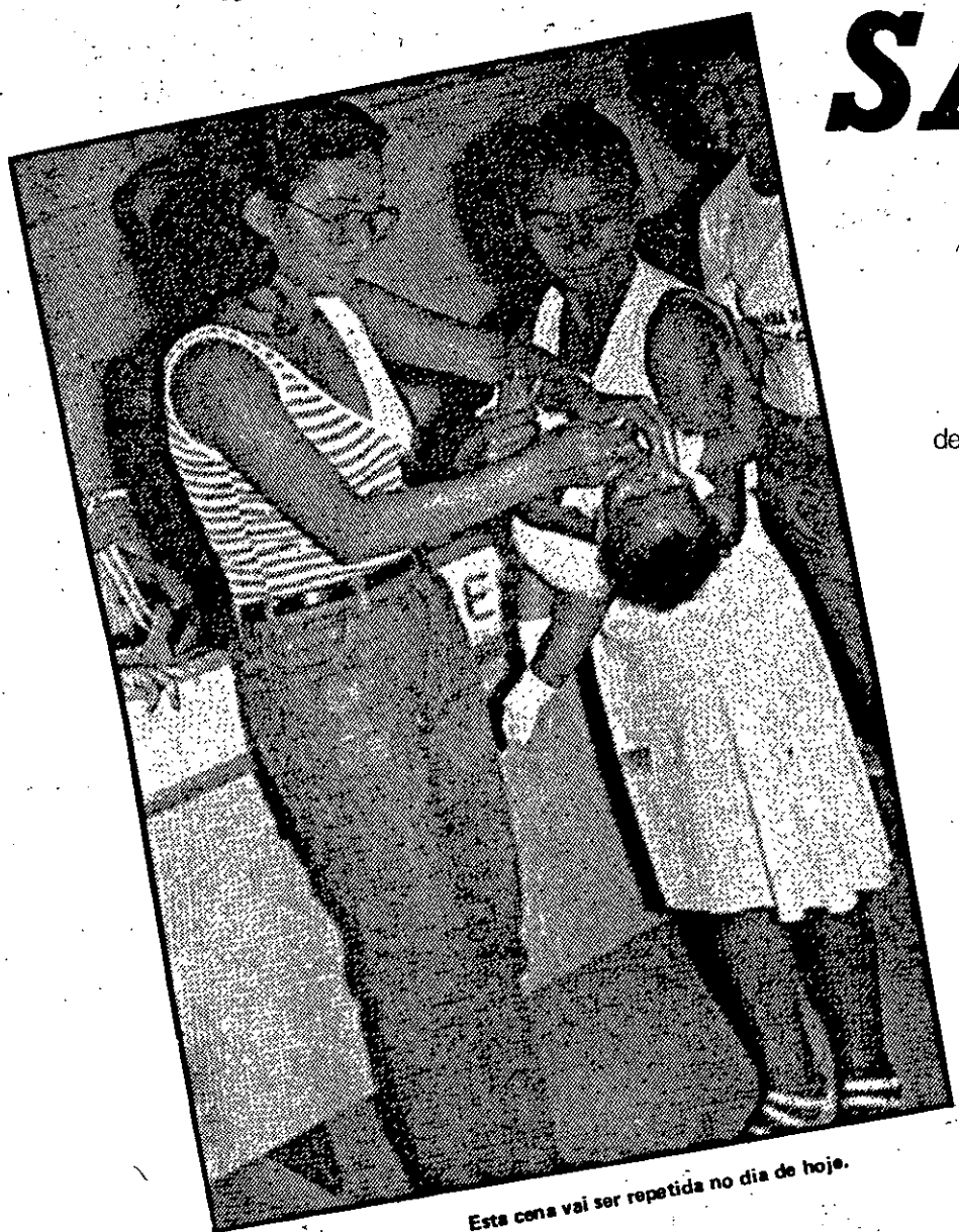
Esta cena vai ser repetida no dia de hoje.

Inscrições para o concurso público que preencherá 50 vagas para o cargo de Datilógrafos, serão abertas no próximo dia 20, na Secretaria de Estado da Administração. No ato da inscrição, o candidato deverá comprovar que concluiu o primeiro grau, ter idade mínima de 18 anos e máxima de 50, além de pagar a taxa de 3 mil 445 cruzeiros e apresentar documentos comprobatórios de que está em dia com as obrigações militares e eleitorais. (Pág. 3)