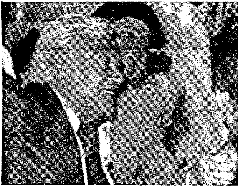
Brasília (EBN) - O Ministro Mário Andreazza e o Governador Divaldo Suruagy recebem, no Centro de Convenções de Brasília, as credenciais para participarem da votação na convenção do PDS.

O presidente do PDS, ex-Governador de Sergipe e Deputado Federal Augusto Franco, instalará hoje, às 8h30min, em Brasília, a Convenção Nacional do Partido, cabendo ao líder do Governo, Nelson Marchezan, saudar os convencionais. Logo depois, será lida a relação nominal dos convencionais e o número de votos de cada um deles.