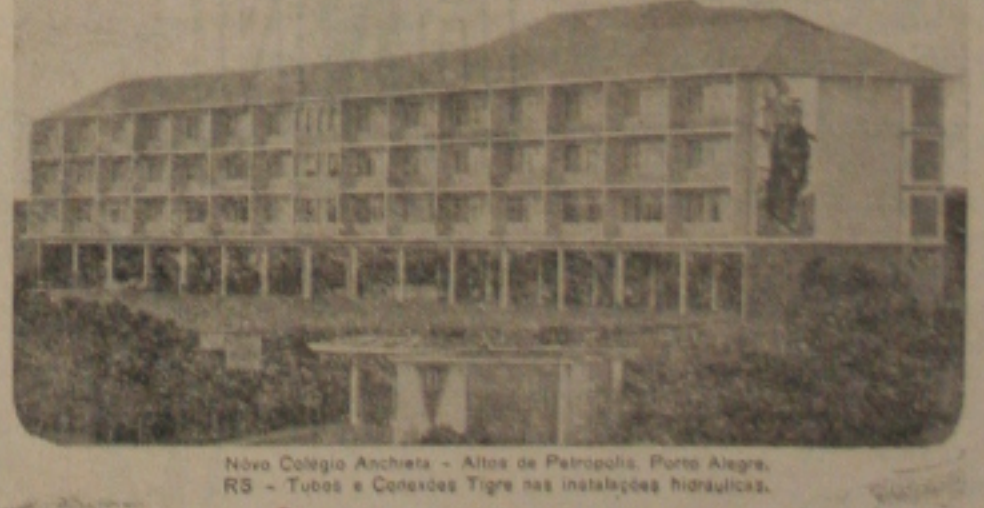
Nova Colégio Anchieta - Alhos de Petropolis, Porto Alegre, RS - Tubos e Conexões Tigre nas instalações hidráulicas.