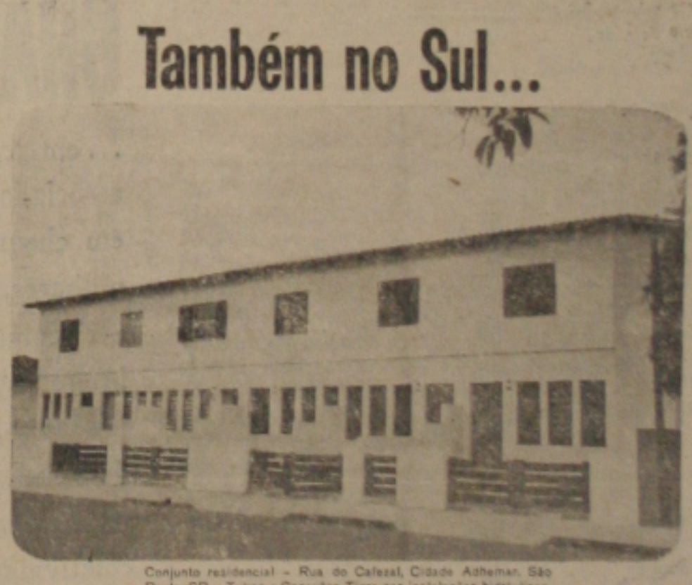
Conjunto residencial - Rua do Café, Cidade Ashemur, São Paulo, SP - Tubos e Conexões Tigre nas instalações hidráulicas.