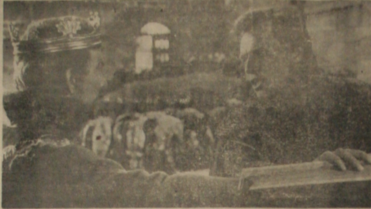
"El Cid" é o melhor filme da semana. Supera Condelabro Italiano" de longe. A foto mostra Charlton Heston e John Fraser numa cena de superes espetáculo de Anthony Mann.

Já repetimos muitas vezes aqui. Apesar dos nossos clamores não serem lá tão bonitos, não somos contra o aumento de ingressos porque conhecemos os gastos que um cinema requer. Mas, meia entrada estudantil nunca deu prejuízo a ninguém. Quem uma prova? Porque é que os senhores proprietários de cinema gostam de programar filmes com censura livre para os dias de domingo? Se desse prejuízo eles não fariam isso. Mas, o "prejuízo"... Ah, leitões de nosso real pensamento do assunto. E voltaremos a ele.