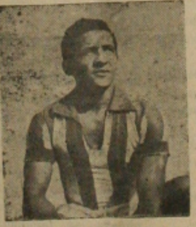
Na foto vemos o ponteiro esquerdo propriense grande arma para o intermunicipal desta tarde.

ESTIVADORES CERTO Em vista disso foi concretizada no dia de ontem a realização de festa das faixas com a participação de Estivadores de Macaé, que perceberá a cota de 400 mil cruzeiros e mais hospedagem.