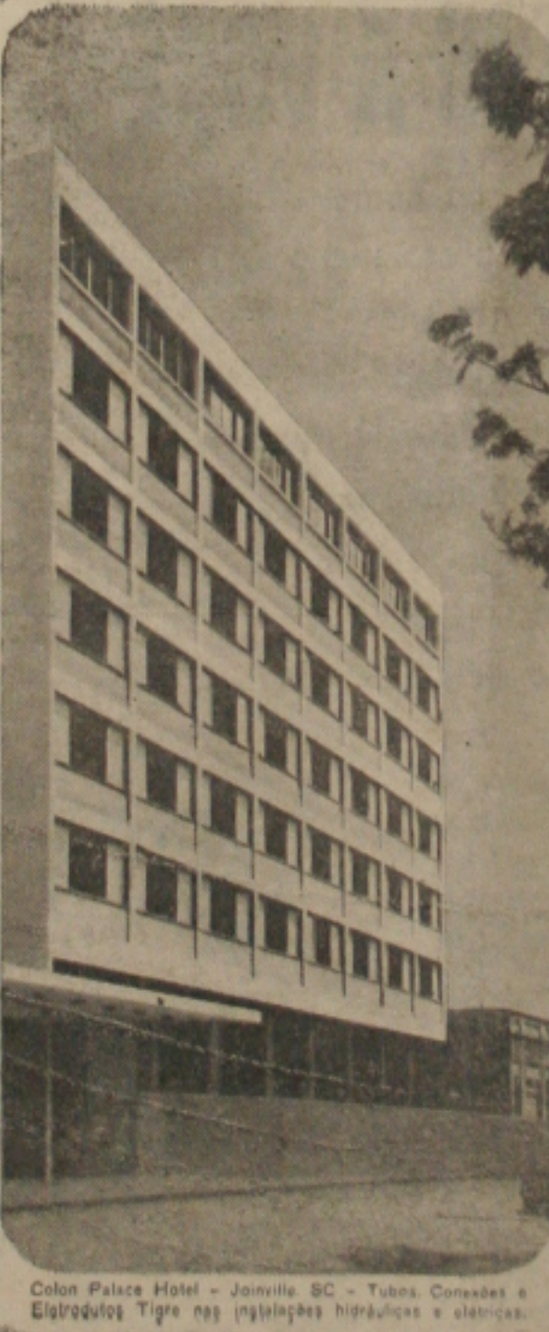
Colon Palace Hotel - Joinville, SC - Tubos Conexões e Eletrodutos Tigre nas instalações hidráulicas e elétricas.